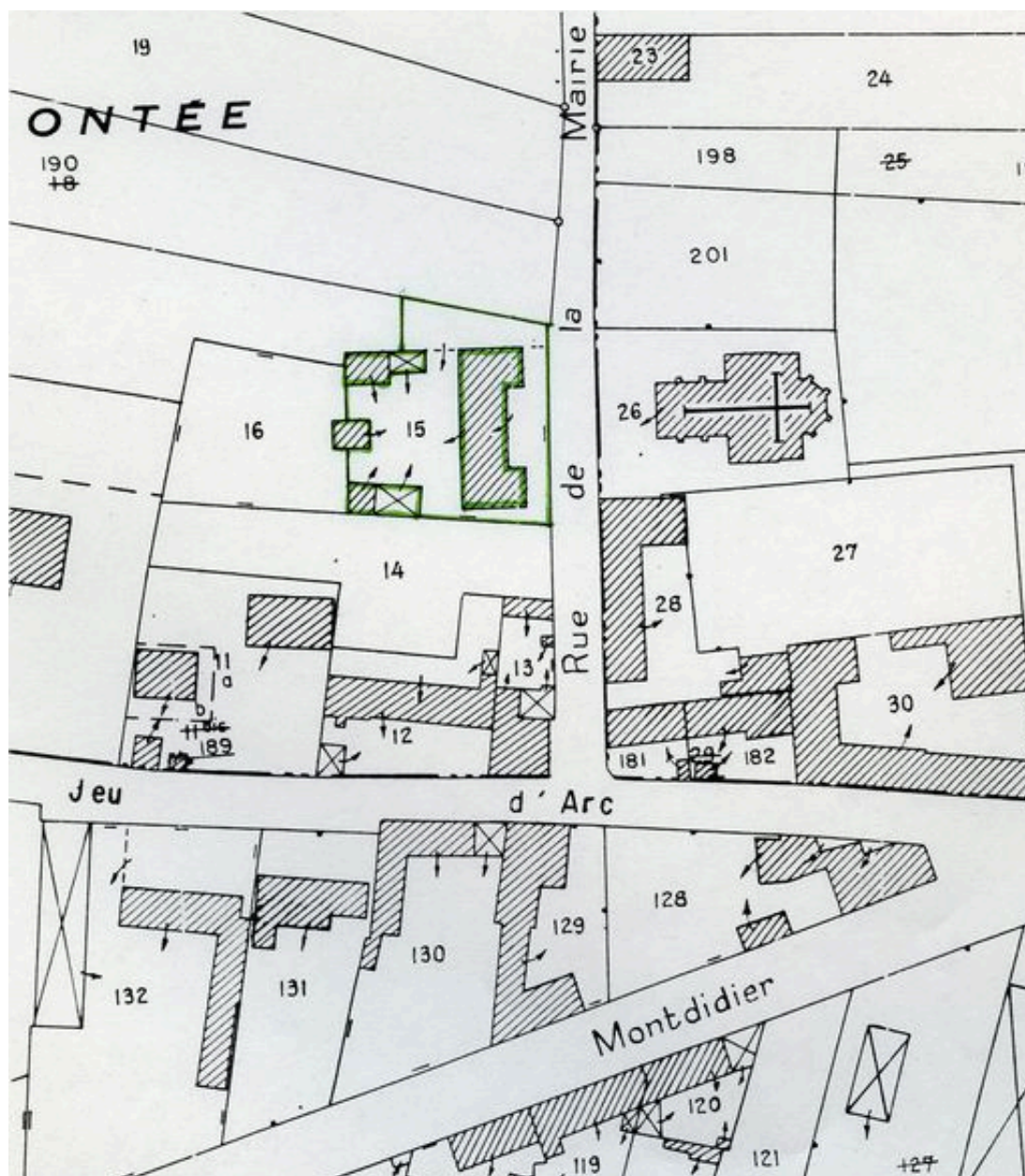
Plan de situation. Extrait du plan cadastral de 1982, section AC 15.