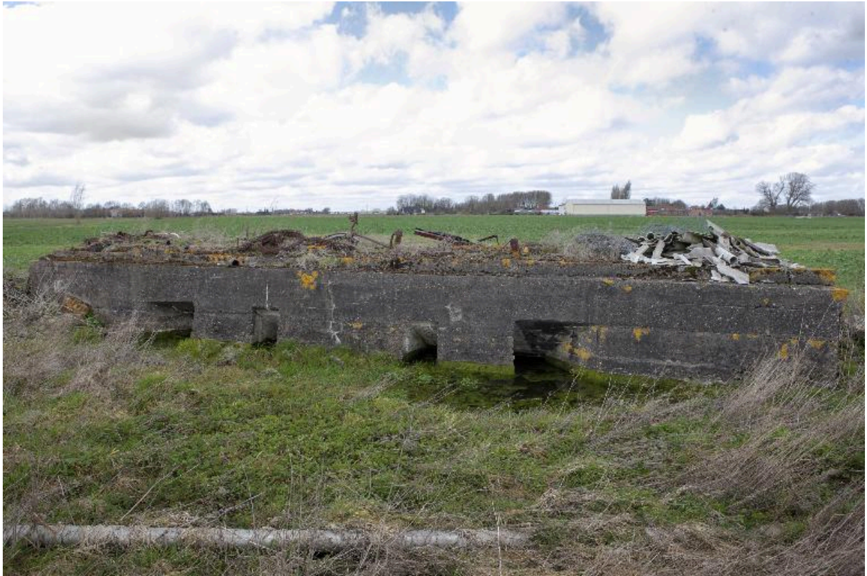
Elévation antérieure (sud-est). On aperçoit les entrées latérales et les resserres à mitrailleuses