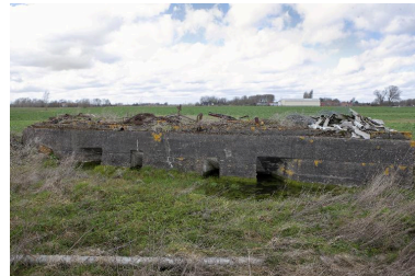
Elévation antérieure (sud-est). On aperçoit les entrées latérales et les resserres à mitrailleuses