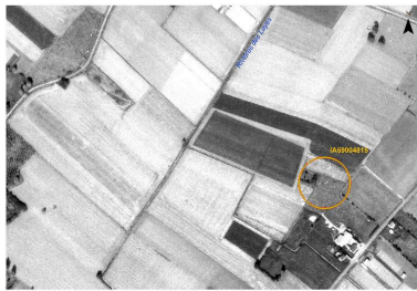
Situation de l'édifice (cercle orange). Montage d'après une photographie aérienne de 1978 (IGN, Geoportail). IVR32_20175900163NUCA