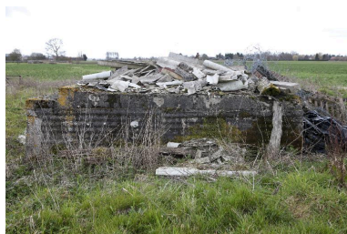
Vue latérale, vers l'ouest IVR31_20145904052NUCA