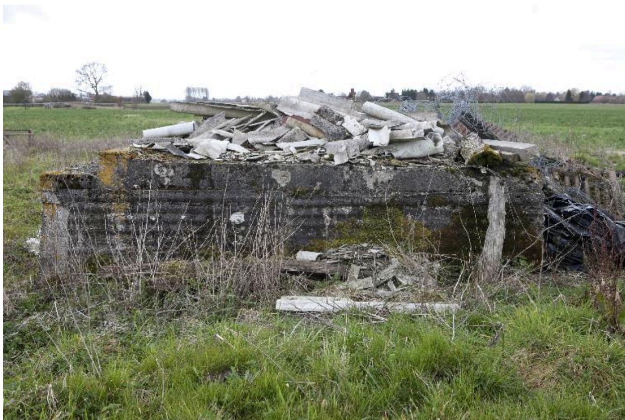
Vue latérale, vers l'ouest