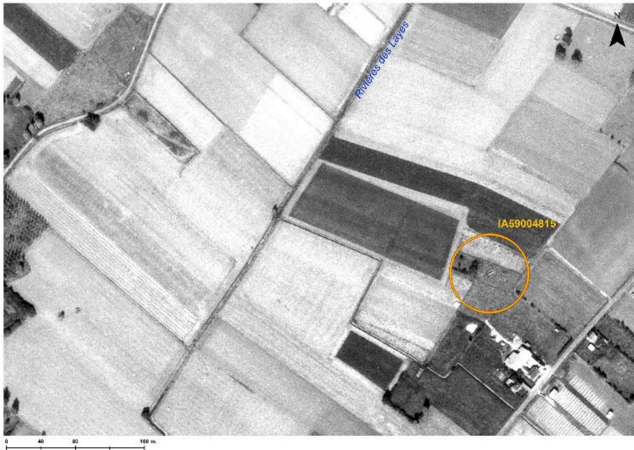
Situation de l'édifice (cercle orange). Montage d'après une photographie aérienne de 1978.