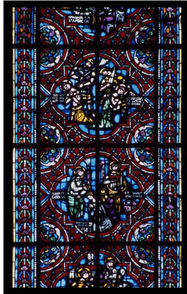
Détail de la partie supérieure de la verrière, réalisée par J. Le Chevallier : saint Gervais et saint Protais baptisent une jeune fille et son père, puis ils subissent le martyre.

IVR22_20030200811VA