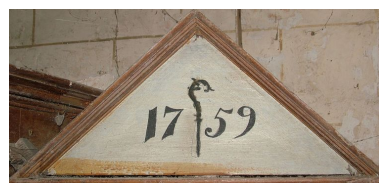
Fronton triangulaire de la loge latérale droite, portant la date de 1759 et la crosse épiscopale. IVR22_20098005365NUCA