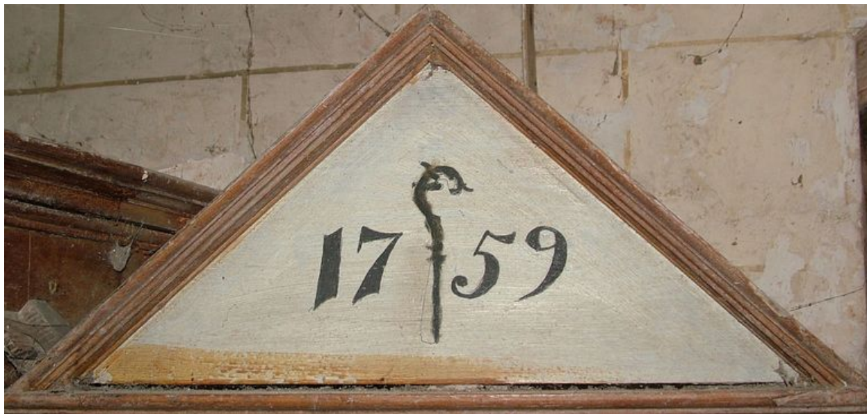
Fronton triangulaire de la loge latérale droite, portant la date de 1759 et la crosse épiscopale.