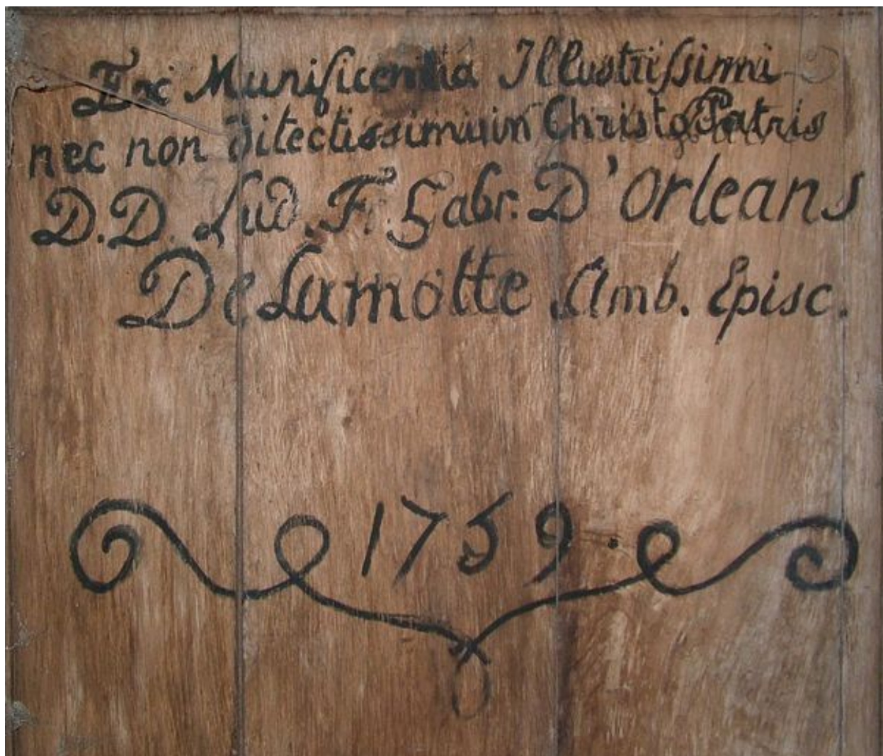
Inscription concernant le donateur et date de 1759 peintes sur la cloison du fond de la loge centrale.