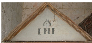
Fronton triangulaire de la loge latérale gauche, portant le symbole IHS et une mitre. IVR22_20098005366NUCA