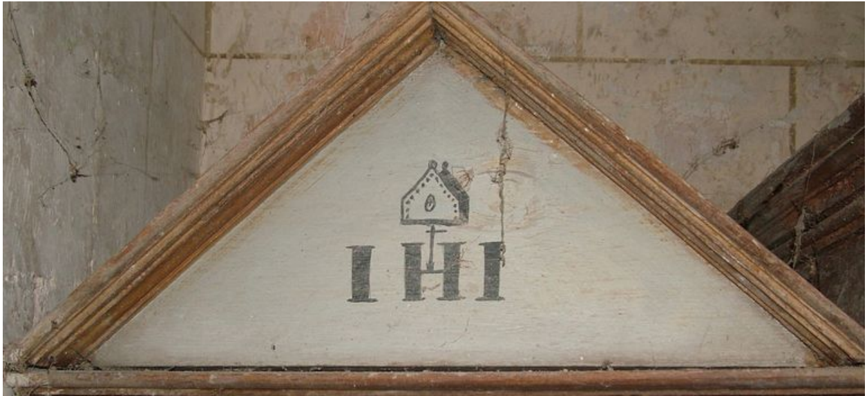
Fronton triangulaire de la loge latérale gauche, portant le symbole IHS et une mitre.