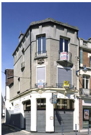
Vue générale. IVR31_20086200148XE