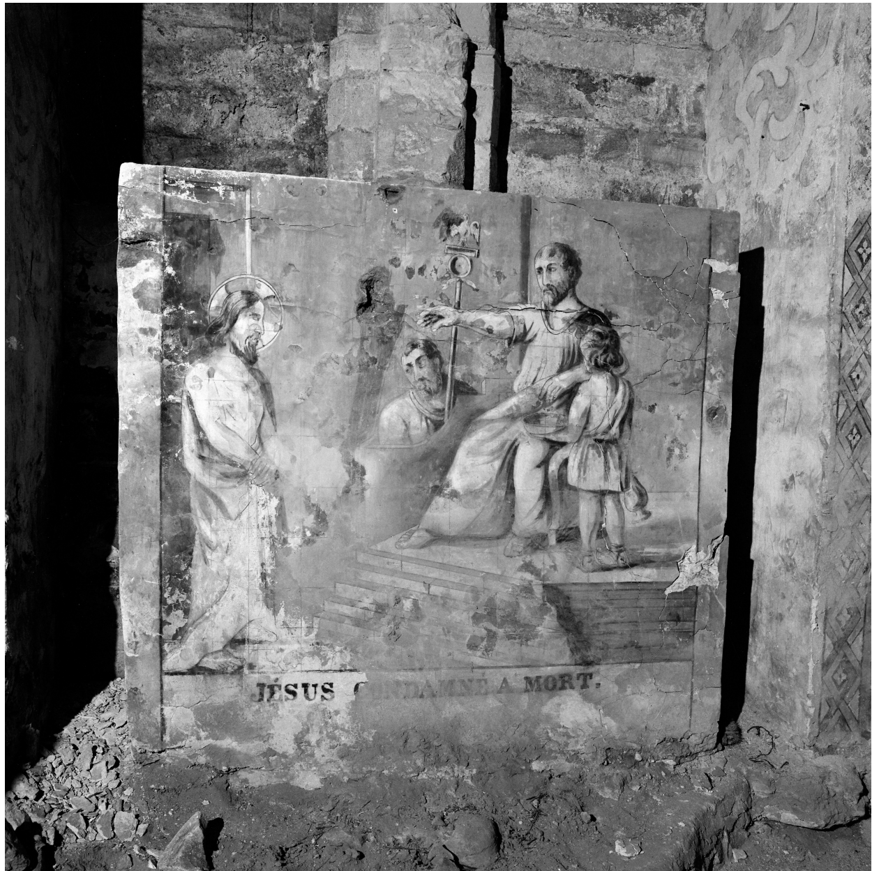
Parmi les scènes et le paysage représentés : Jésus devant Pilate (condamné à mort), vue générale.