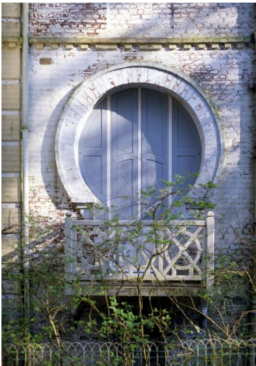
Détail d'une baie de la façade postérieure, devancée par un balcon en bois.