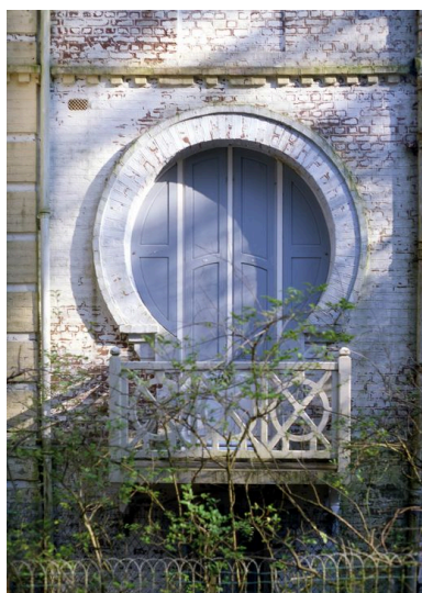
Détail d'une baie de la façade postérieure, devancée par un balcon en bois.