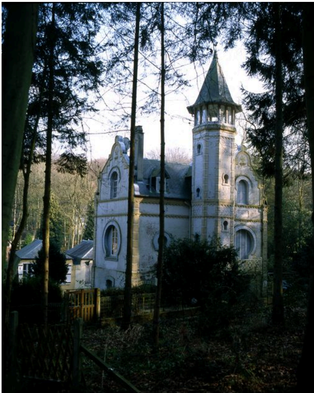
Vue de trois-quarts sur les élévations latérale droite et postérieure.