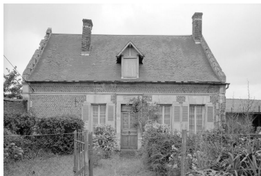
Logis. Elévation antérieure. IVR22_19846000959X