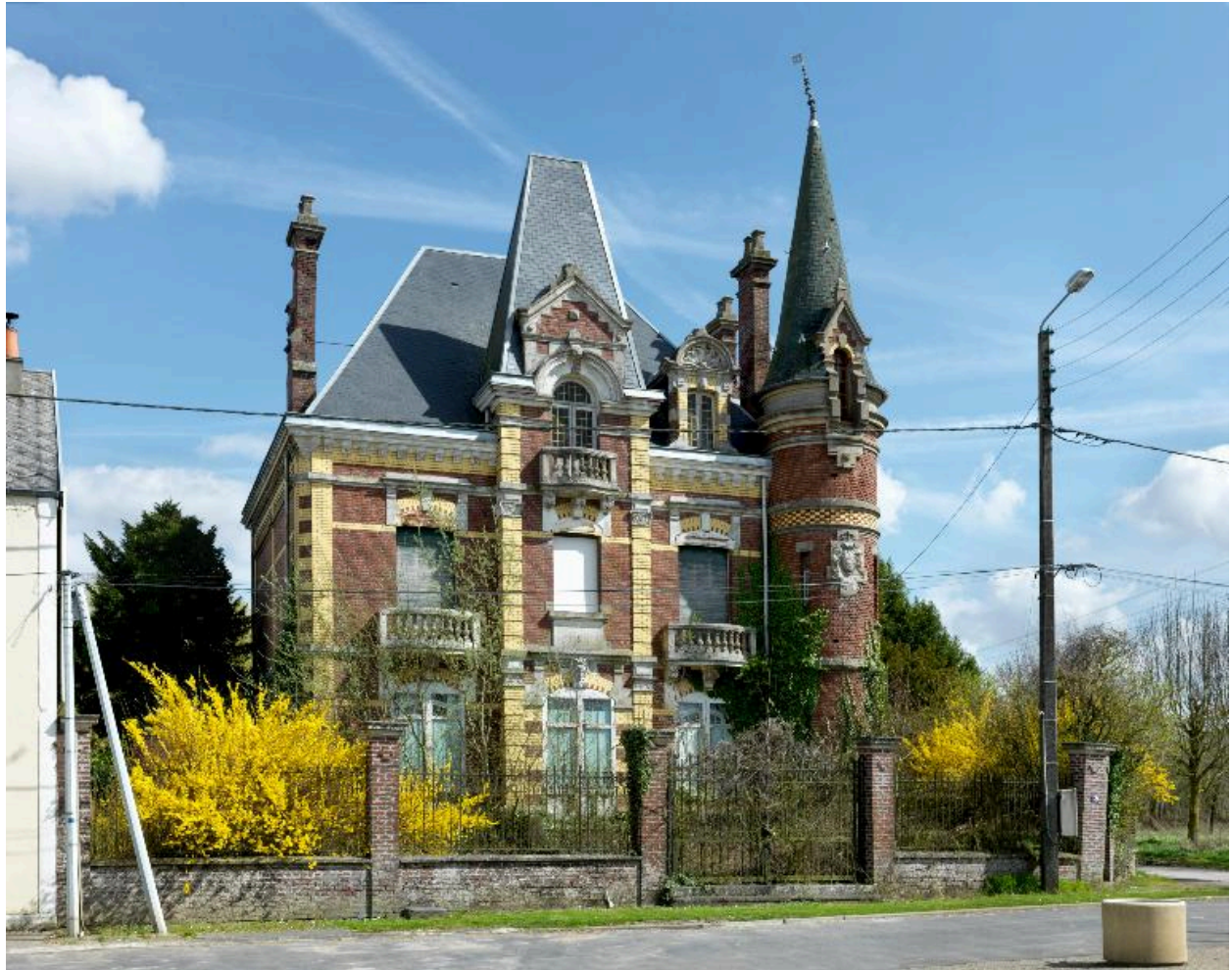
Vue d'ensemble sur rue, de face.