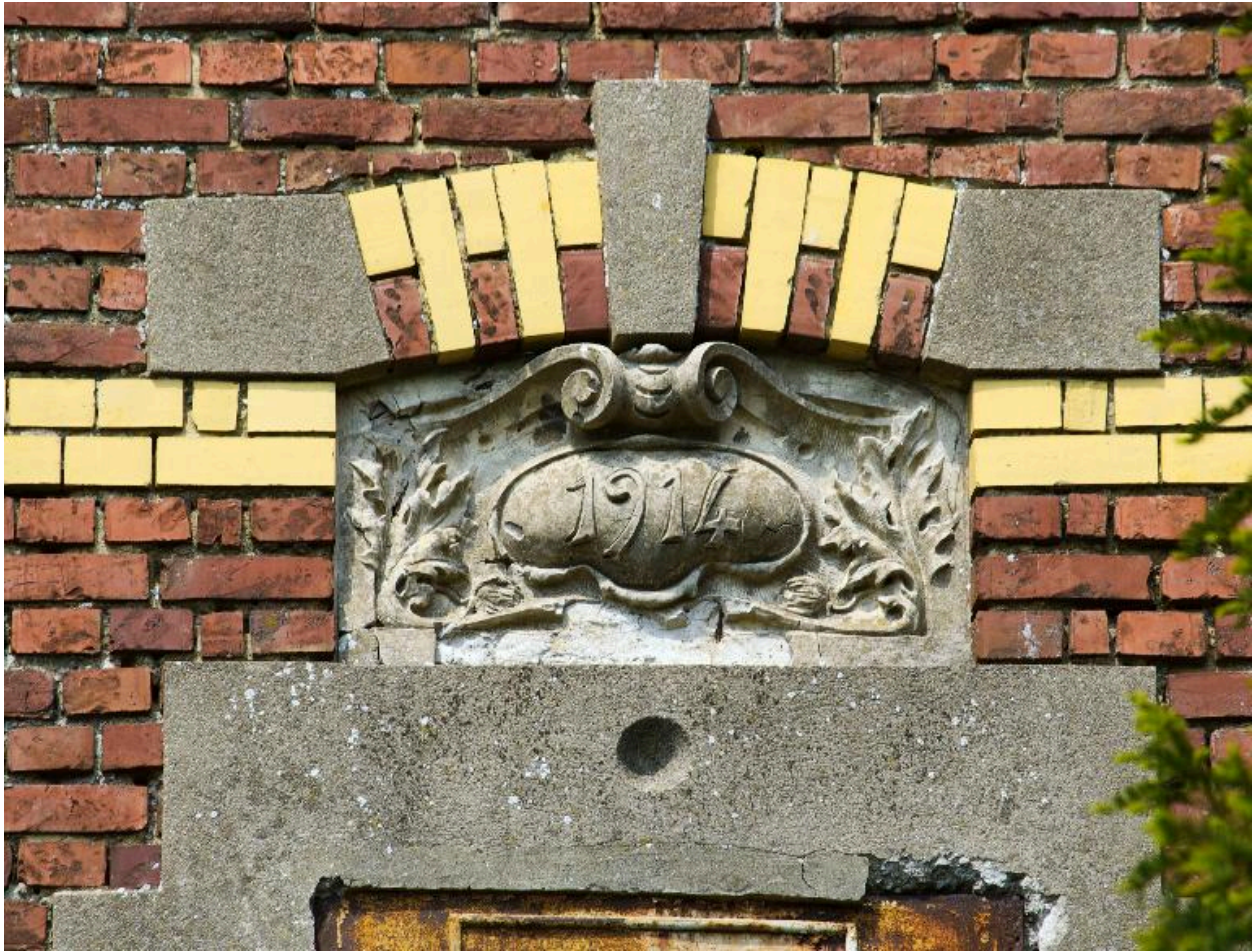
Détail du cartouche portant la date de 1914.