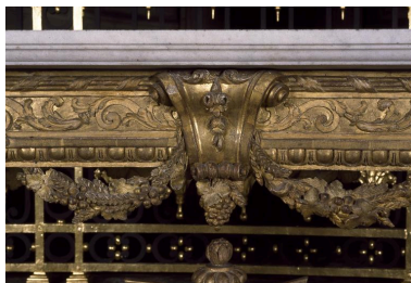
Détail d'une crédence : décor de la partie centrale de la ceinture.

Phot. Irwin Leullier IVR22_20010202343ZA