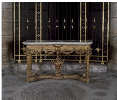
La seconde crédence, vue de face.