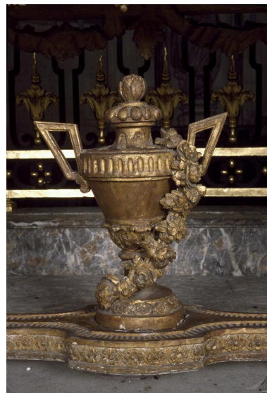
Détail d'une crédence : vase ornant l'entablement.

IVR22_20010202347ZA