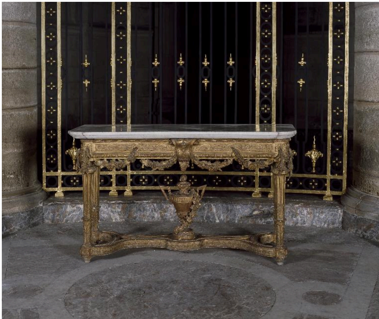
La seconde crédence, vue de face.