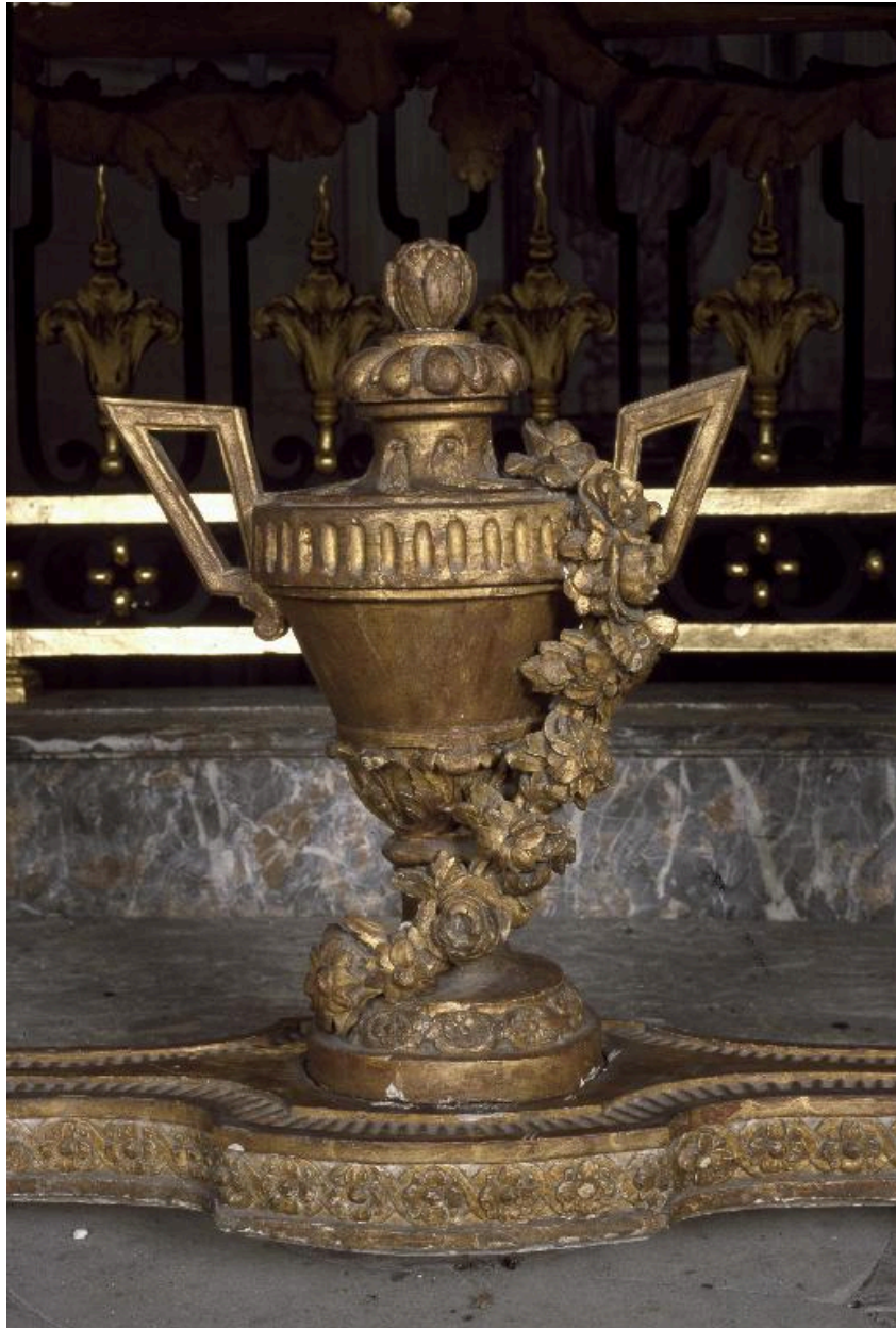
Détail d'une crédence : vase ornant l'entretoise.