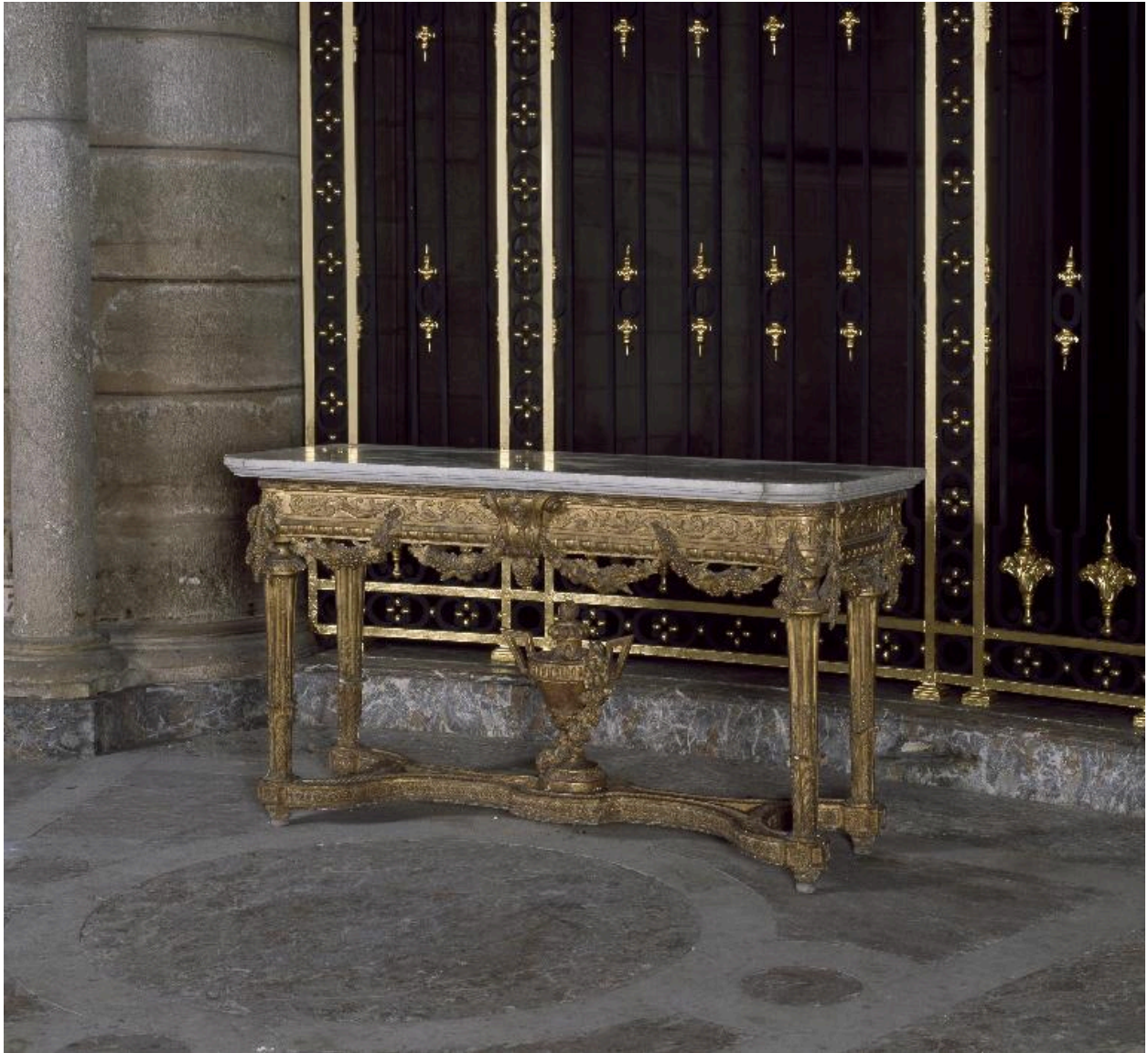
La seconde crédence, vue de trois-quarts.