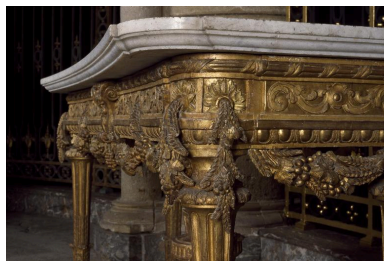
Détail d'une crédence : profil de la ceinture et du plateau.

IVR22_20010202343ZA