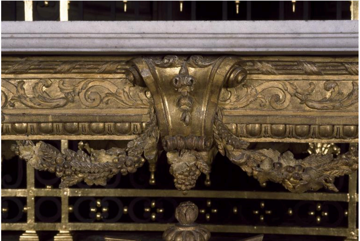
Détail d'une crédence : décor de la partie centrale de la ceinture.