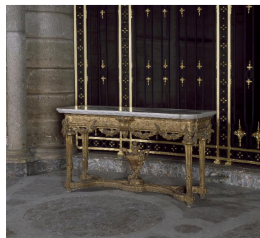
La seconde crédence, vue de trois-quarts.