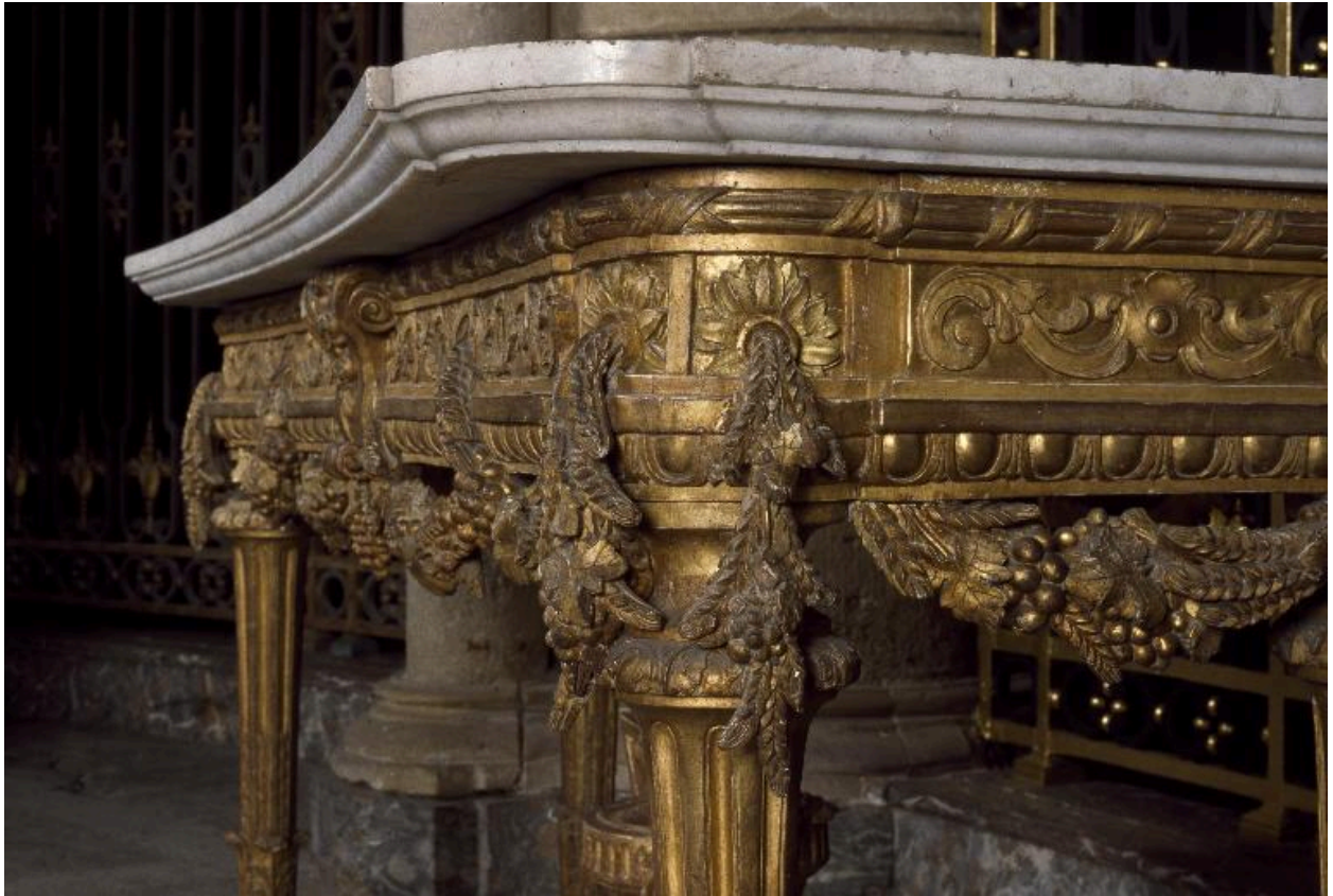
Détail d'une crédence : profil de la ceinture et du plateau.