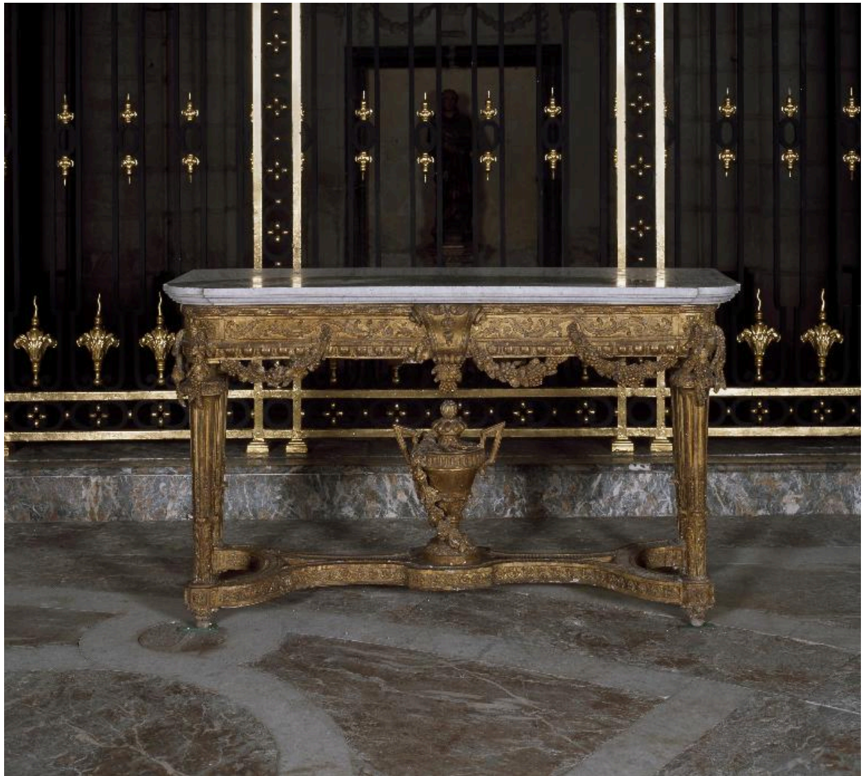
Vue générale de la première crédence.