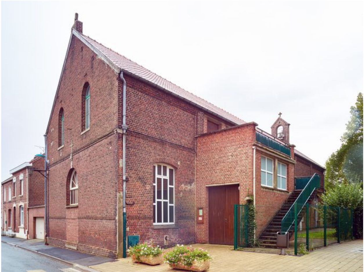
Élévation antérieure de l'église, de trois quart.