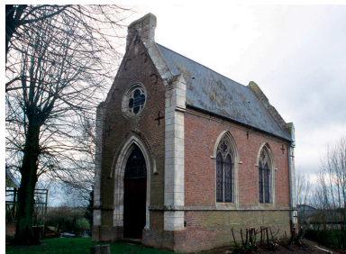
Vue générale. IVR22_19998000423ZA