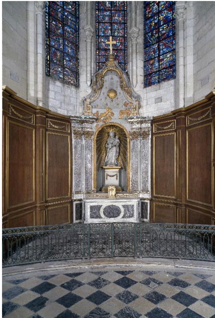
Vue générale de la chapelle de la Vierge.