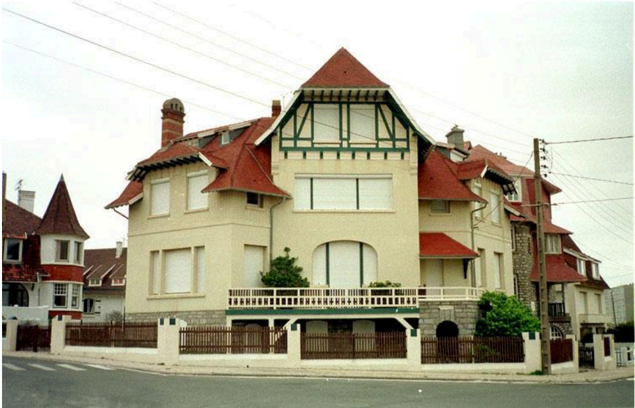
Vue d'ensemble de trois quarts.