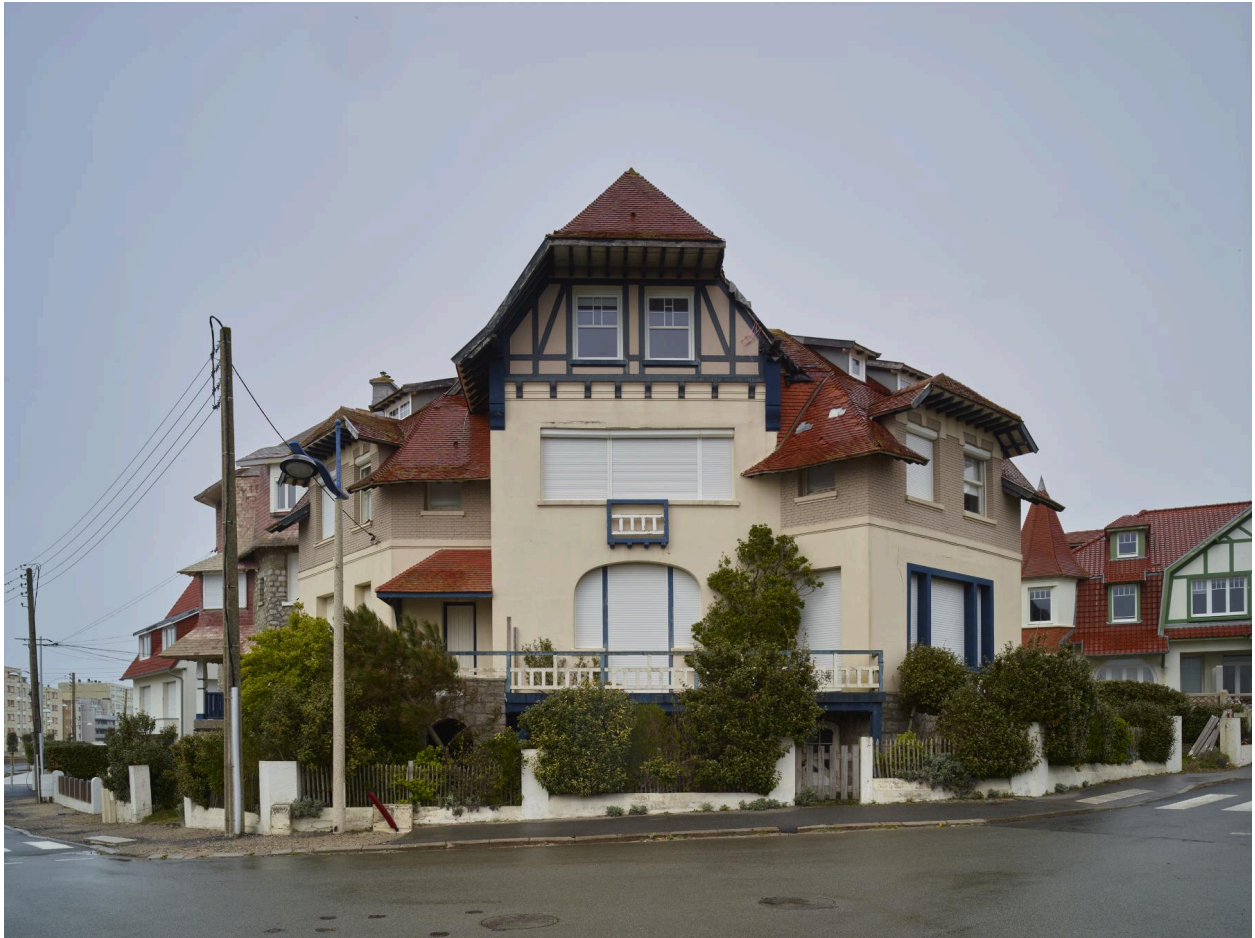
Vue de la façade en 2024.