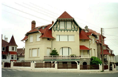
Vue d'ensemble de trois quarts. IVR31_19966201609ZE