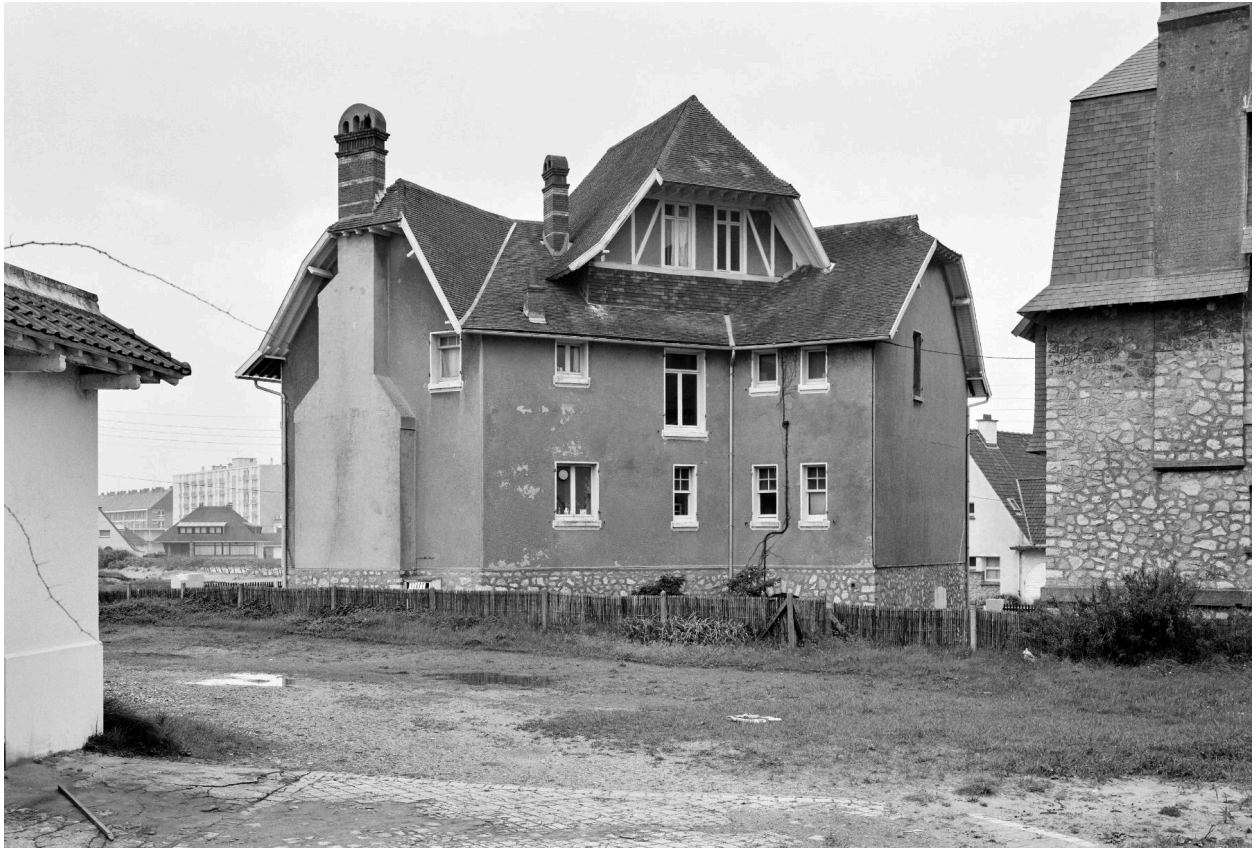
Villa Les Bernaux, façade sur jardin.