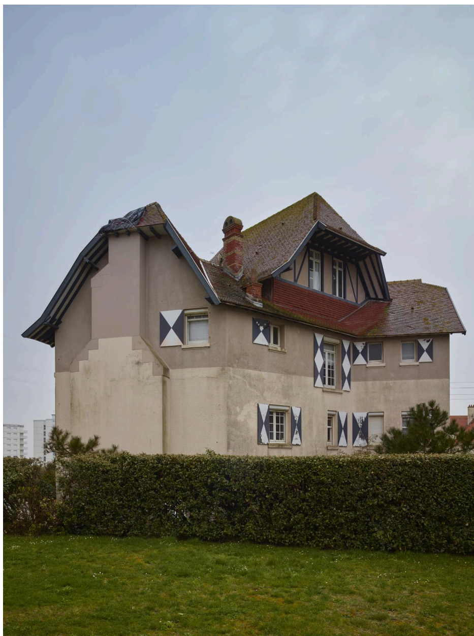
Vue de la façade sur jardin en 2024.