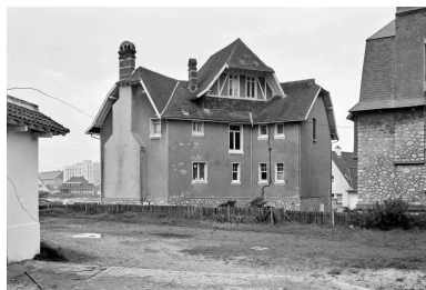
Villa Les Bernaux, façade sur jardin. IVR31_19816202917X