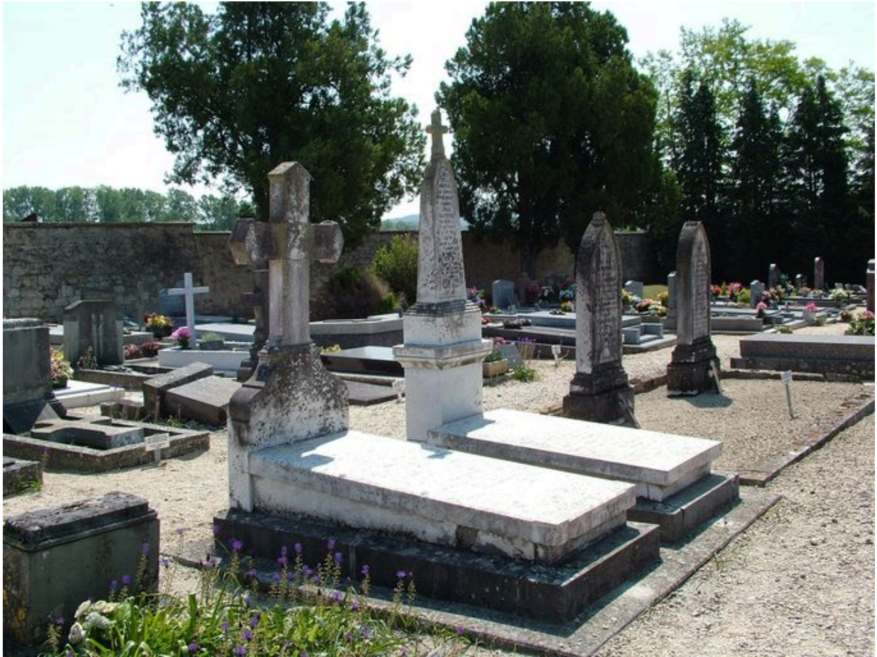
Vue de tombes du 19e siècle.