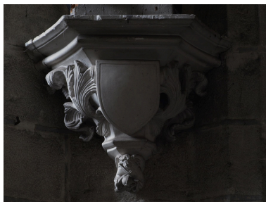
Vue de détail, culot. IVR31_20106207179NUCA