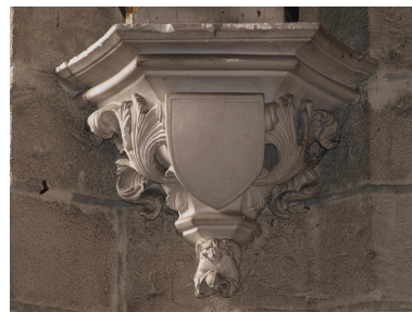
Vue de détail, culot. IVR31_20106207180NUCA