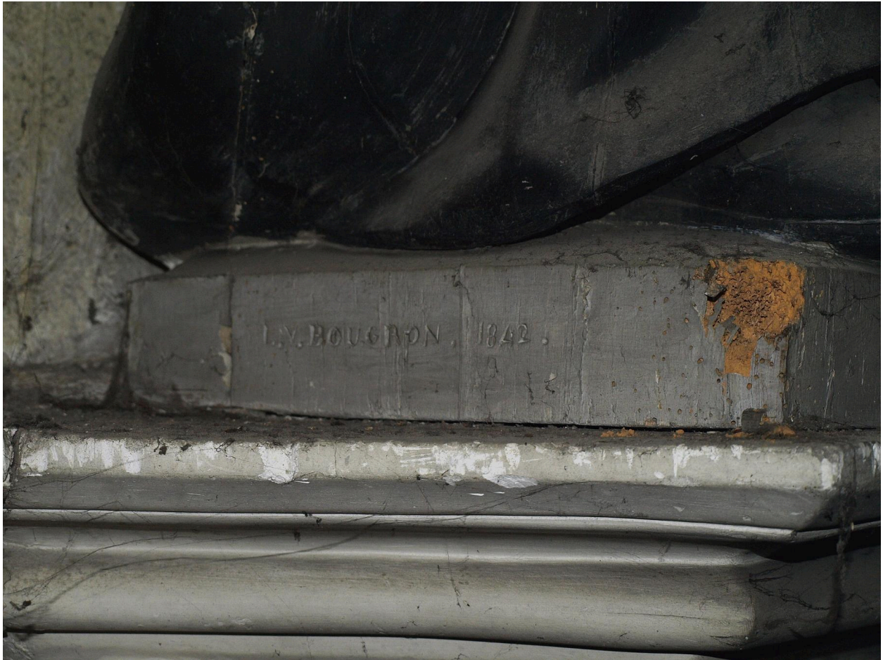
Vue de détail, signature.