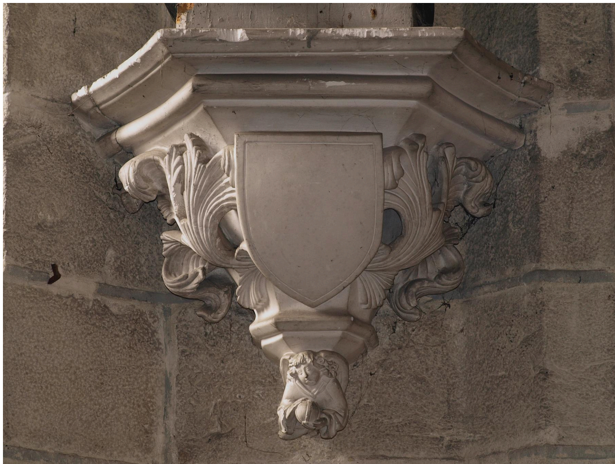
Vue de détail, culot.