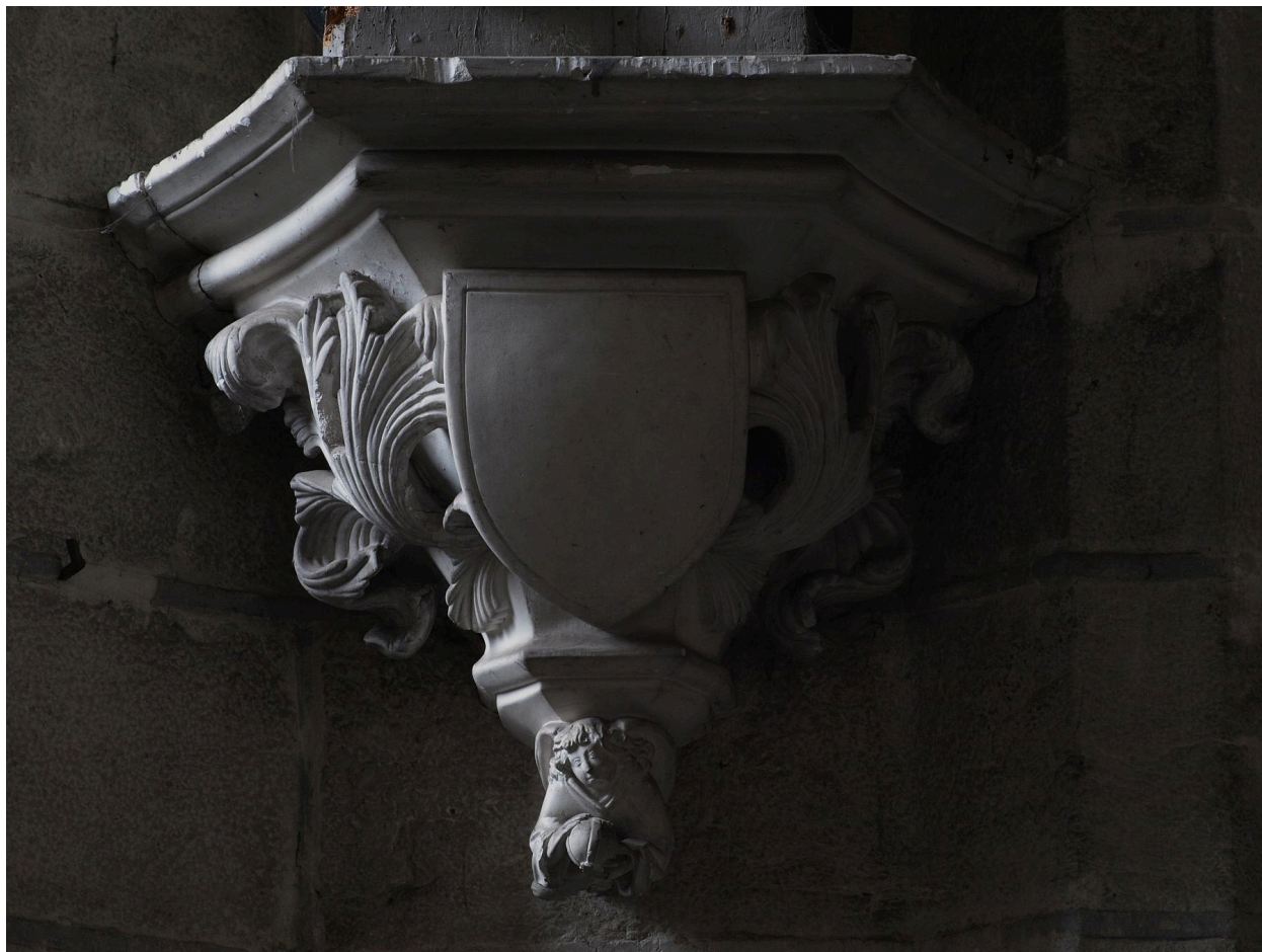
Vue de détail, culot.