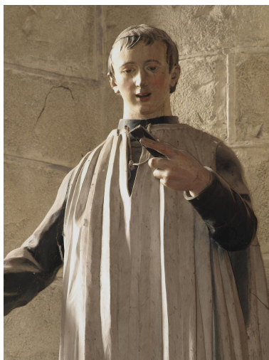
Vue partielle. IVR31_20106207177NUCA