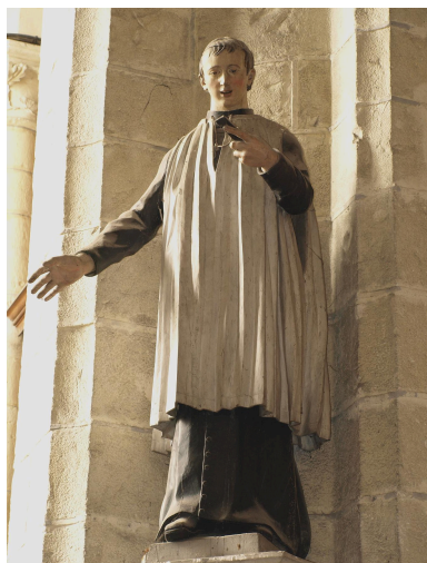
Vue générale. IVR31_20106207175NUCA