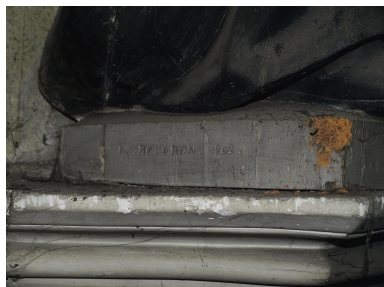
Vue de détail, signature. IVR31_20106207178NUCA