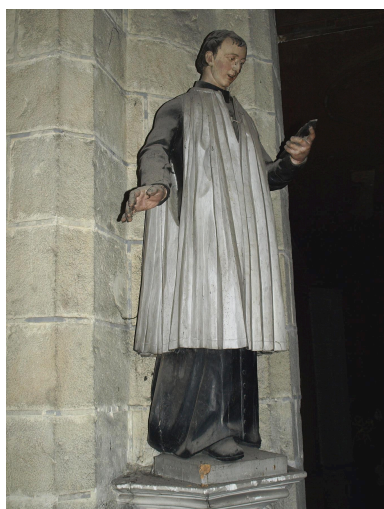
Vue générale.