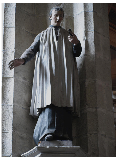
Vue générale.