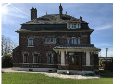
Vue générale, façade nord sur jardin. IVR32_20170205048NUCA