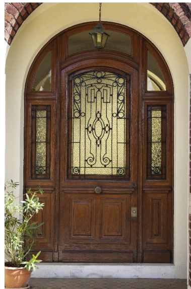
Porte d'entrée principale, détail. IVR32_20170200121NUC2A