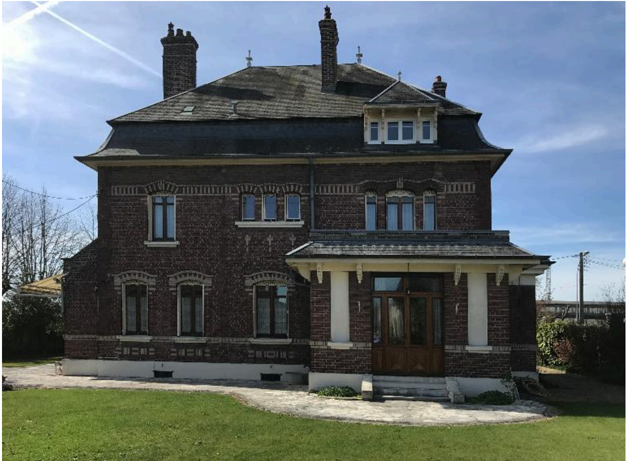
Vue générale, façade nord sur jardin.