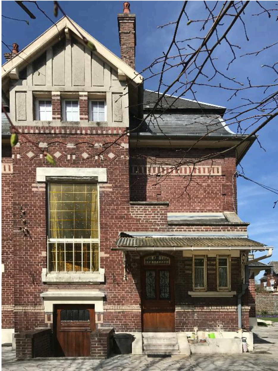
Façade latérale sud, vue partielle.