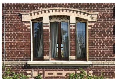
Détail d'une fenêtre en triplet.