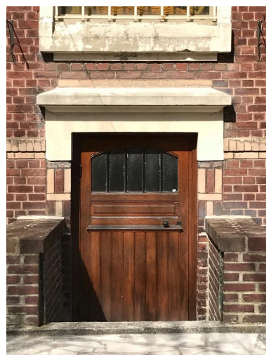
Détail de la porte de service en demi-sous-sol. IVR32_20170205051NUCA