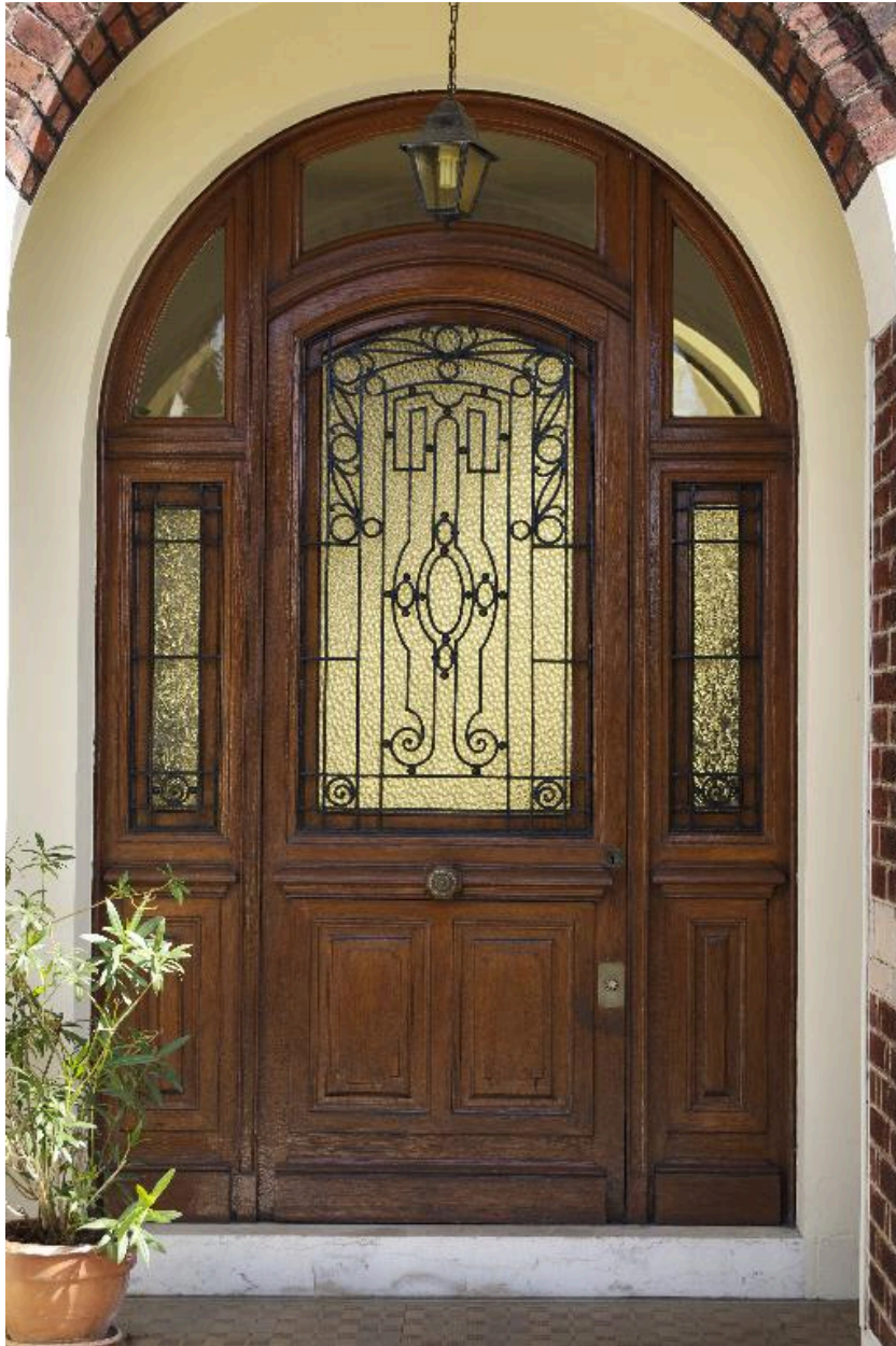
Porte d'entrée principale, détail.