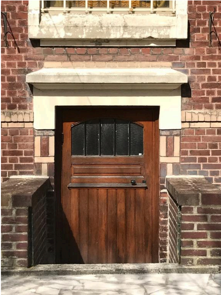
Détail de la porte de service en demi-sous-sol.