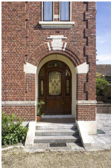
Porte d'entrée principale, vue générale. IVR32_20170200120NUC2A