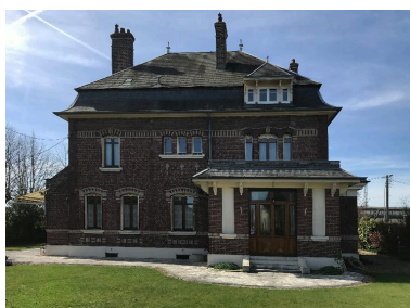
Vue générale, façade nord sur jardin. IVR32_20170205048NUCA