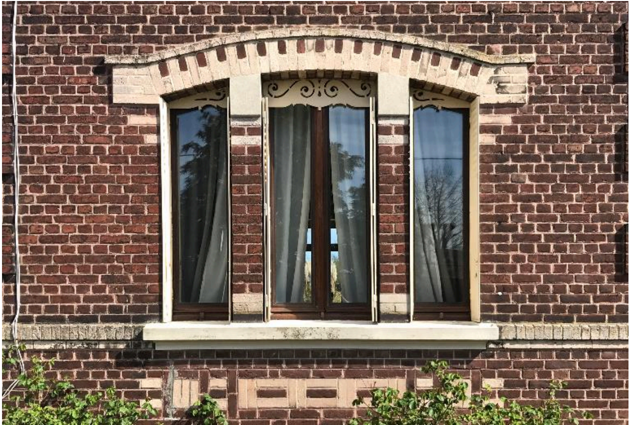
Détail d'une fenêtre en triplet.