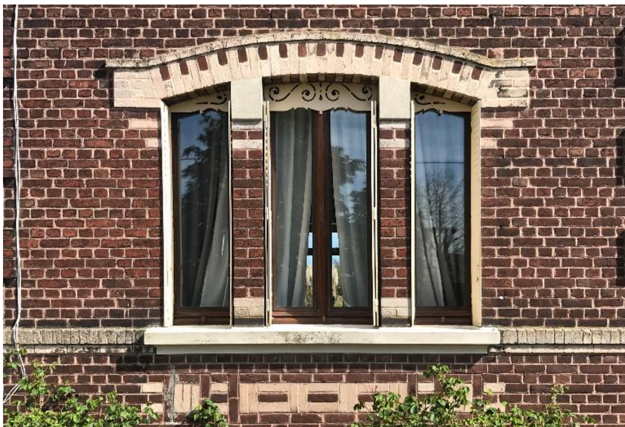
Détail d'une fenêtre en triplet.