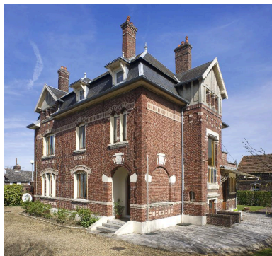
Vue générale. IVR32_20170200119NUC2AQ