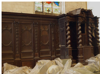
Vue générale, bas-côté nord IVR31_20106202083NUCA