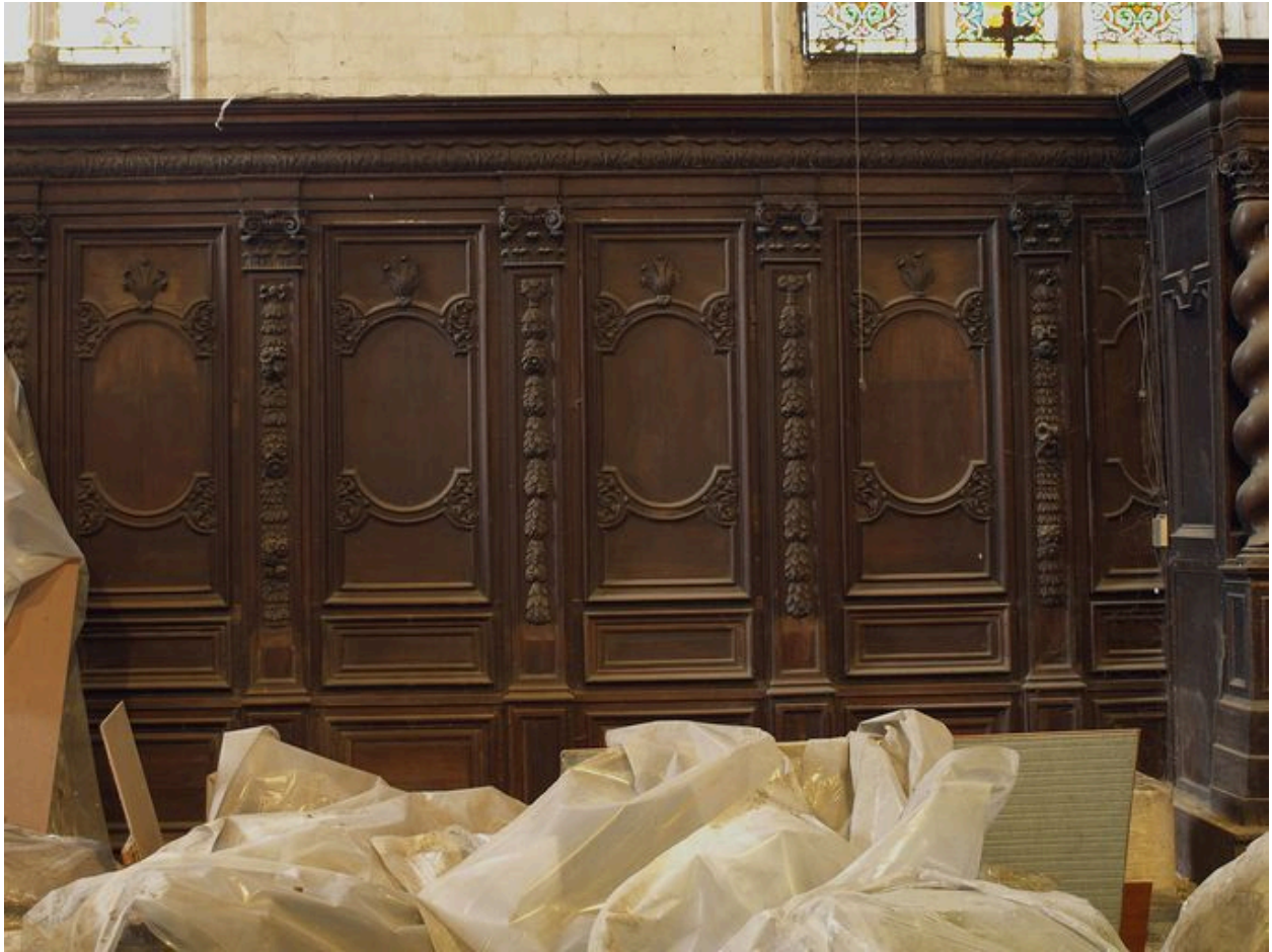
Vue partielle, bas-côté nord