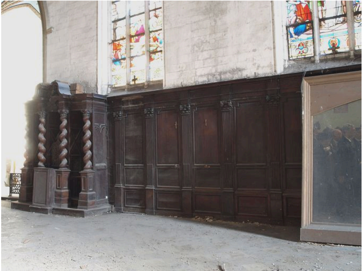
Vue générale, bas-côté sud