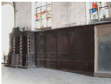
Vue générale, bas-côté sud