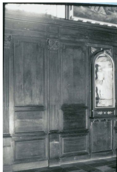
Vue de détail, bas-côté sud IVR31_20106202217NUC