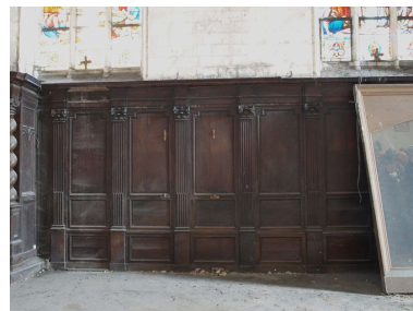
Vue partielle, bas-côté sud