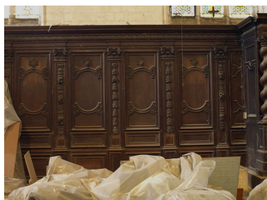
Vue partielle, bas-côté nord