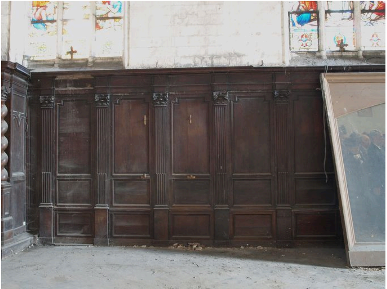
Vue partielle, bas-côté sud