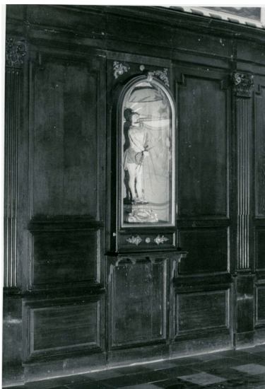
Vue de détail, bas-côté sud IVR31_20106202218NUC