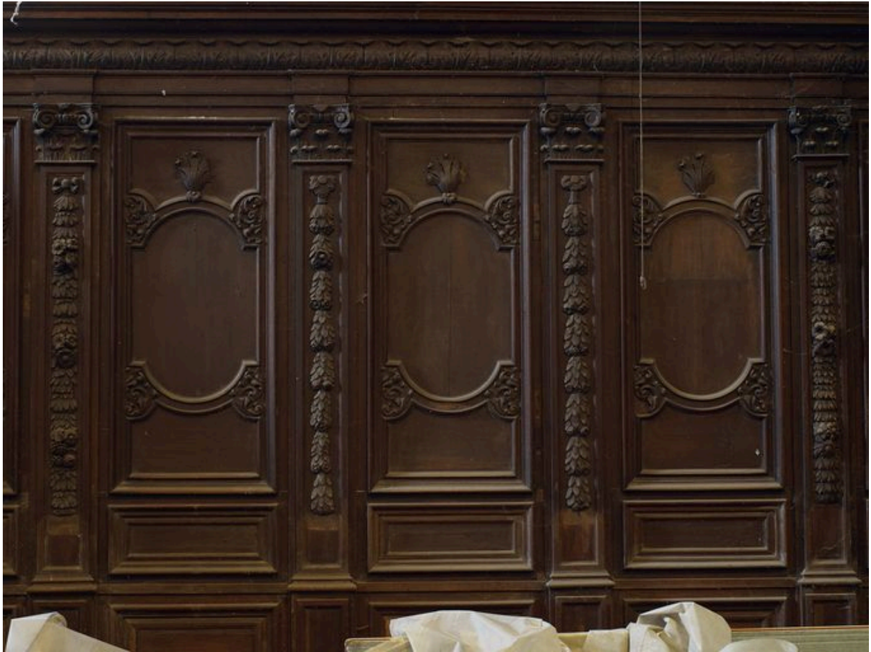
Vue de détail, bas-côté nord