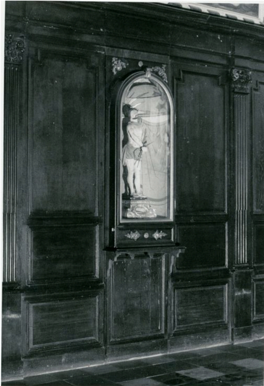
Vue de détail, bas-côté sud