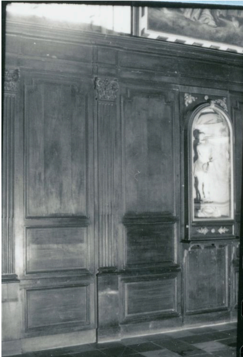
Vue de détail, bas-côté sud