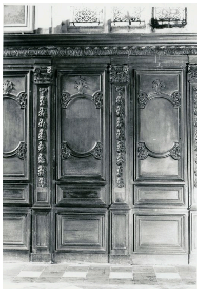
Vue de détail, bas-côté nord IVR31_20106202088NUC