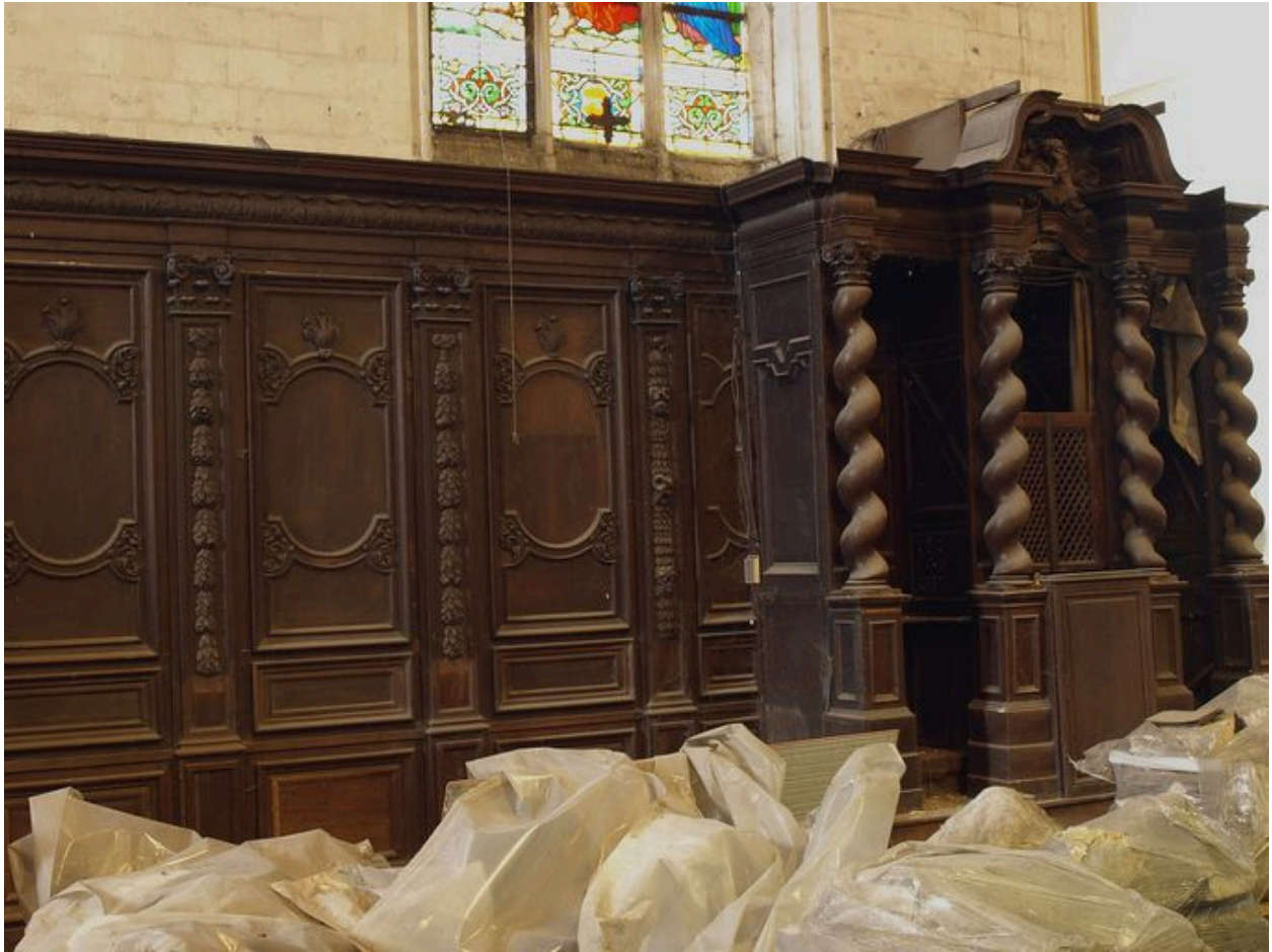
Vue générale, bas-côté nord