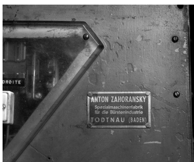
Détail de la plaque signalétique. IVR22_19996000002X