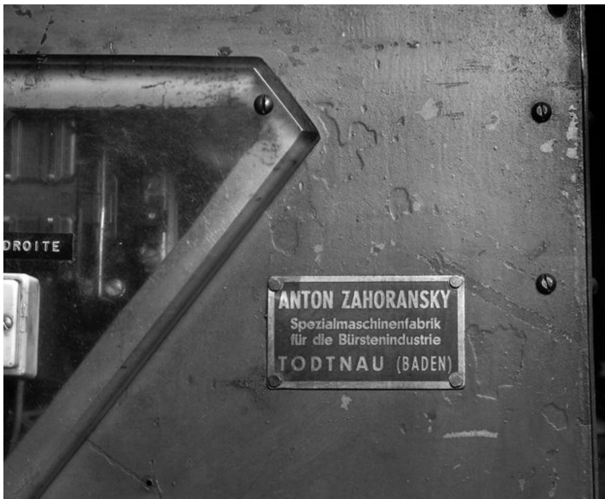
Détail de la plaque signalétique.