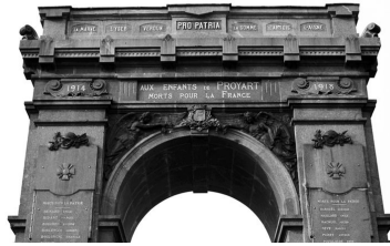
Vue de détail sur la partie supérieure du monument. IVR22_19968000070Z