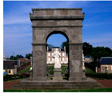
Vue postérieure du monument avec la demeure de l'industriel à l'arrière-plan. IVR22_19948000491ZA