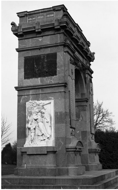
Vue de trois-quarts. IVR22_19968000072Z