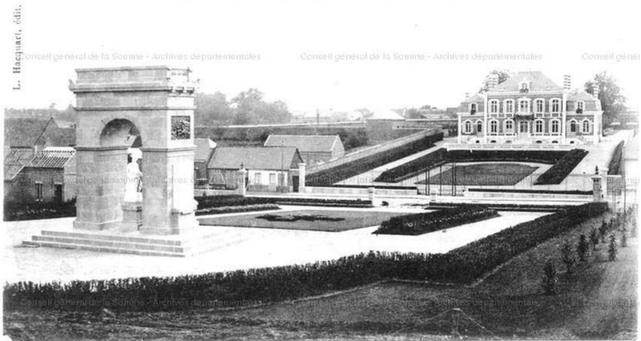
Vue ancienne avec le château.