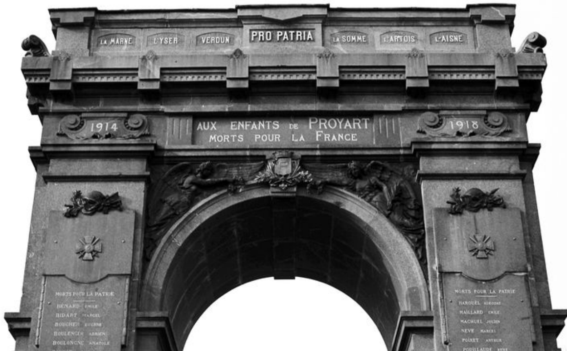
Vue de détail sur la partie supérieure du monument.