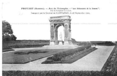
Vue ancienne (AD Somme). IVR22_20118005011NUCA