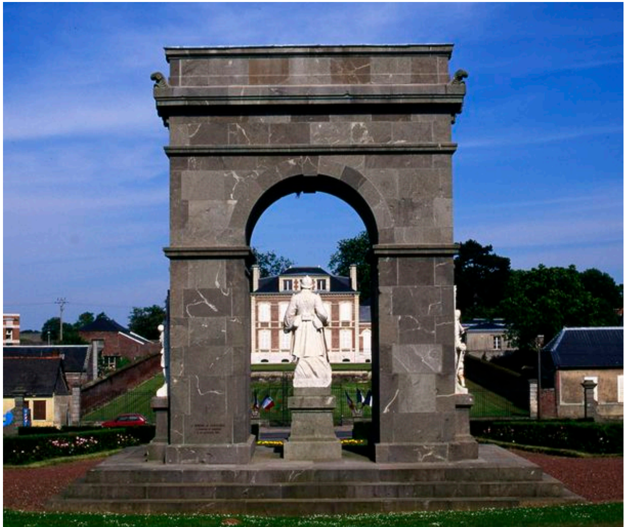
Vue postérieure du monument avec la demeure de l'industriel à l'arrière-plan.