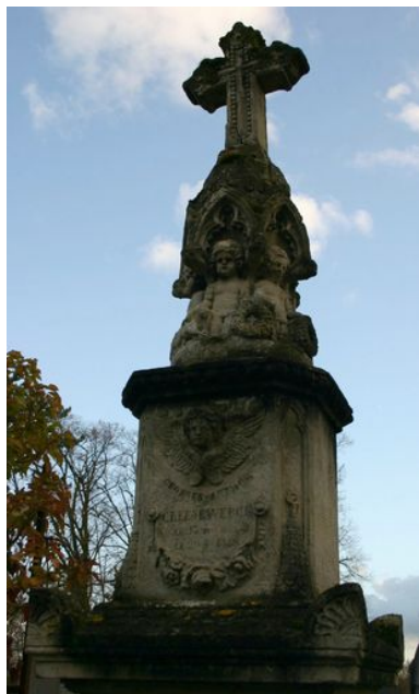
Détail de la partie supérieure sculptée.

IVR22_20098001649NUCA