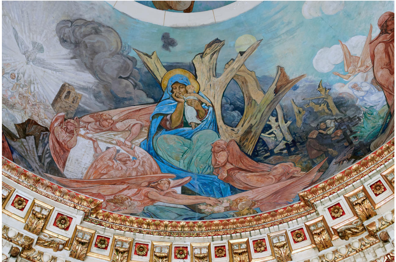
Détail : la scène de la Vierge et l'Enfant contemplant les désastres de la guerre.