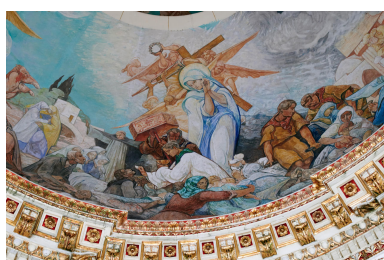
Détail : la scène de la Vierge poursuivant au ciel sa missions sur terre, saint Dominique à ses pieds.