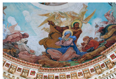
Détail : la scène de la Nativité, de l'adoration des mages et des bergers. IVR32_20226200095NUCA