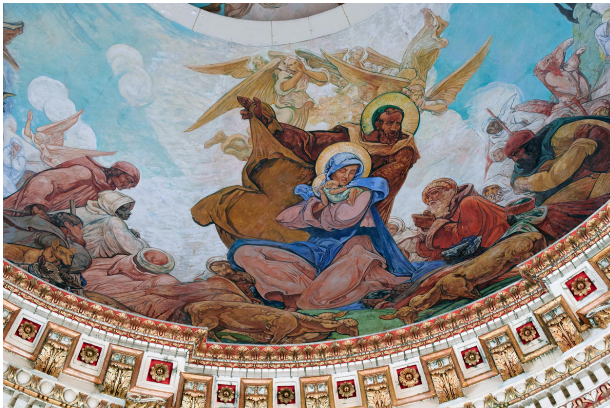
Détail : la scène de la Nativité, de l'adoration des mages et des bergers.