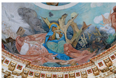
Détail : la scène de la Vierge et l'Enfant contemplant les désastres de la guerre. IVR32_20226200094NUCA