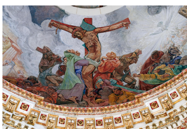
Détail : la scène de la Crucifixion.