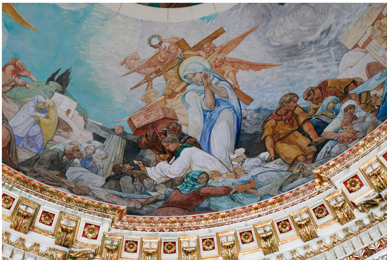
Détail : la scène de la Vierge poursuivant au ciel sa missions sur terre, saint Dominique à ses pieds.