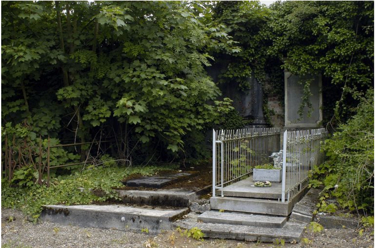
Vue de situation : concession 125 à gauche de l'image.