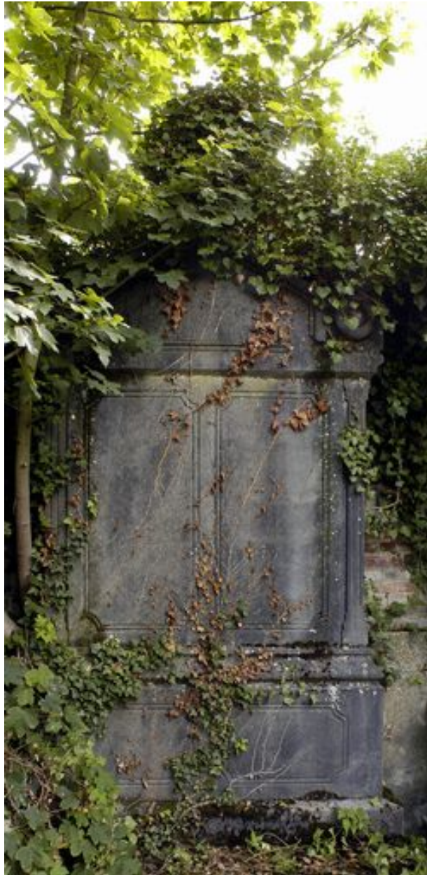
Vue de la stèle.