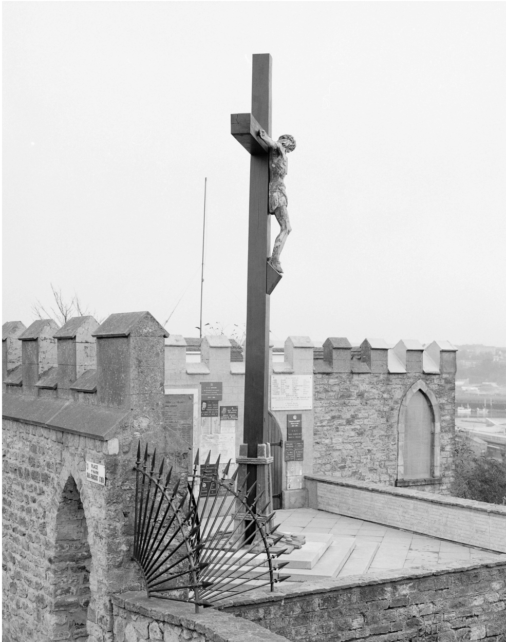
Vue générale d'angle.