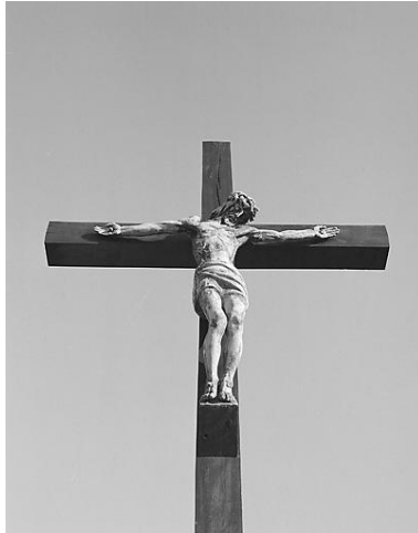
Christ en croix, face. IVR31_19946200039X