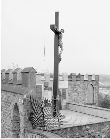
Vue générale d'angle. IVR31_19946200036X