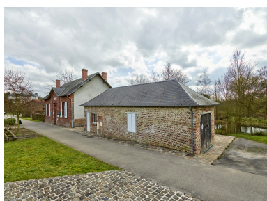
Vue de la maison, depuis l'ouest.