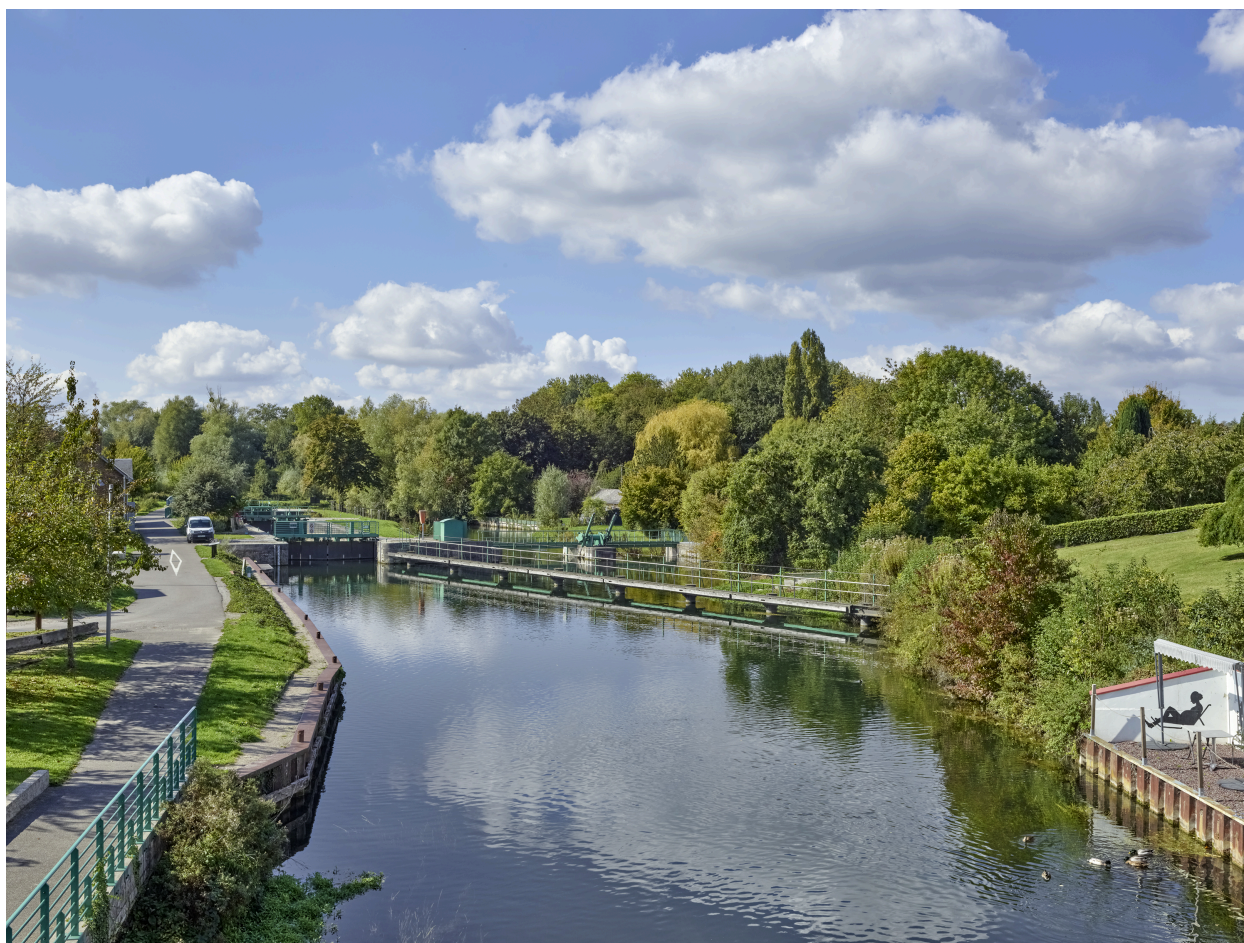
Vue de l'écluse depuis le pont.