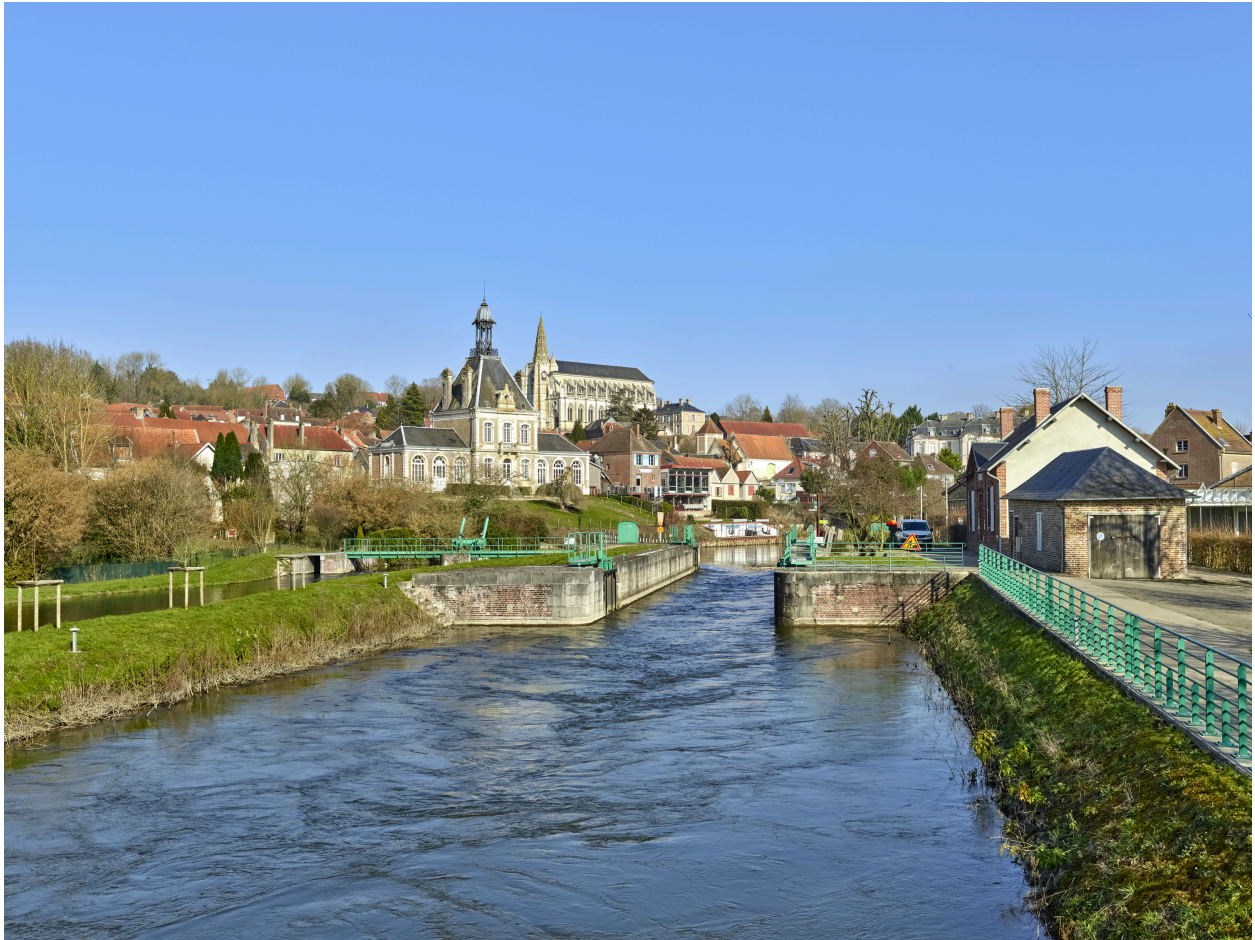
Vue de l'écluse, depuis l'ouest.