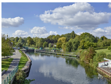
Vue de l'écluse depuis le pont.