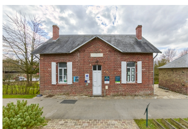
Vue de la maison, depuis le nord.