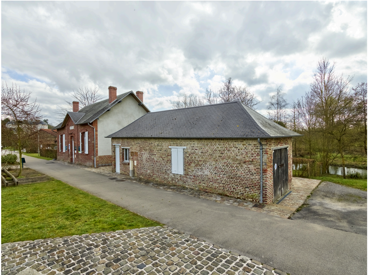
Vue de la maison, depuis l'ouest.