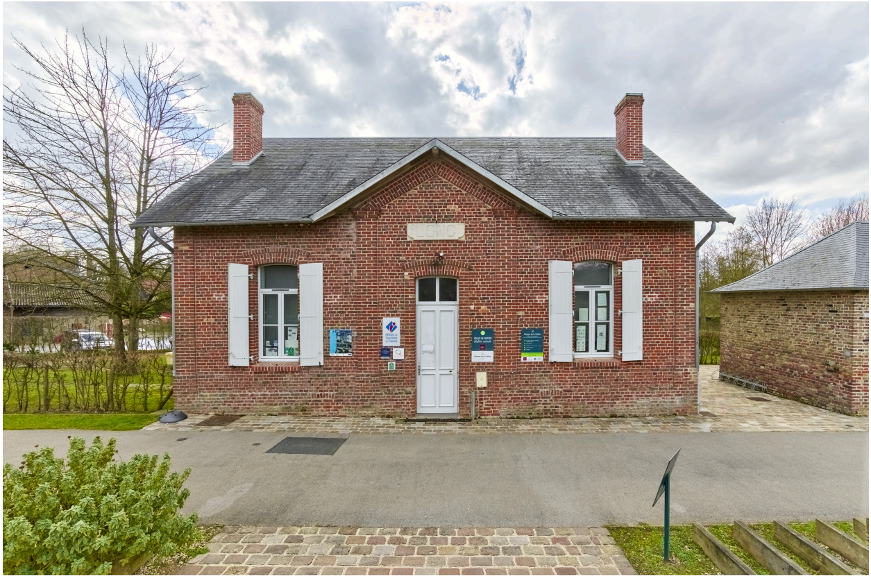
Vue de la maison, depuis le nord.