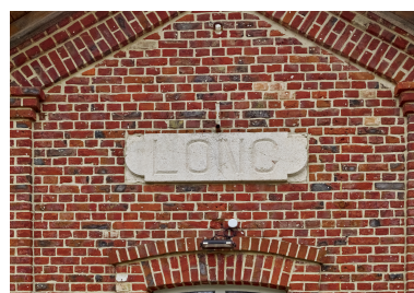
Inscription "LONG" sur la maison éclusière.