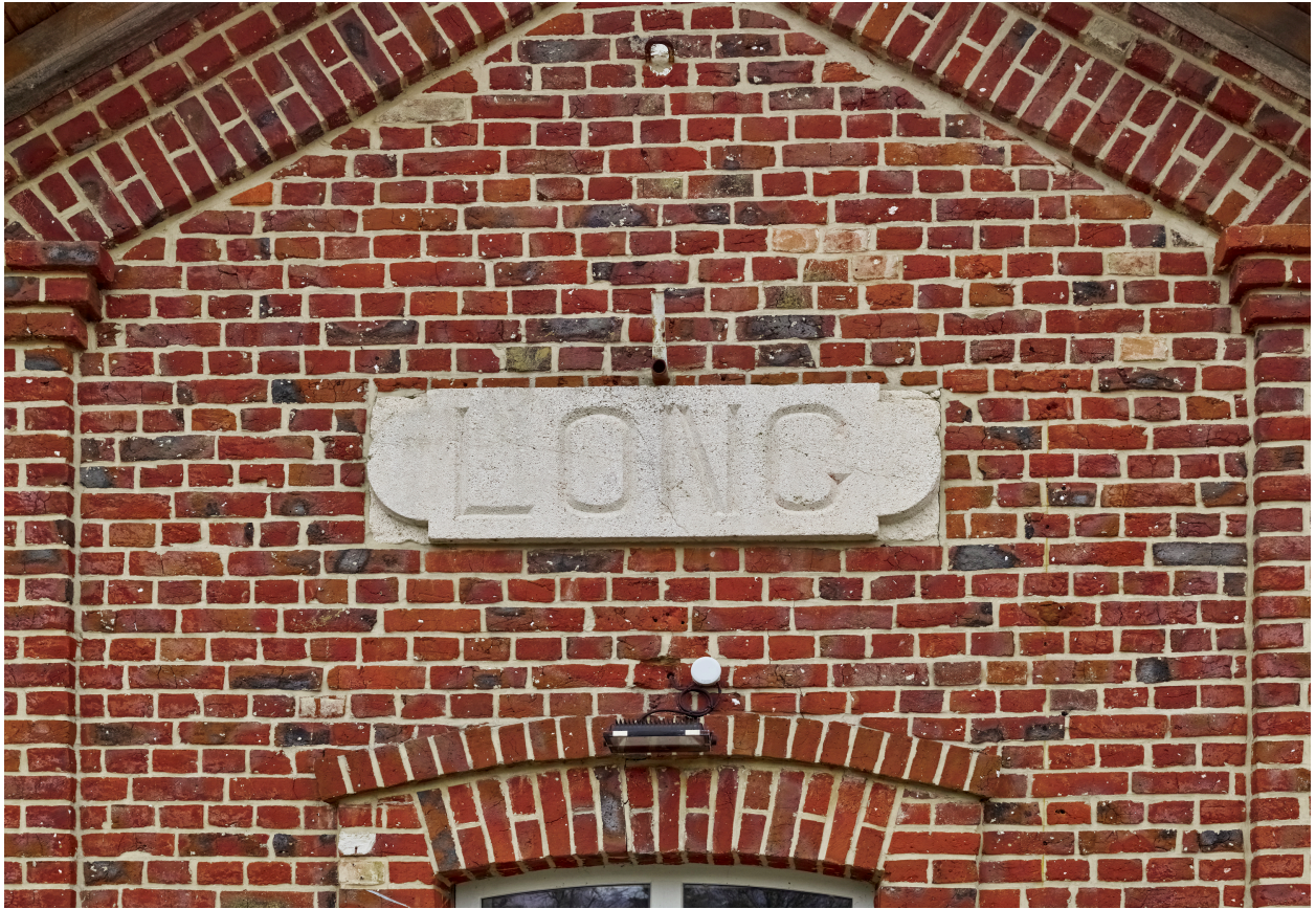
Inscription "LONG" sur la maison éclusière.