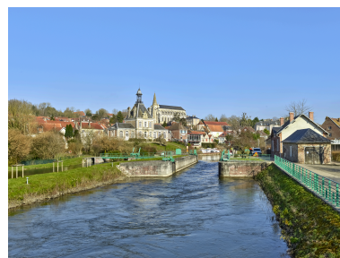
Vue de l'écluse, depuis l'ouest.