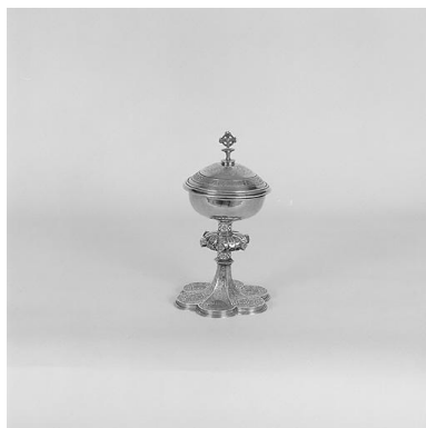
Vue générale. IVR31_19976200079X