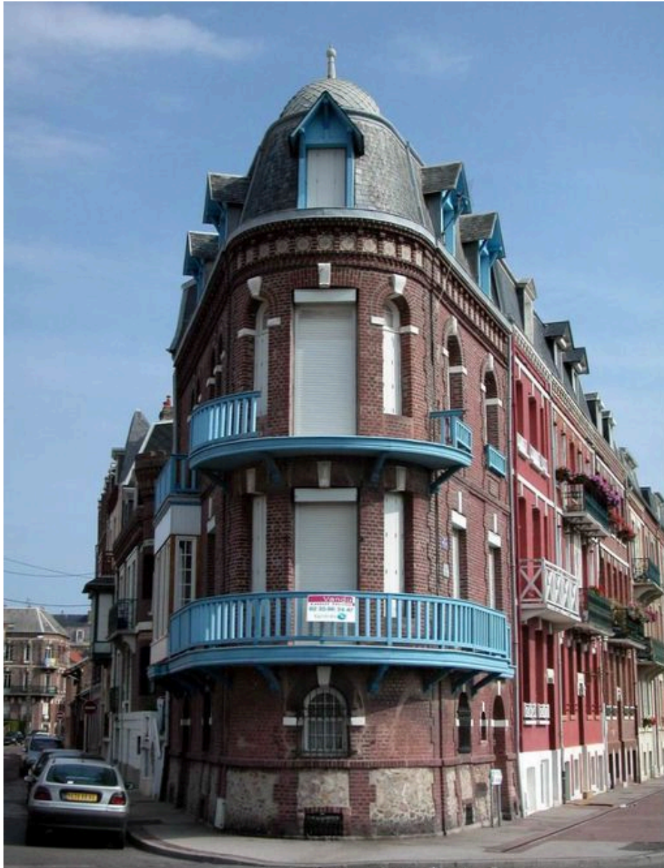
Vue d'ensemble sur l'angle.