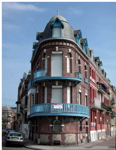
Vue d'ensemble sur l'angle. IVR22_20038005380NUCA