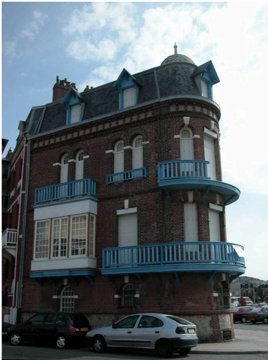
Elévation sur la rue Henri-Leboeuf.