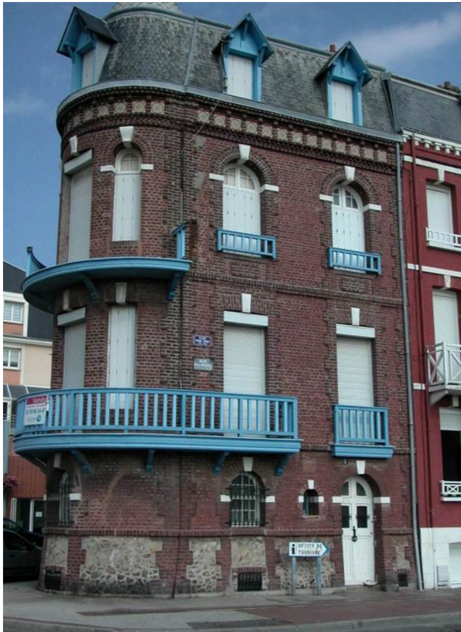
Elévation sur la rue Marcel-Holleville.