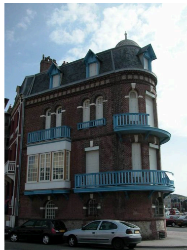
Élévation sur la rue Henri-Leboeuf.