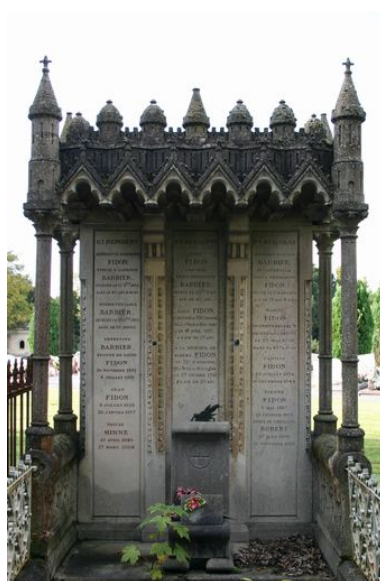
Tombeau-monument.