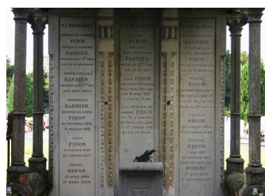
Détail de la partie médiane du tombeau-monument.