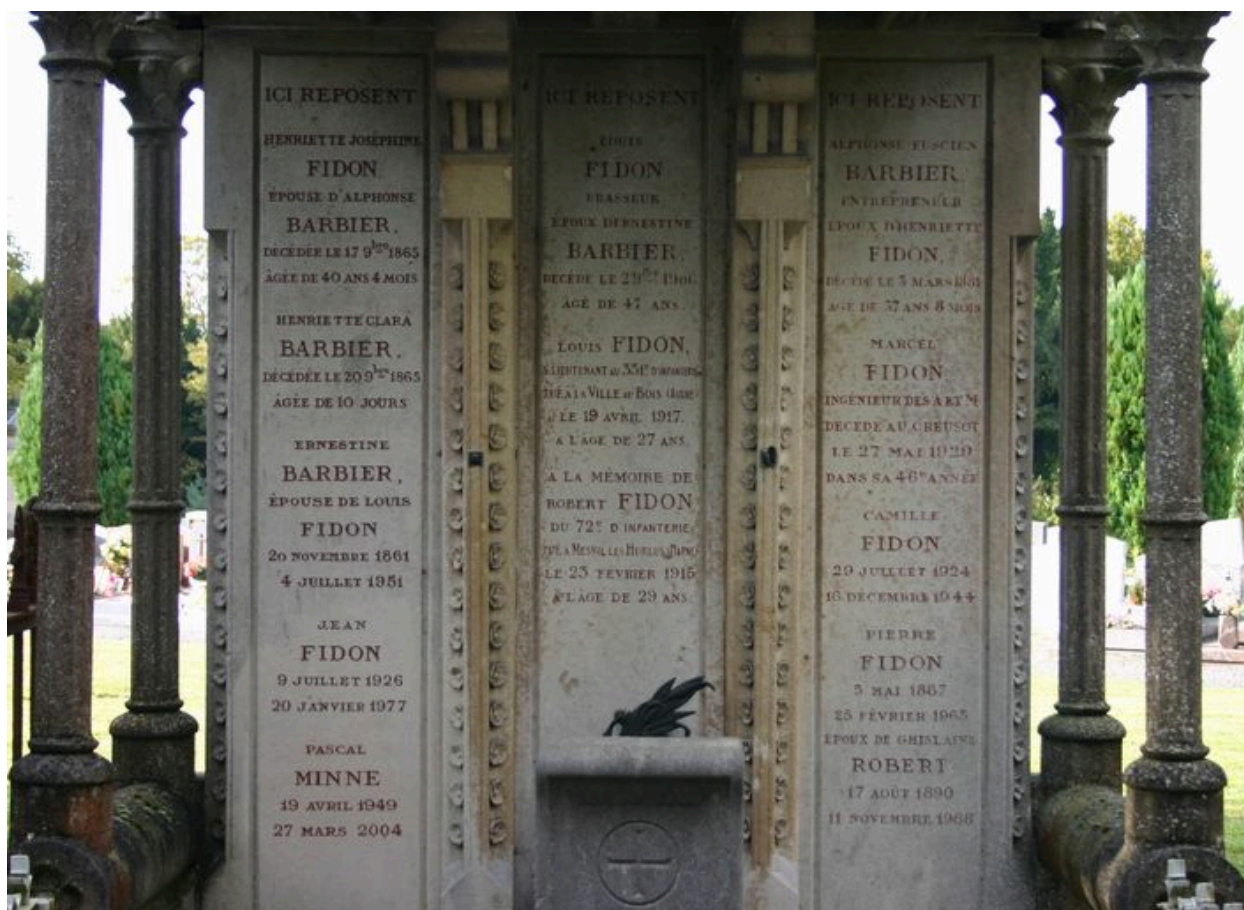
Détail de la partie médiane du tombeau-monument.