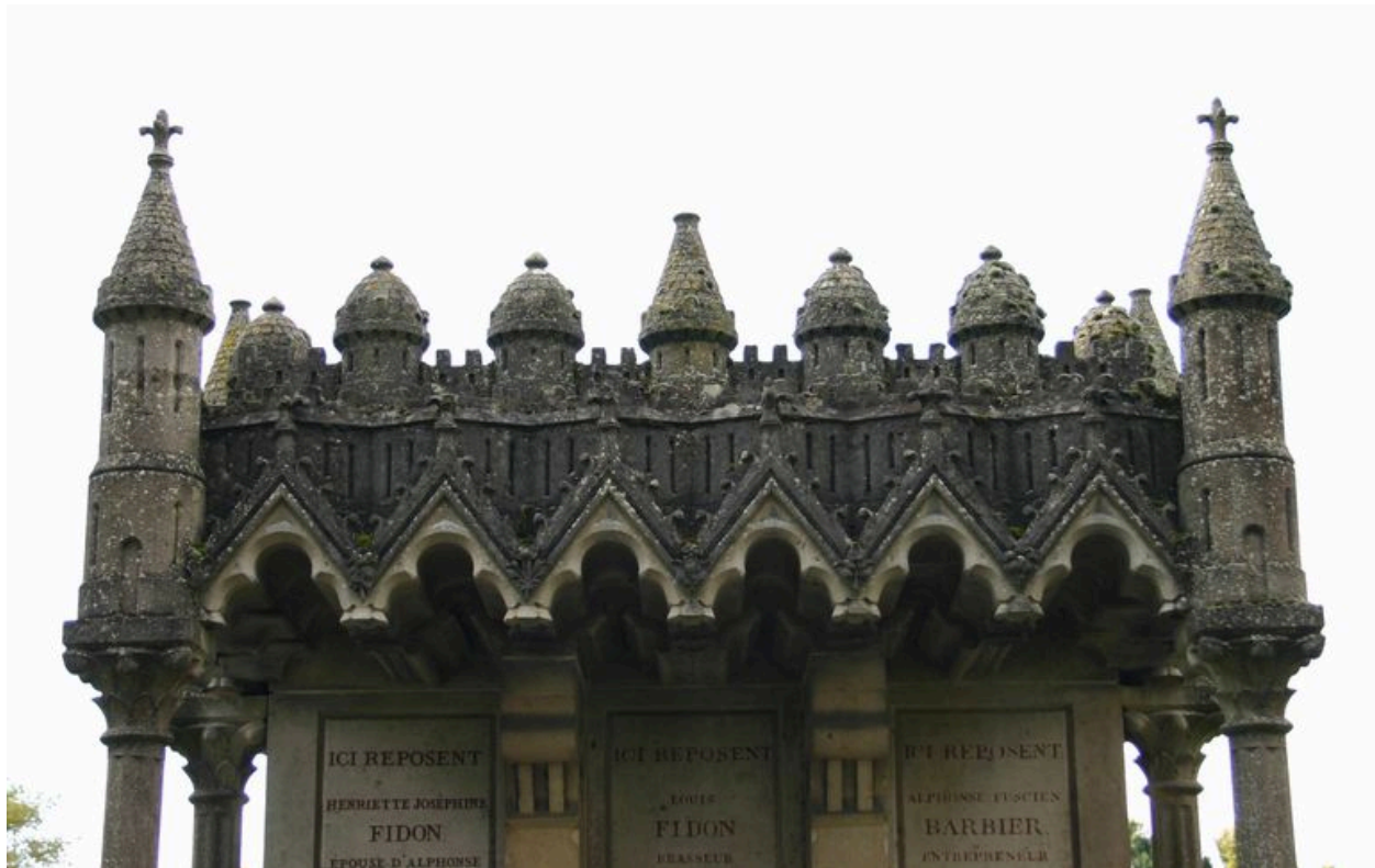
Détail de la partie supérieure du tombeau-monument.