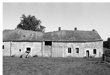
Vue frontale du logis sur la droite et de la grange-étable sur la gauche.

IVR22_19980202723Z