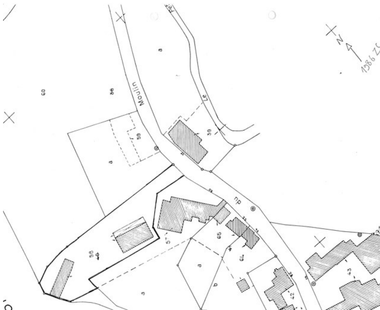
Plan de situation. Extrait du plan cadastral de 1986, section ZC.