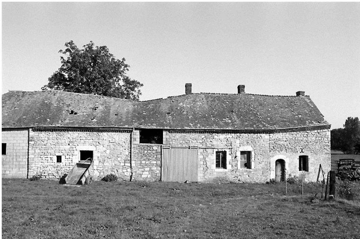
Vue frontale du logis sur la droite et de la grange-étable sur la gauche.