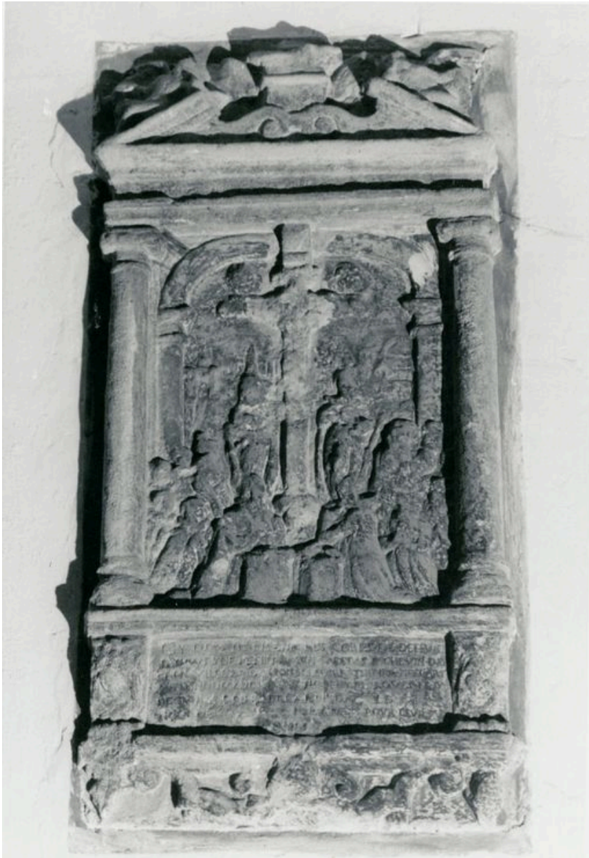
Vue générale (phot. Wintrebert, 1978, fonds AOA62)