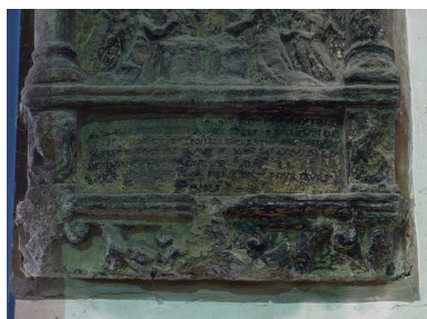
Vue de détail, inscription