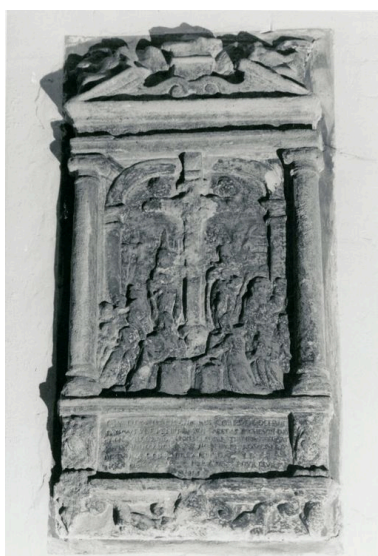
Vue générale IVR31_20106201998NUC