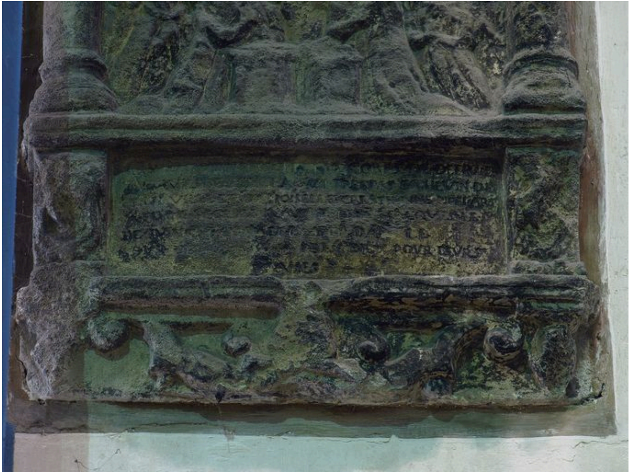
Vue de détail, inscription