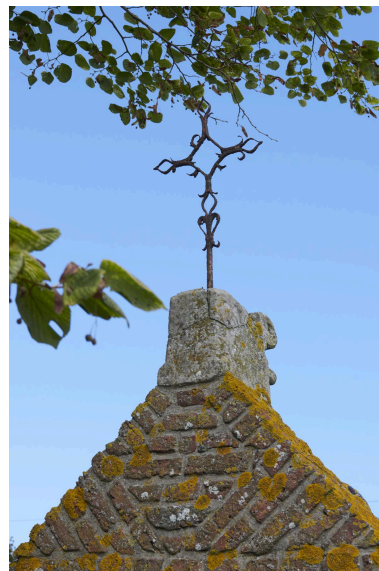
Détail de la croix latine en fer forgé.