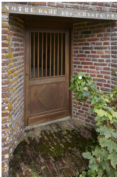
Détail de l'entrée et de la porte. IVR32_20245902989NUCA