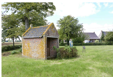
Vue générale. Pignons en wambergue. IVR32_20245902990NUCA