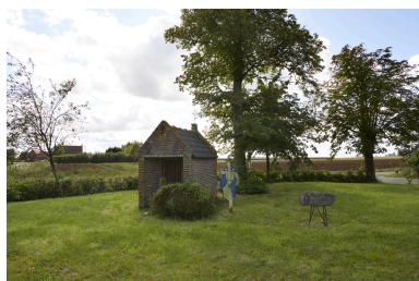
Vue générale de la chapelle dans son environnement direct. IVR32_20245902994NUCA