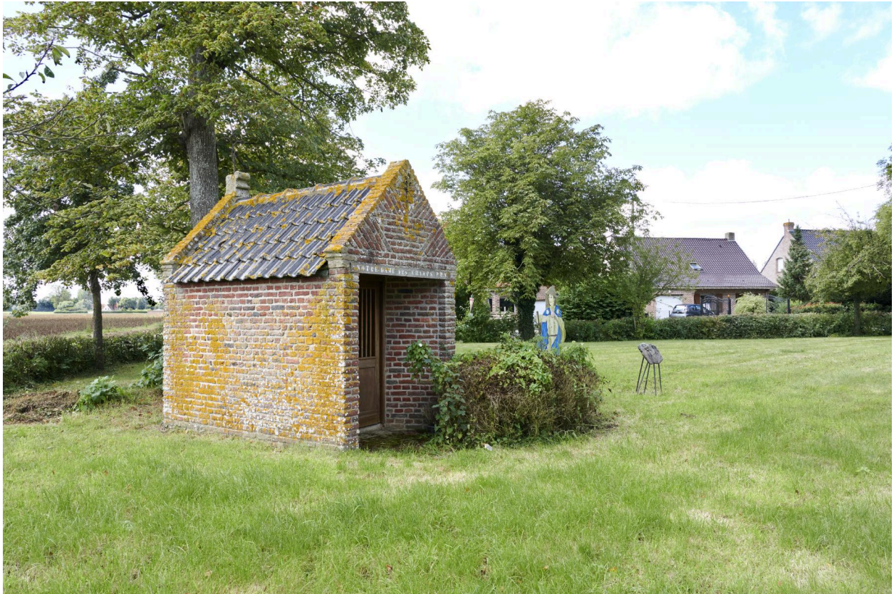
Vue générale. Pignons en wambergue.