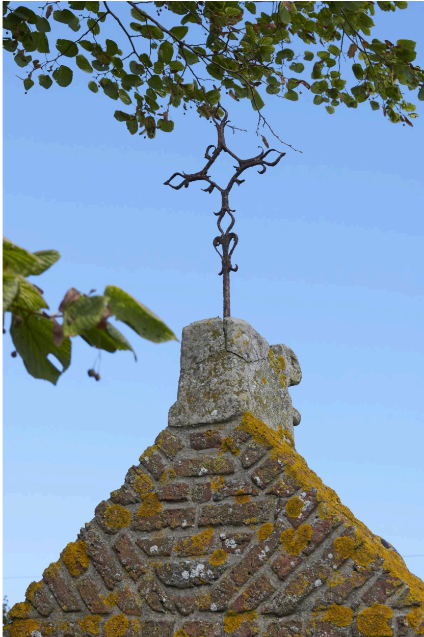
Détail de la croix latine en fer forgé.