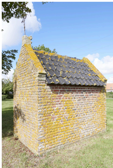
Vue arrière. IVR32_20245902992NUCA