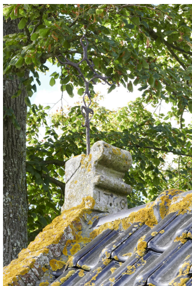
Détail de la date portée "1760" sur la pierre sommitale du pignon.