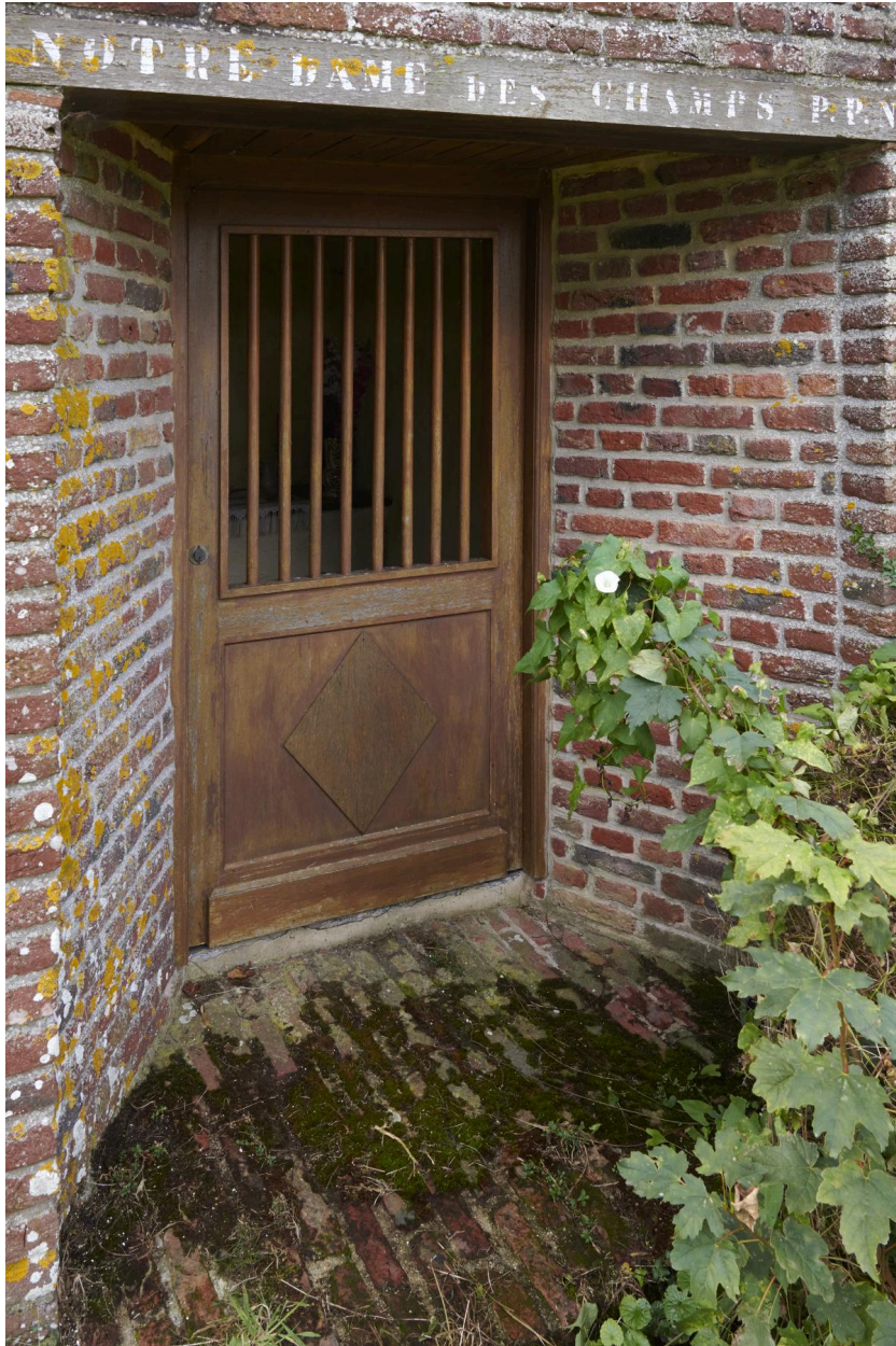
Détail de l'entrée et de la porte.