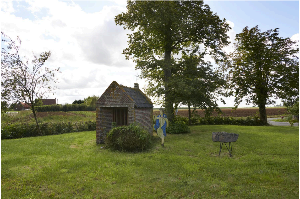
Vue générale de la chapelle dans son environnement direct.