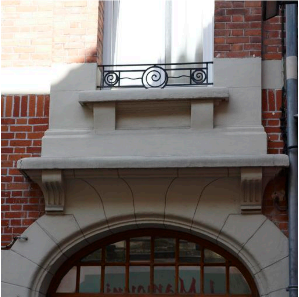
Détail d'un garde-corps constitué de motifs à spirales et de vagues.