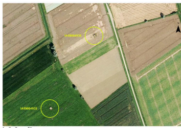
Position de l'édifice (cercle du bas) sur une photographie de 2014