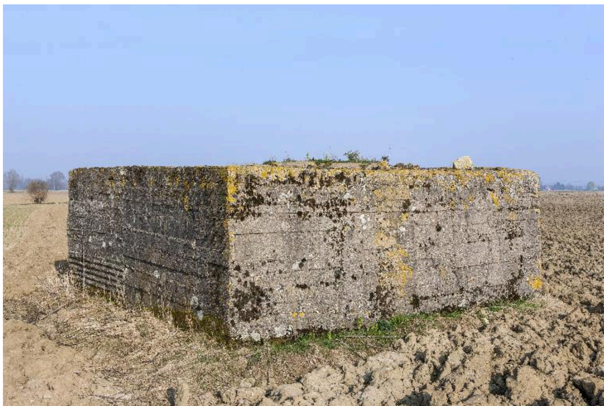
Vue vers le sud