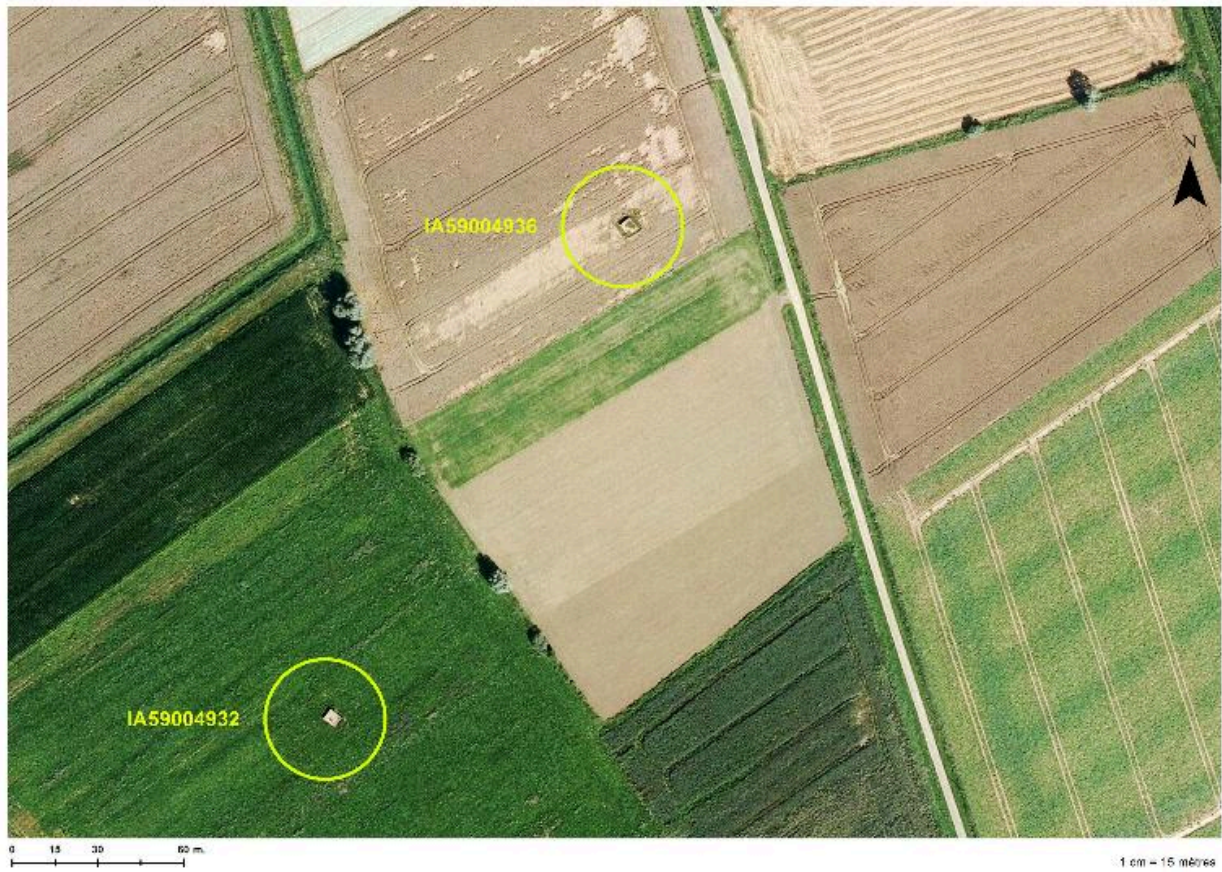
Position de l'édifice (cercle du bas) sur une photographie de 2014