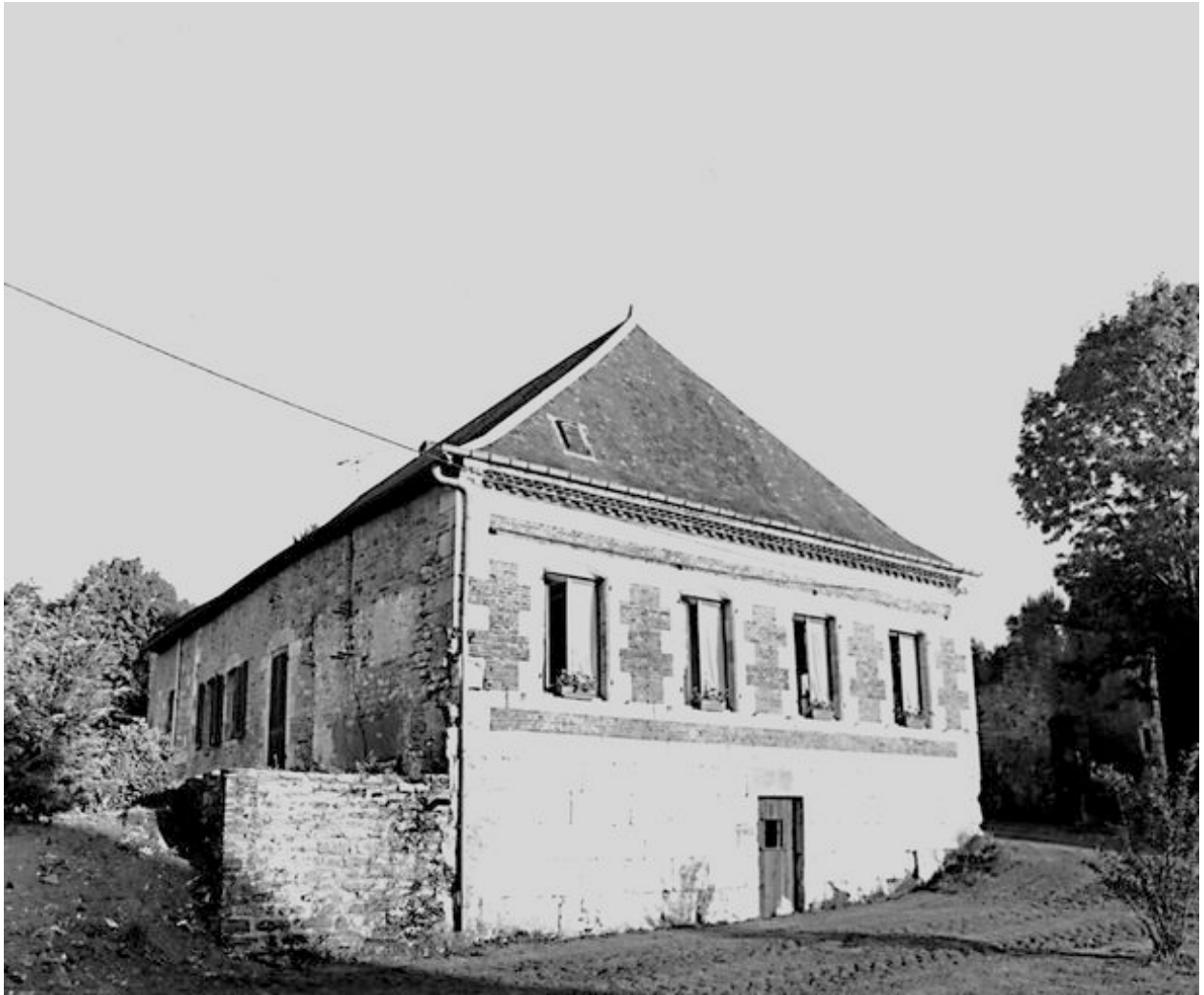
Élévation ouest et postérieure du logis.