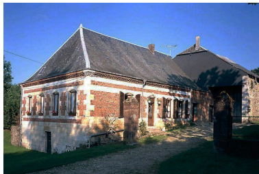
Vue générale du logis.