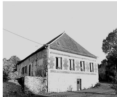
Élévation ouest et postérieure du logis. IVR22_19980202710Z