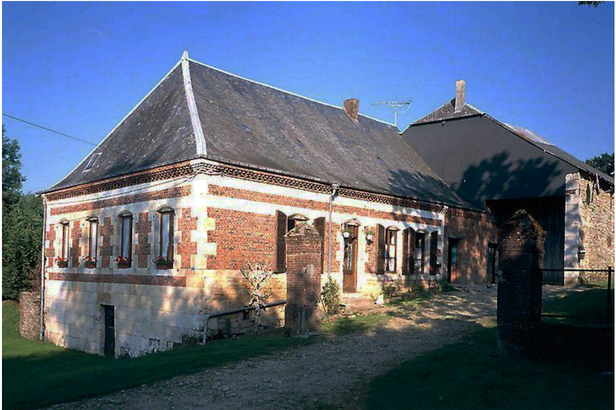
Vue générale du logis.