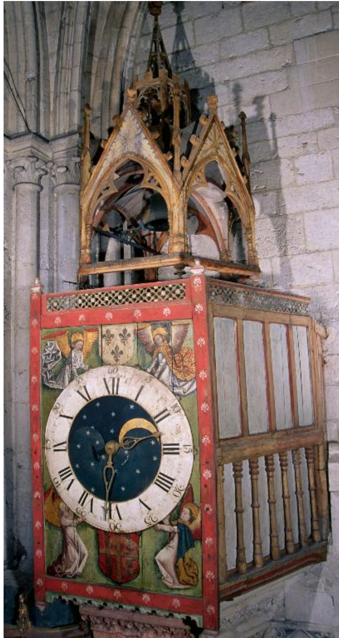
Vue de l'horloge.