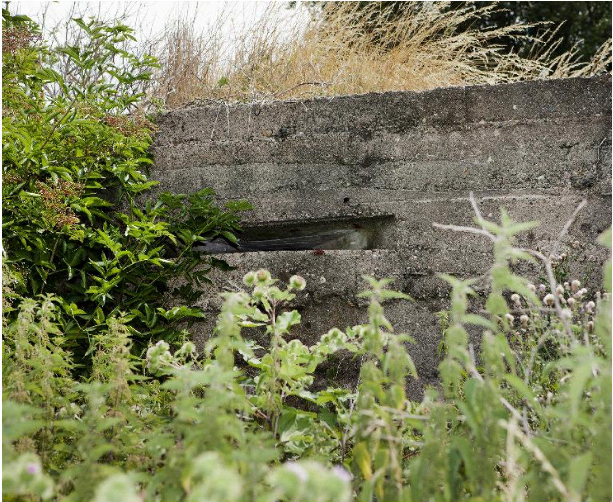
Embrasure de tir, élévation ouest