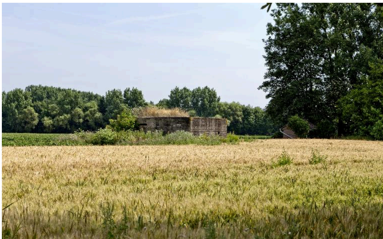
Vue de trois-quarts, vers le nord-est