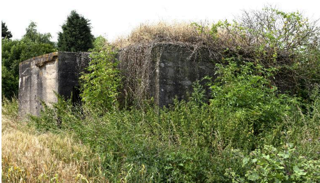
Vue de trois-quarts, vers le sud-ouest.