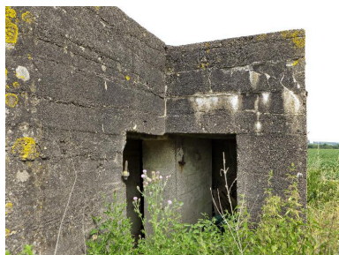
Entrées, sud IVR31_20145904475NUCA