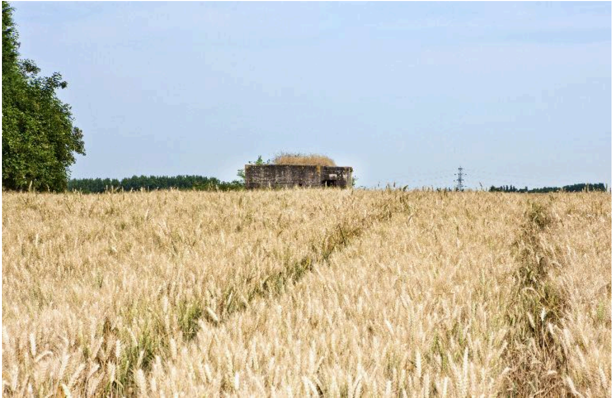
Vue générale, vers le nord