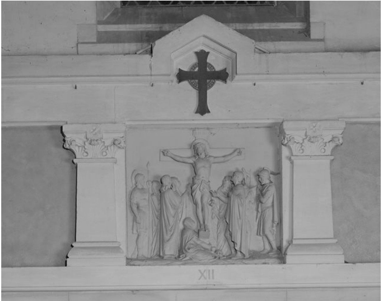
Station du chemin de croix.