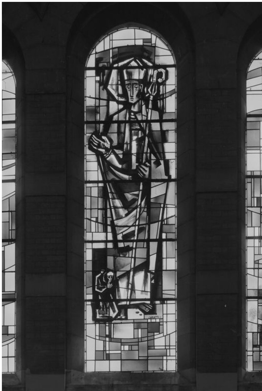
Verrière représentant saint Joseph, par J. Archepel, 1955.