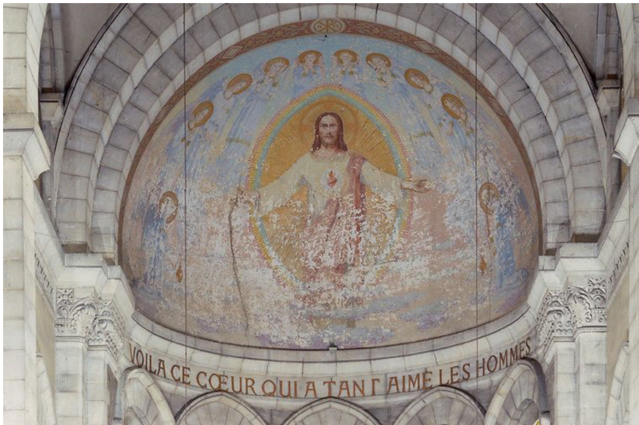
Le décor peint de l'abside, G. Riquet.