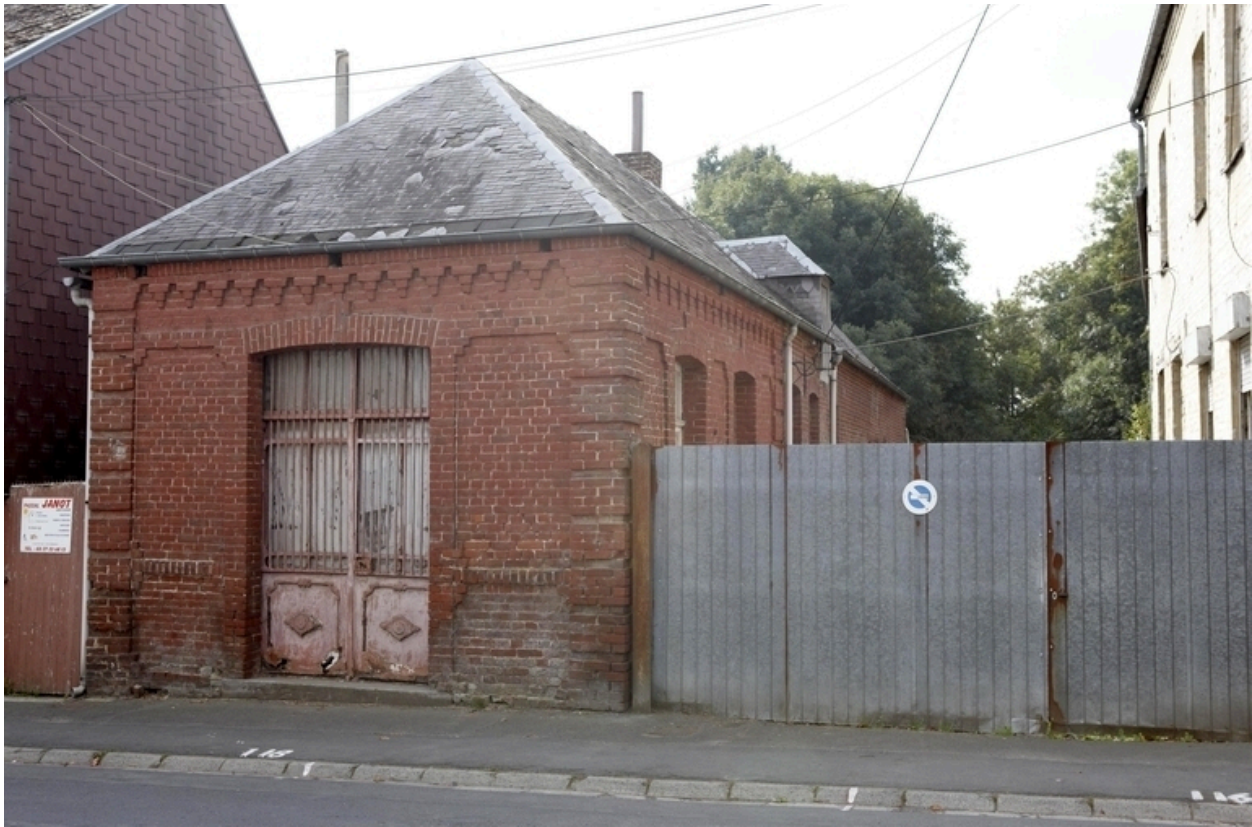
Vue de la boucherie.