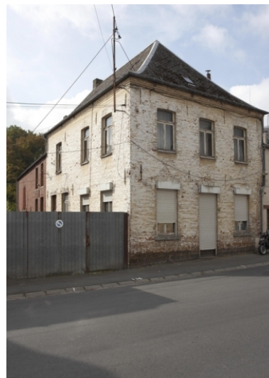
Vue de l'habitation et des étables. IVR31_20095903285NUCA