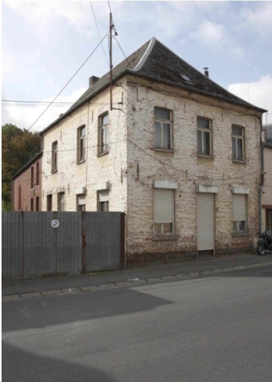
Vue de l'habitation et des étables.