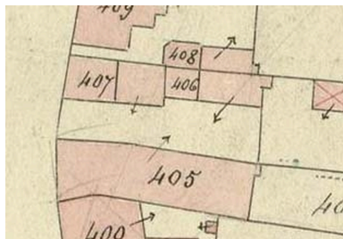
Extrait de la feuille cadastrale B2. Plan de situation en 1897. IVR31_20095902600NUCA