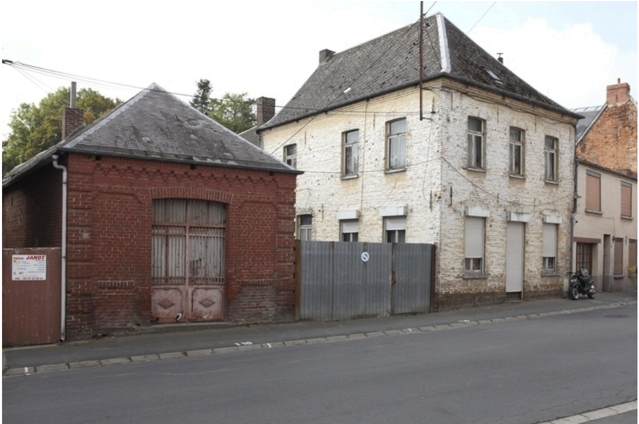
Vue générale de la boucherie et de l'habitation, depuis la rue.