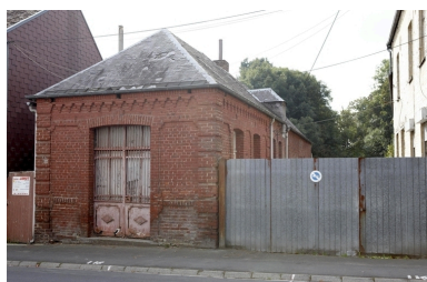
Vue de la boucherie. IVR31_20095903286NUCA