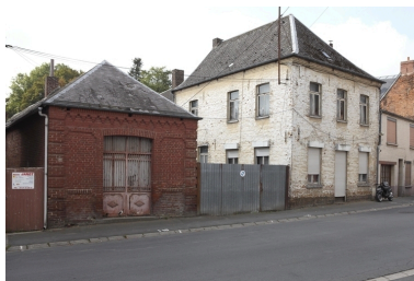
Vue générale de la boucherie et de l'habitation, depuis la rue.