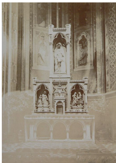
Vue d'une photographie de l'autel Sainte-Anne, antérieure à 1914. IVR22_20110201014NUCA