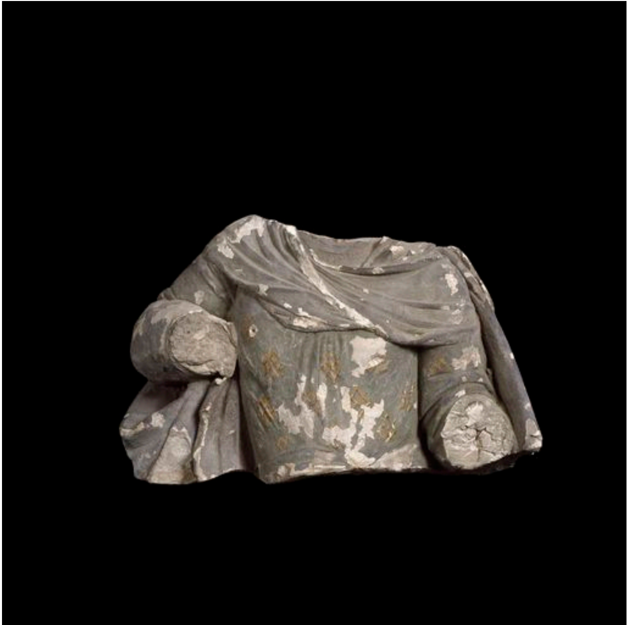
Vue générale du torse de sainte Anne.