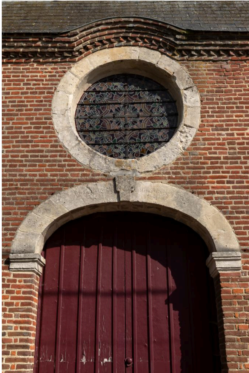
Détail du portail occidental avec inscription en latin et date "1742" sur l'arc au-dessus de la porte.