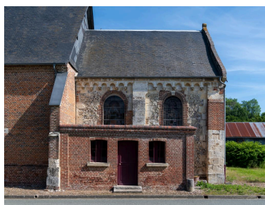
Vue sud du chœur et de la sacristie. IVR32_20216000566NUCA