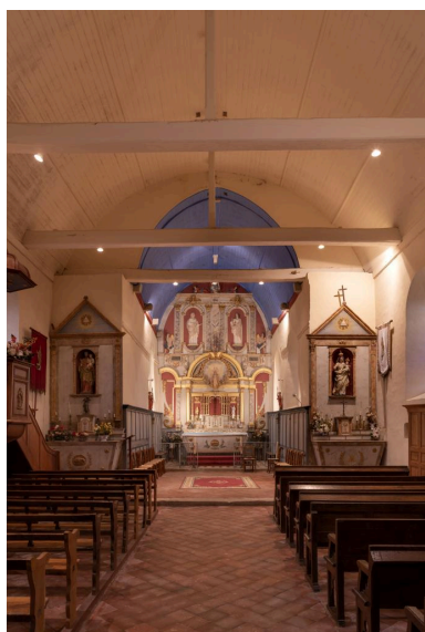
Vue intérieure vers le chœur. IVR32_20216000502NUCA