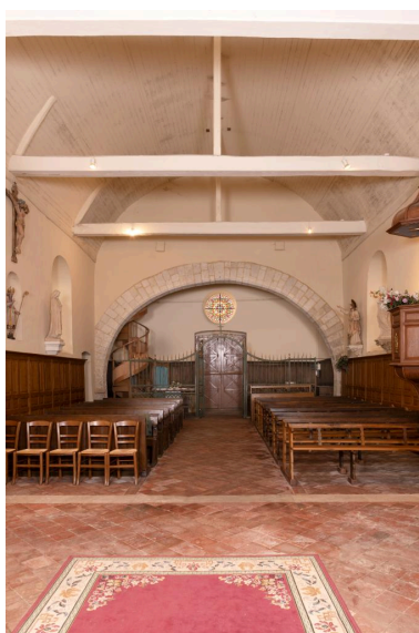
Vue intérieure vers la nef. IVR32_20216000503NUCA