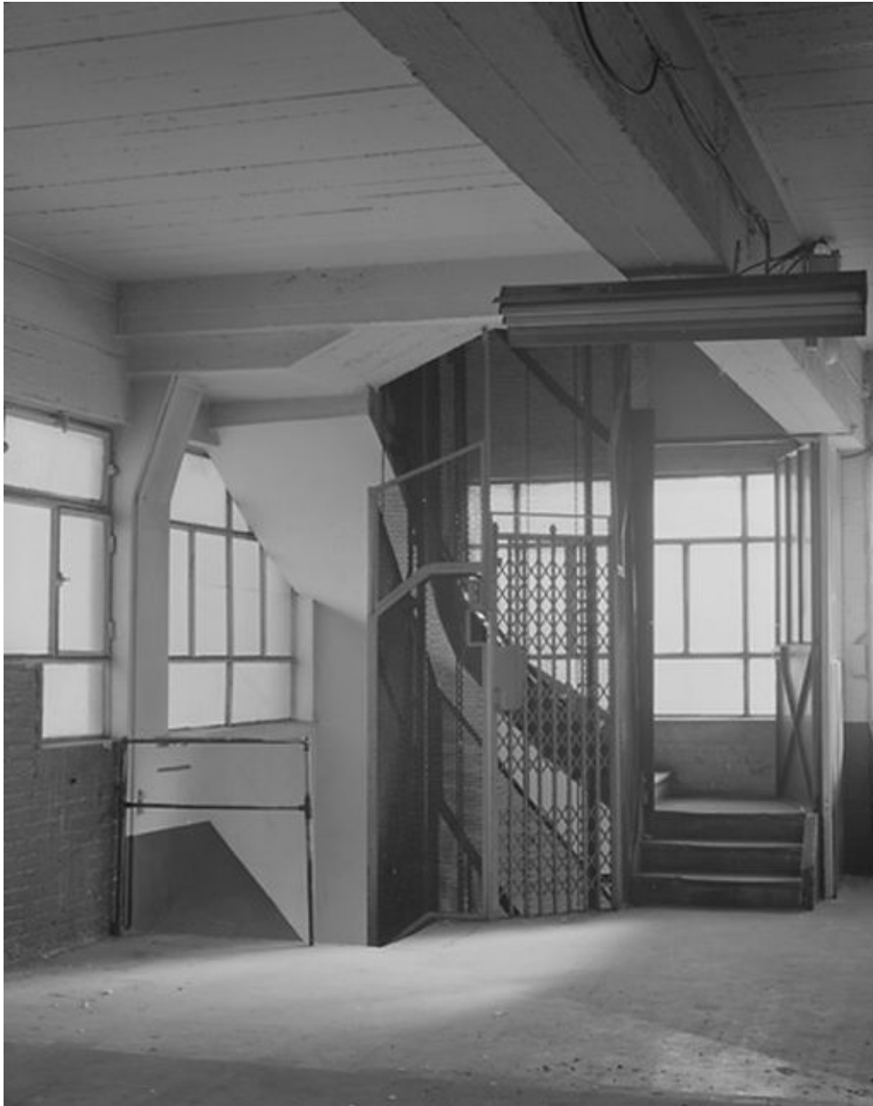
Vue d'ensemble de la cage d'ascenseur.