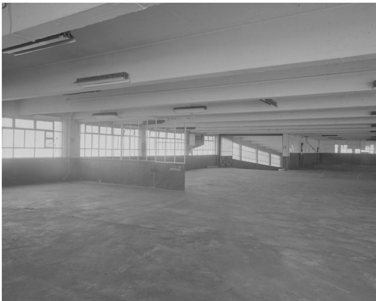
Vue d'ensemble du niveau 3.