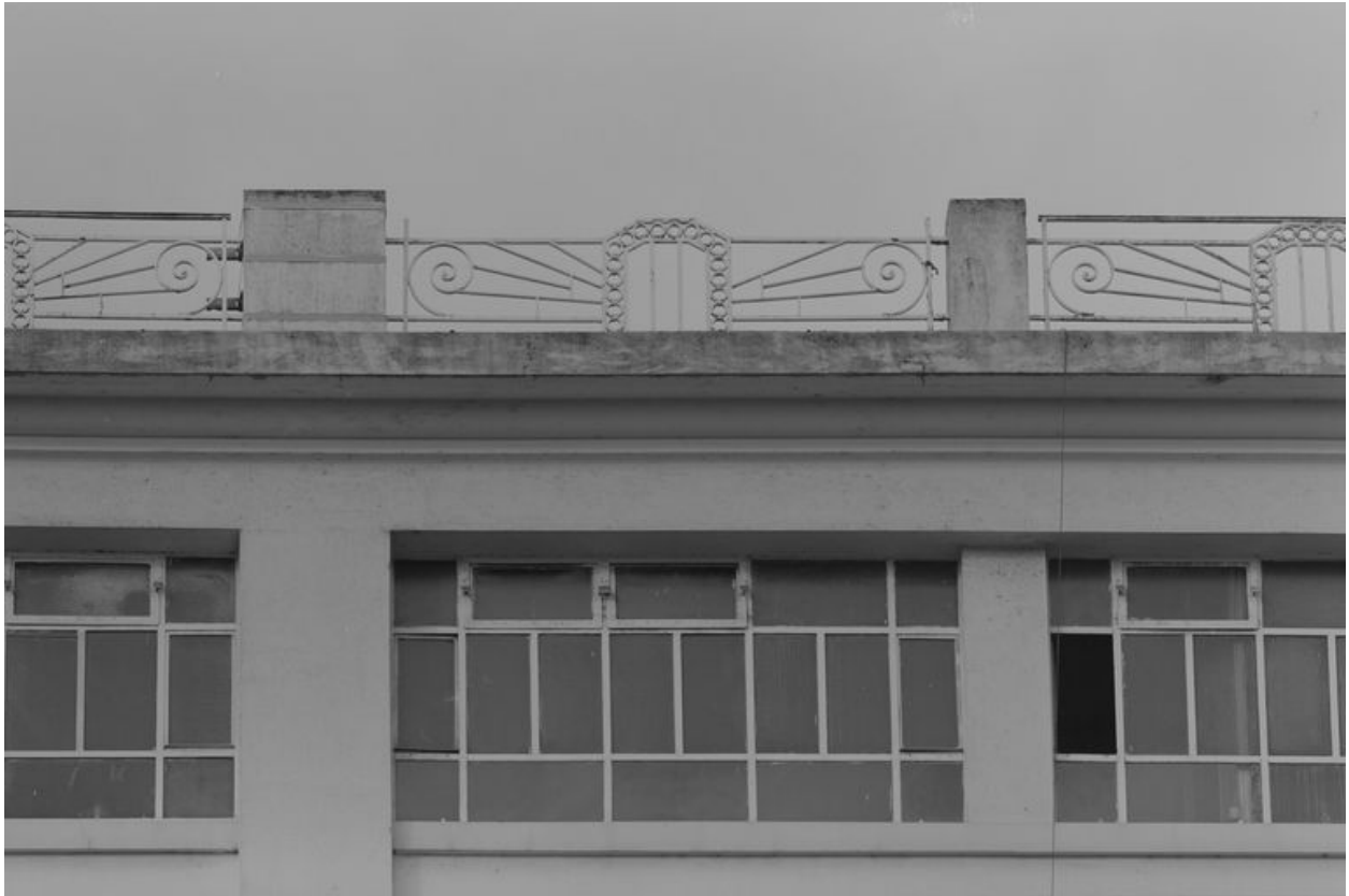
Détail de la balustrade bordant la terrasse.