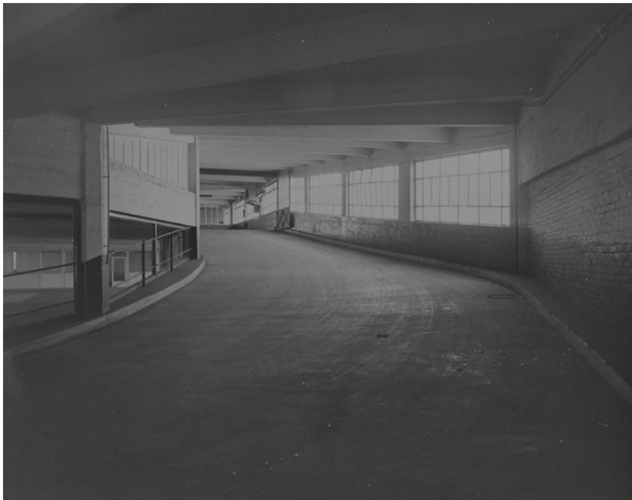
Vue d'ensemble de la rampe d'accès entre le niveau 2 et le niveau 3.