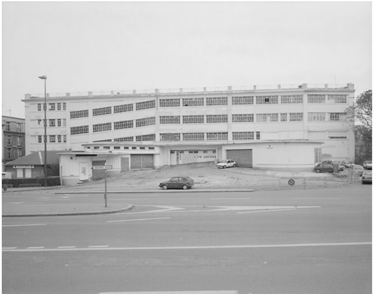
Vue générale depuis l'ouest.