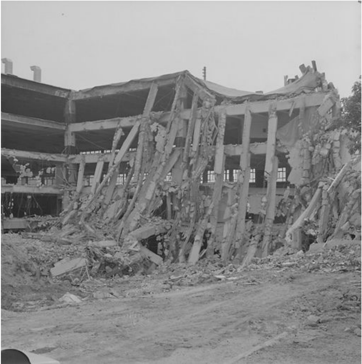
Vue d'ensemble du garage en cours de démolition, le 26 avril 1999.