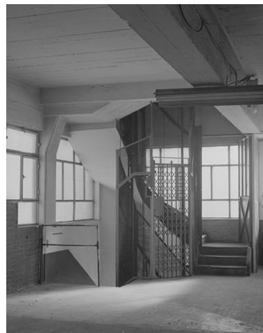
Vue d'ensemble de la cage d'ascenseur.