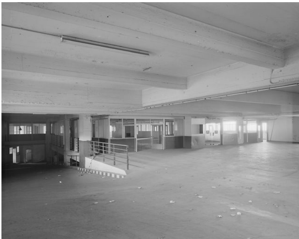
Vue d'ensemble de l'entresol et des bureaux de comptabilité.