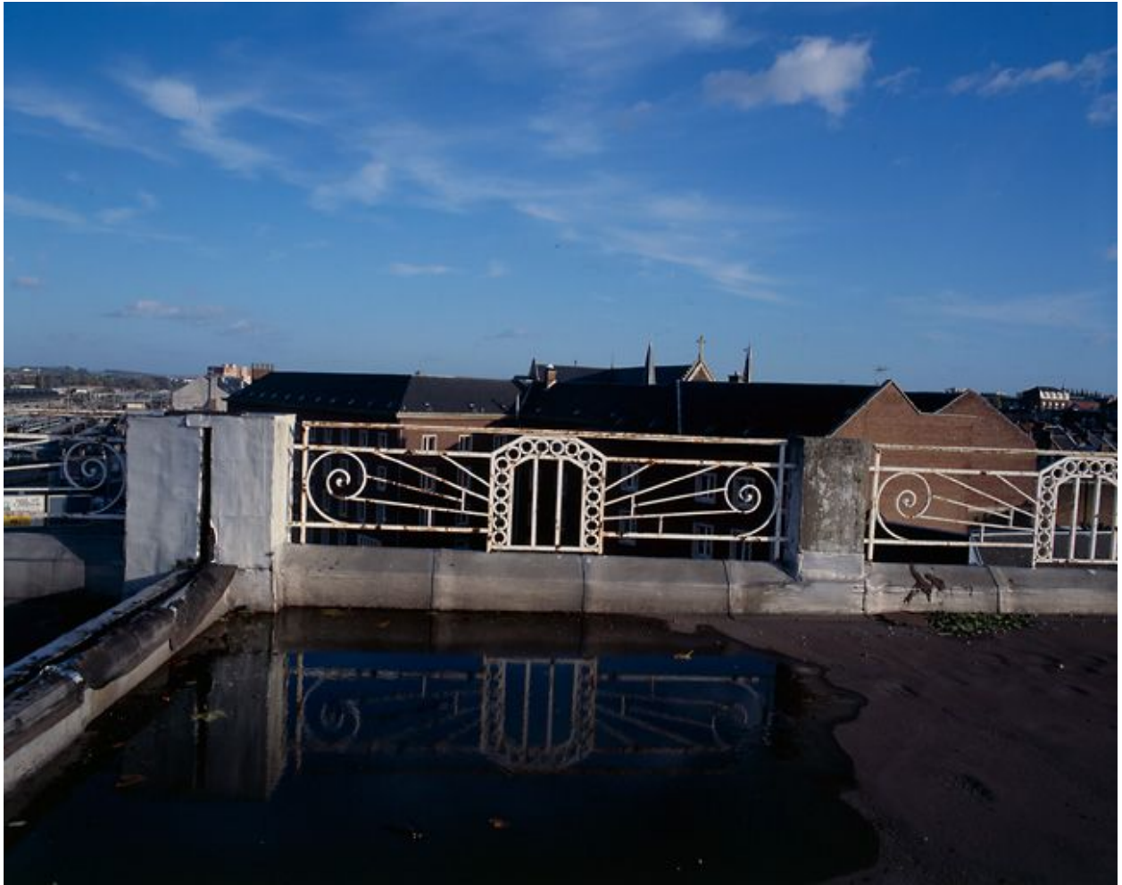
Détail de la balustrade bordant la terrasse.