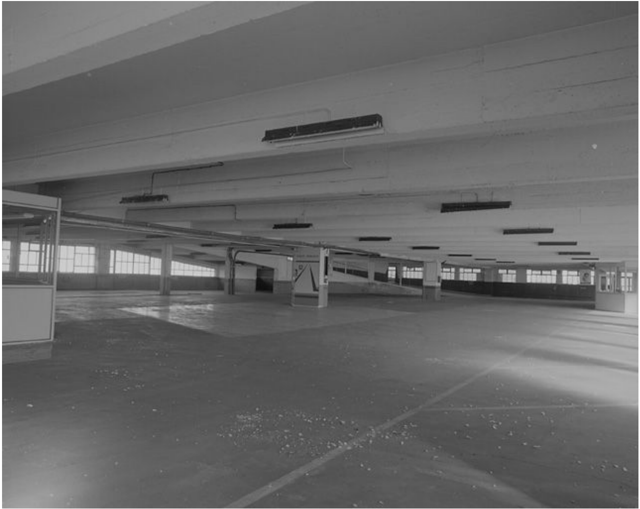
Vue d'ensemble du niveau 1.