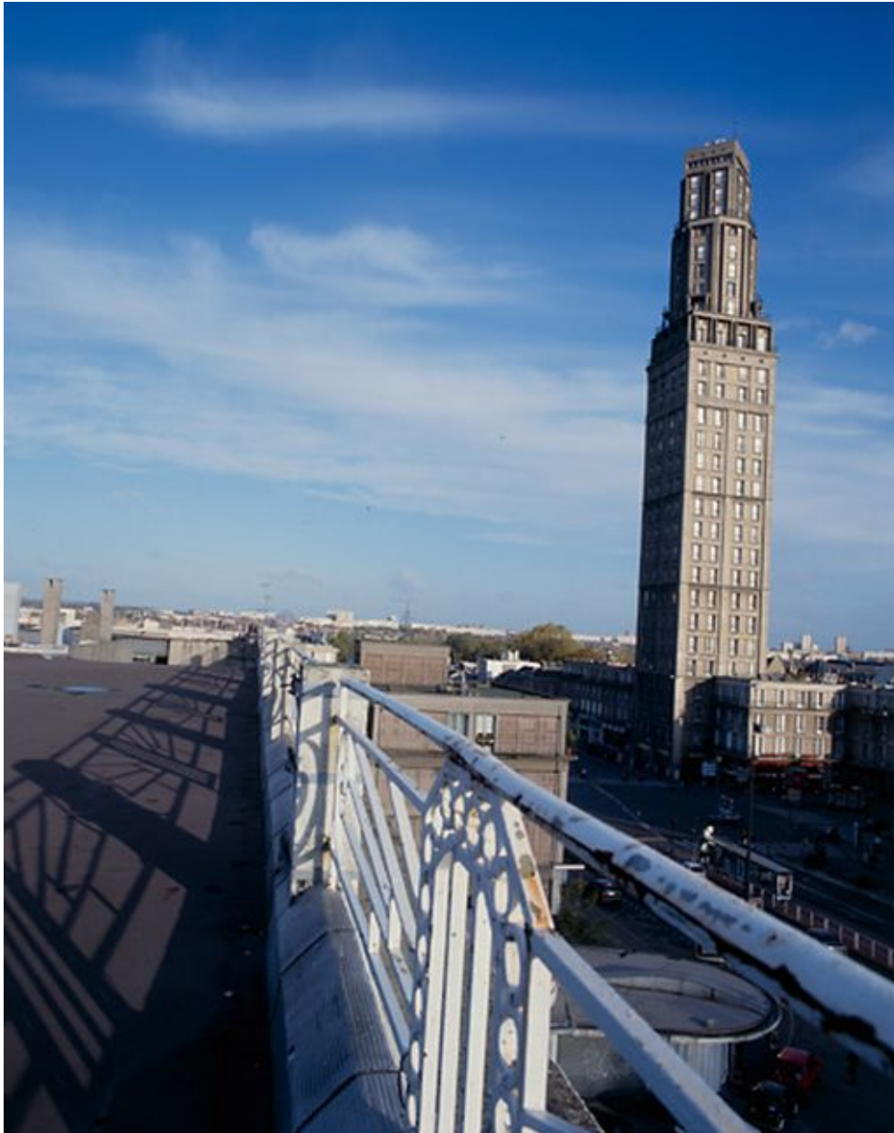
Vue de la tour Perret depuis la terrasse du garage Citroën.