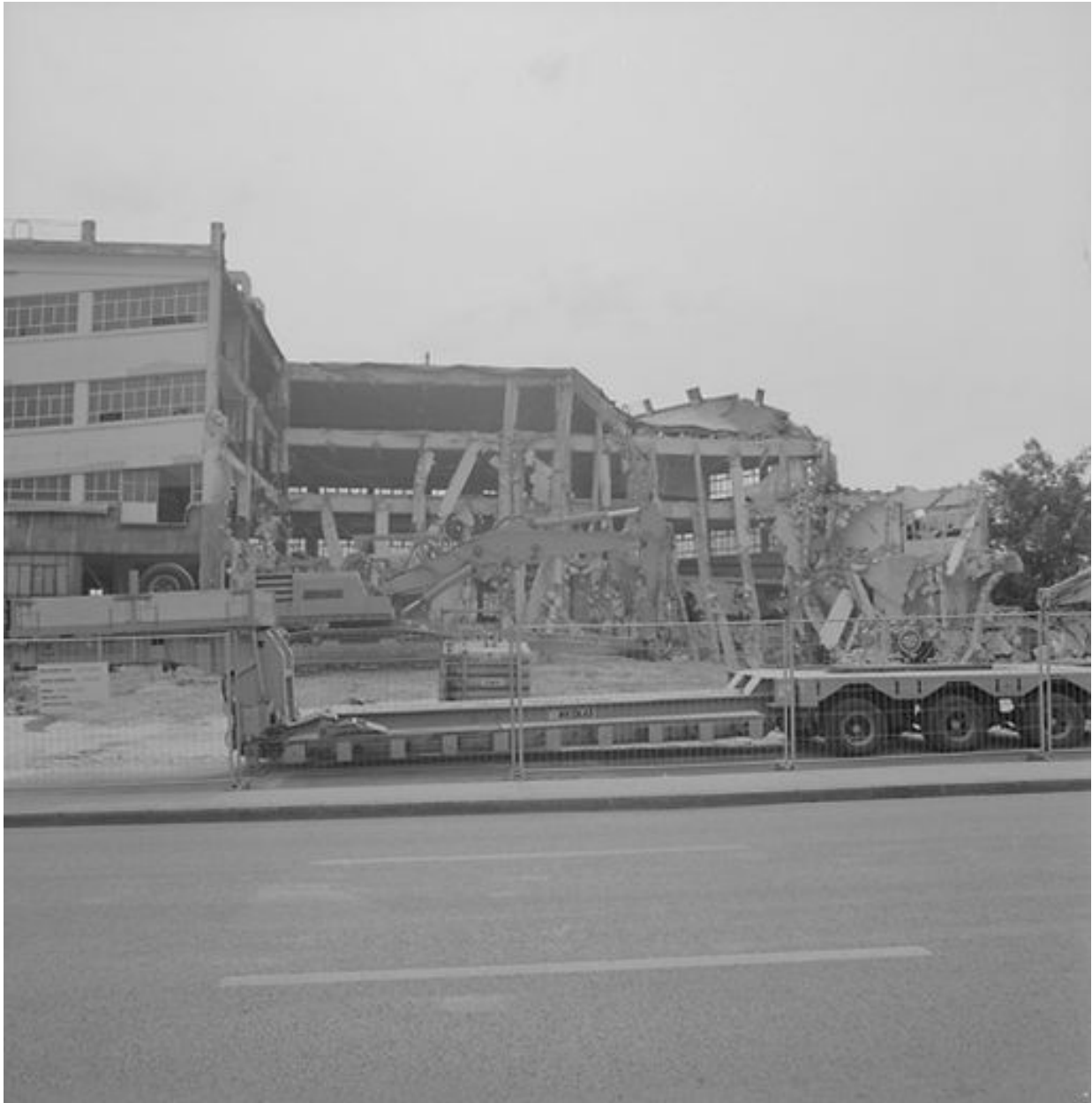
Vue d'ensemble du garage en cours de démolition, le 26 avril 1999.