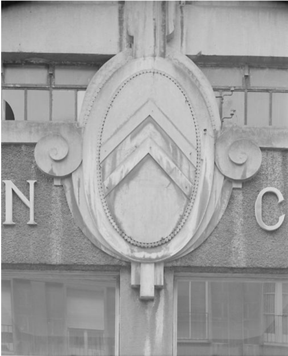
Détail du médaillon portant le sigle Citroën et ornant l'ancienne entrée principale sur la façade.