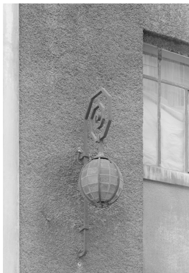
Vue d'un lampadaire style art déco.