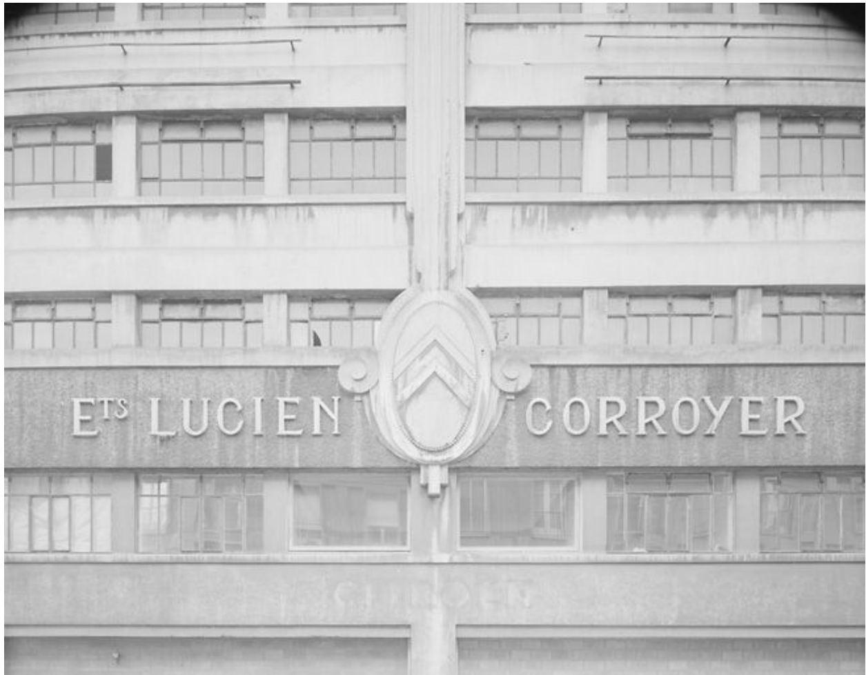
Vue du décor porté ornant l'ancienne entrée principale sur la façade nord.