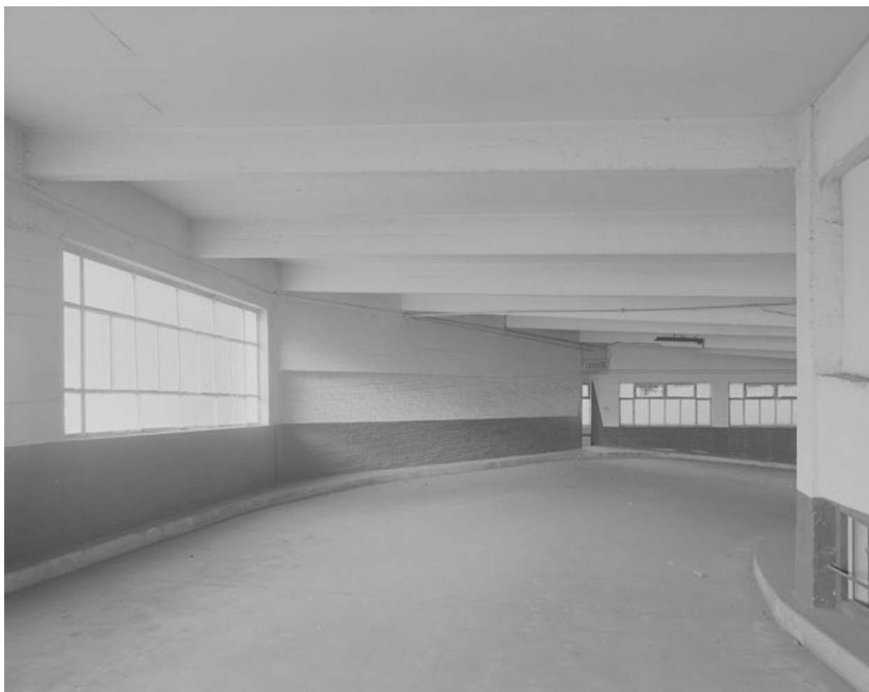
Vue d'une partie de la rampe d'accès entre le niveau 2 et le niveau 3.