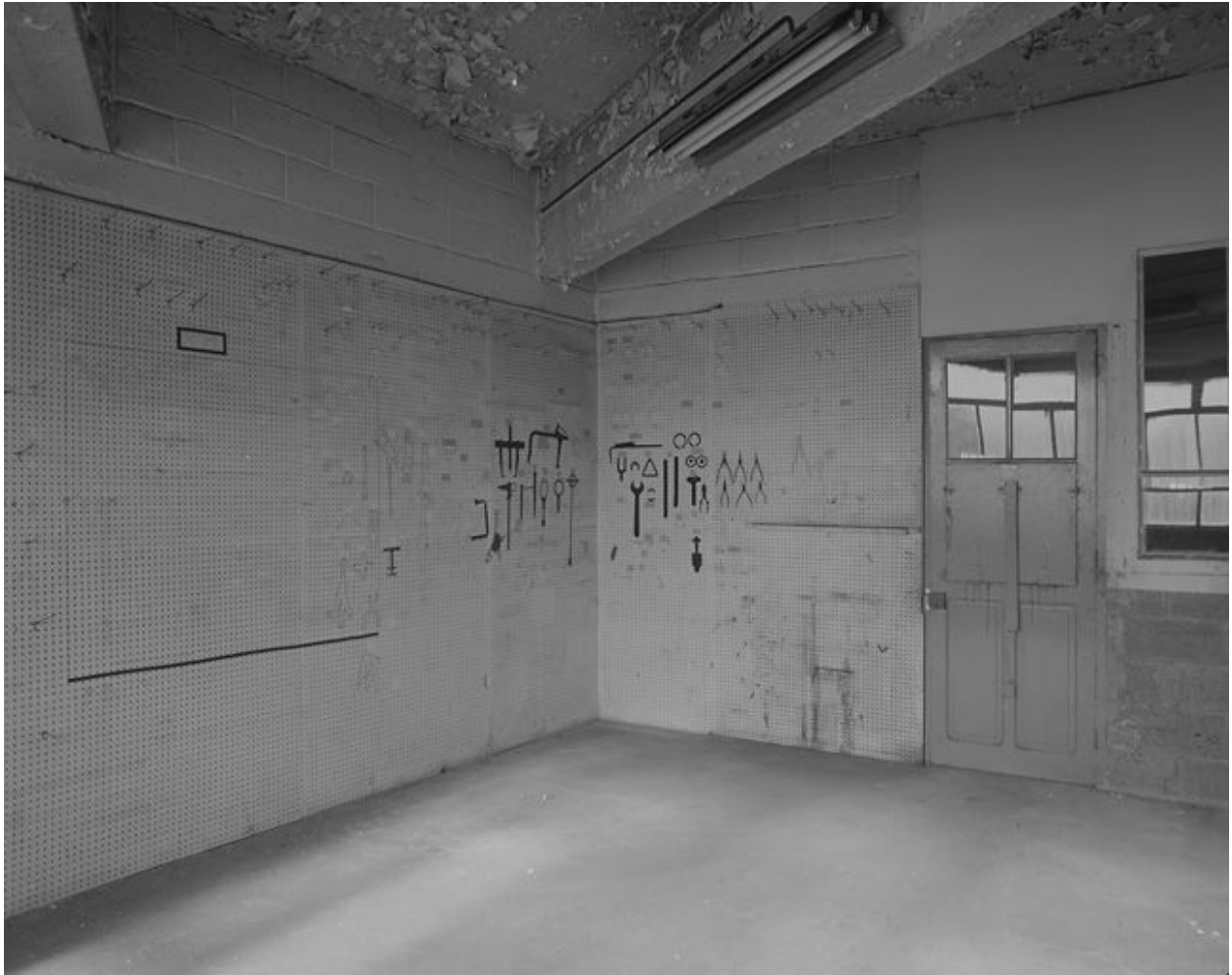
Vue d'ensemble du magasin à outils et pièces détachées.