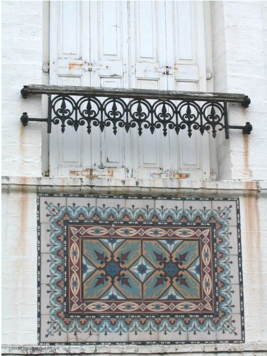
Détail du décor de fonderie et de céramique d'une baie.