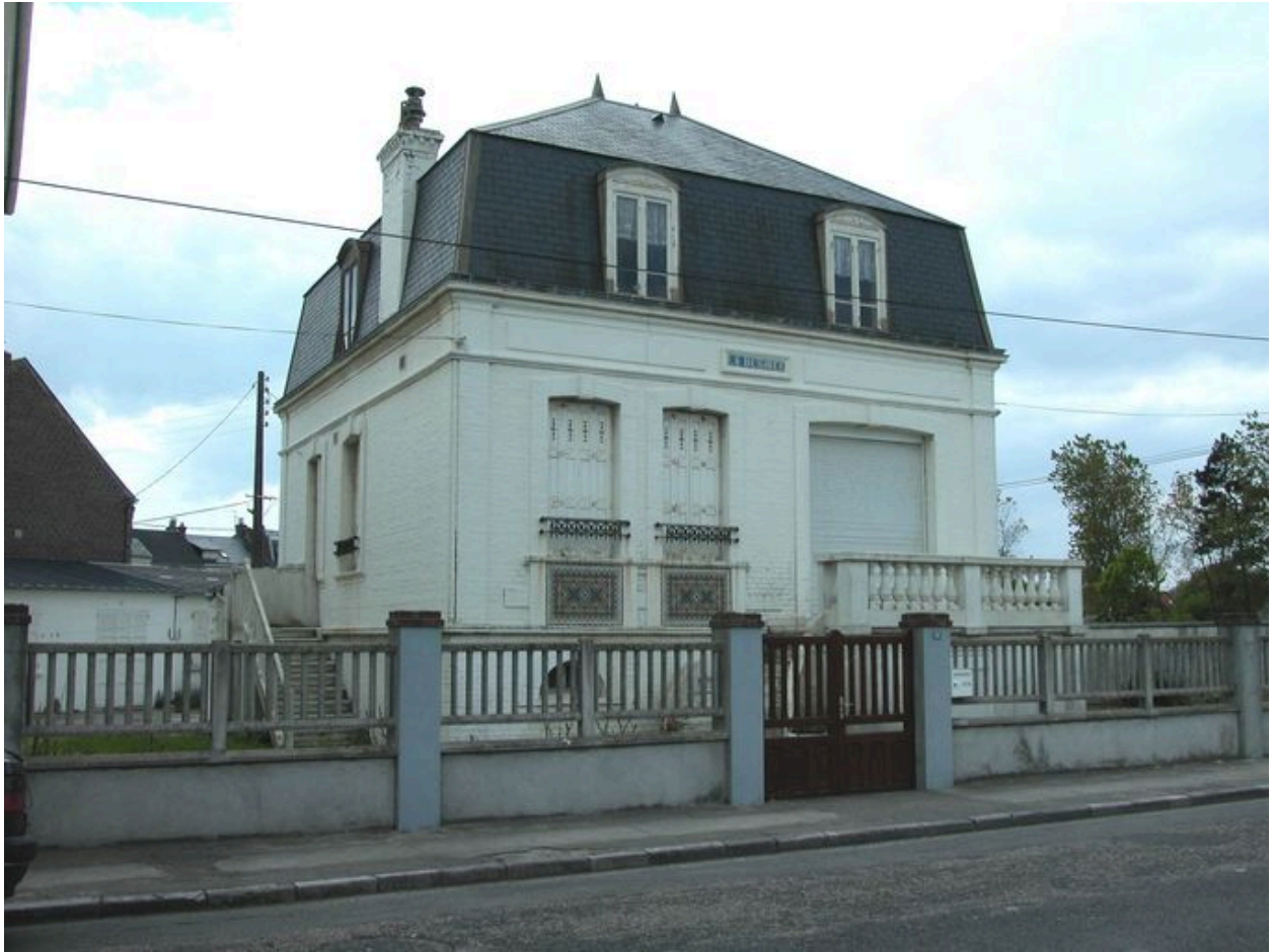
Vue d'ensemble depuis l'avenue Paul-Doumer.