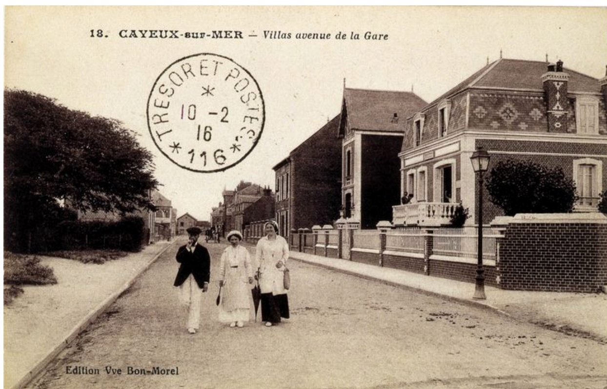
L'actuelle avenue Paul-Doumer et maison dite La Désirée à droite, carte postale, 1er quart 20e siècle.