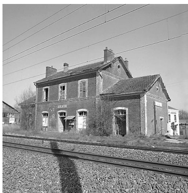
Élévation postérieure depuis la voie.