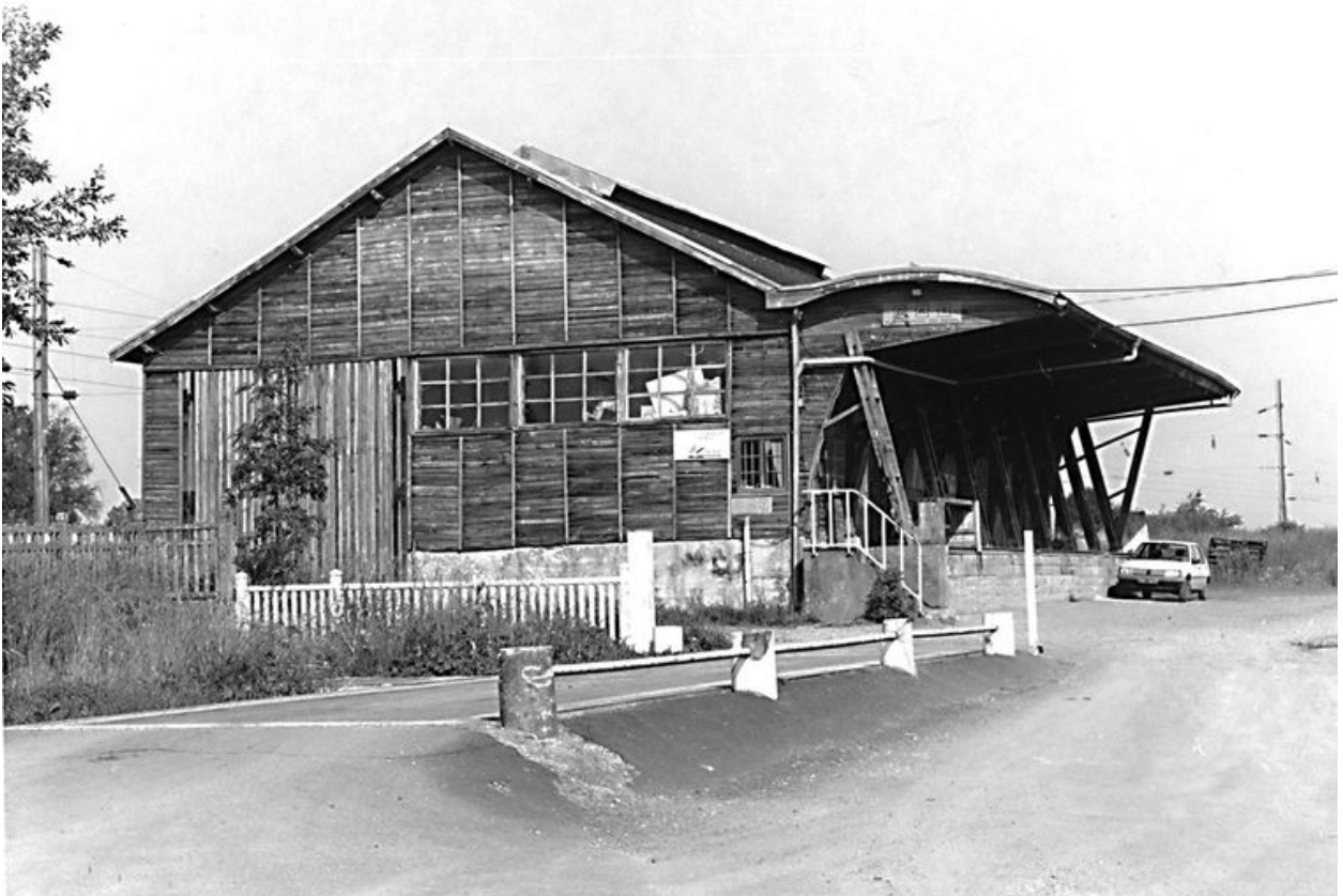
Entrepôt de marchandises.