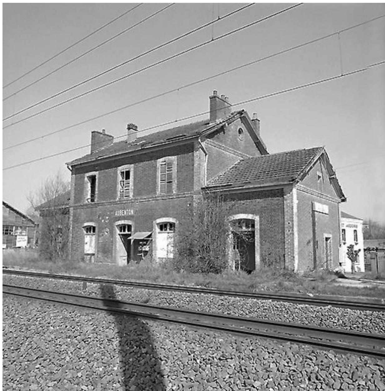
Elévation postérieure depuis la voie.