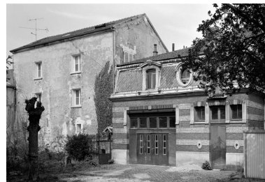
Les garages, anciennes écuries.