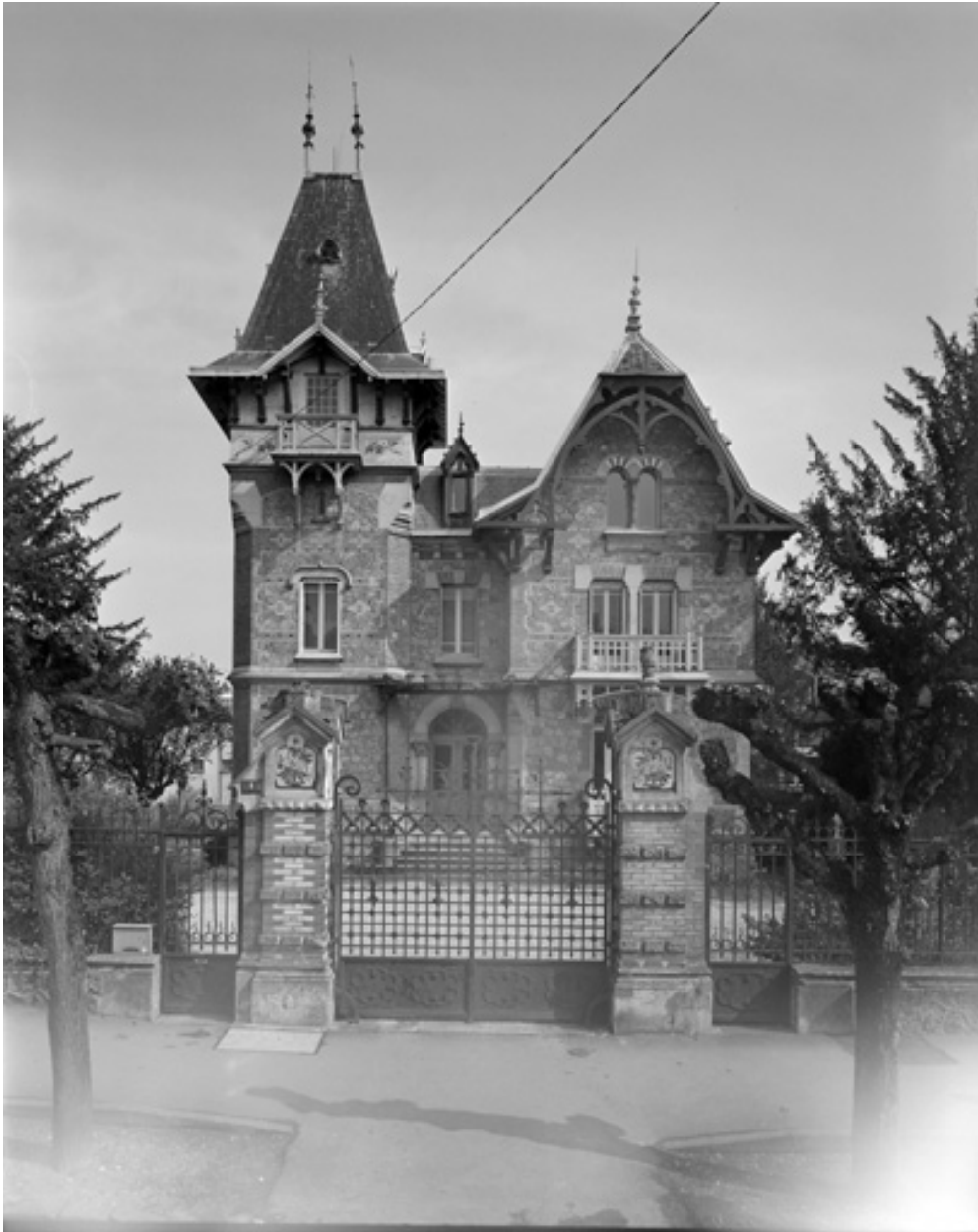
Vue générale depuis la rue.