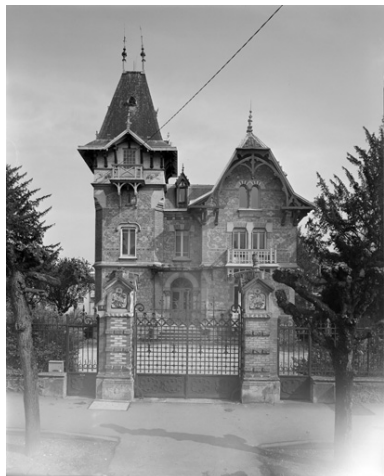
Vue générale depuis la rue. IVR22_19940200316V