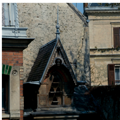
Le pigeonnier.