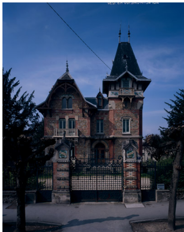
Vue rapprochée de la façade principale. IVR22_19940200339VA