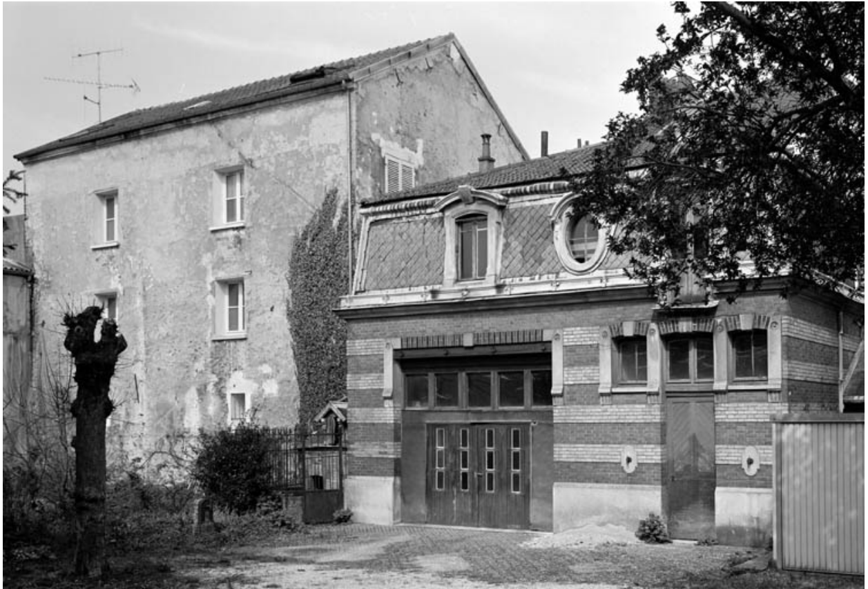
Les garages, anciennes écuries.