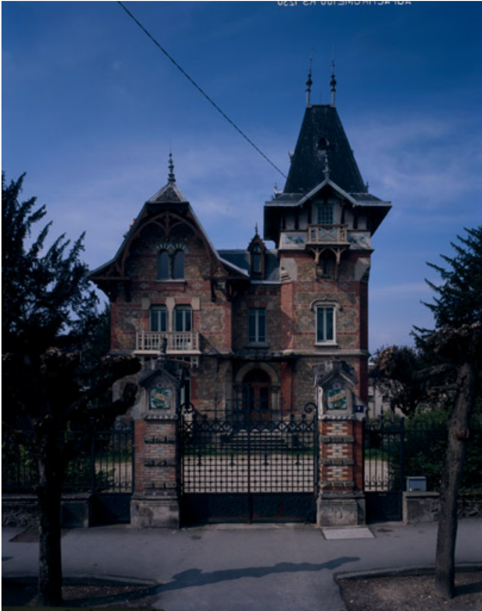
Vue rapprochée de la façade principale.