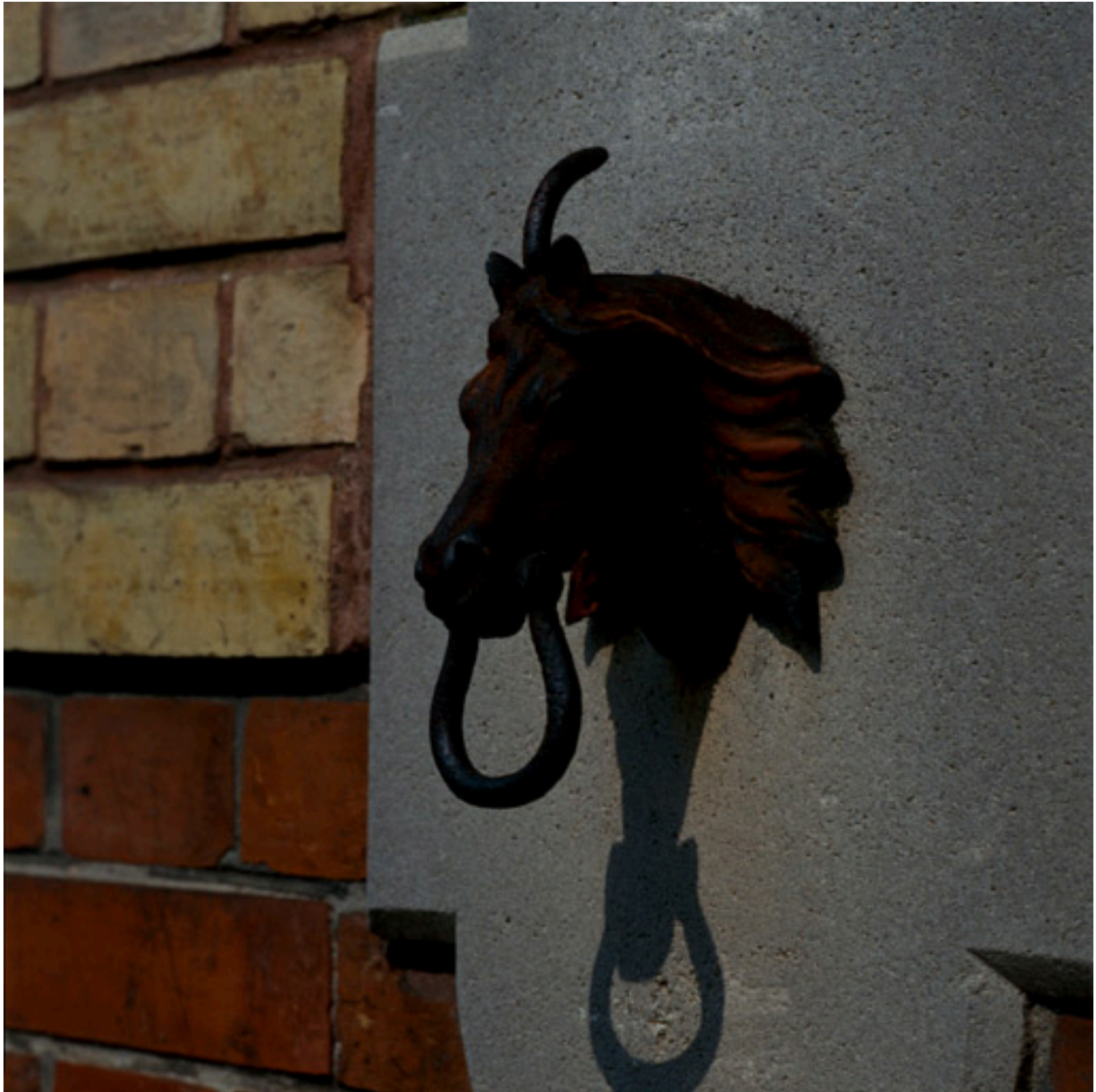
Anneau en fonte sur le mur de l'écurie.