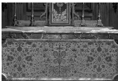
Vue générale de l'antependium du maître-autel.