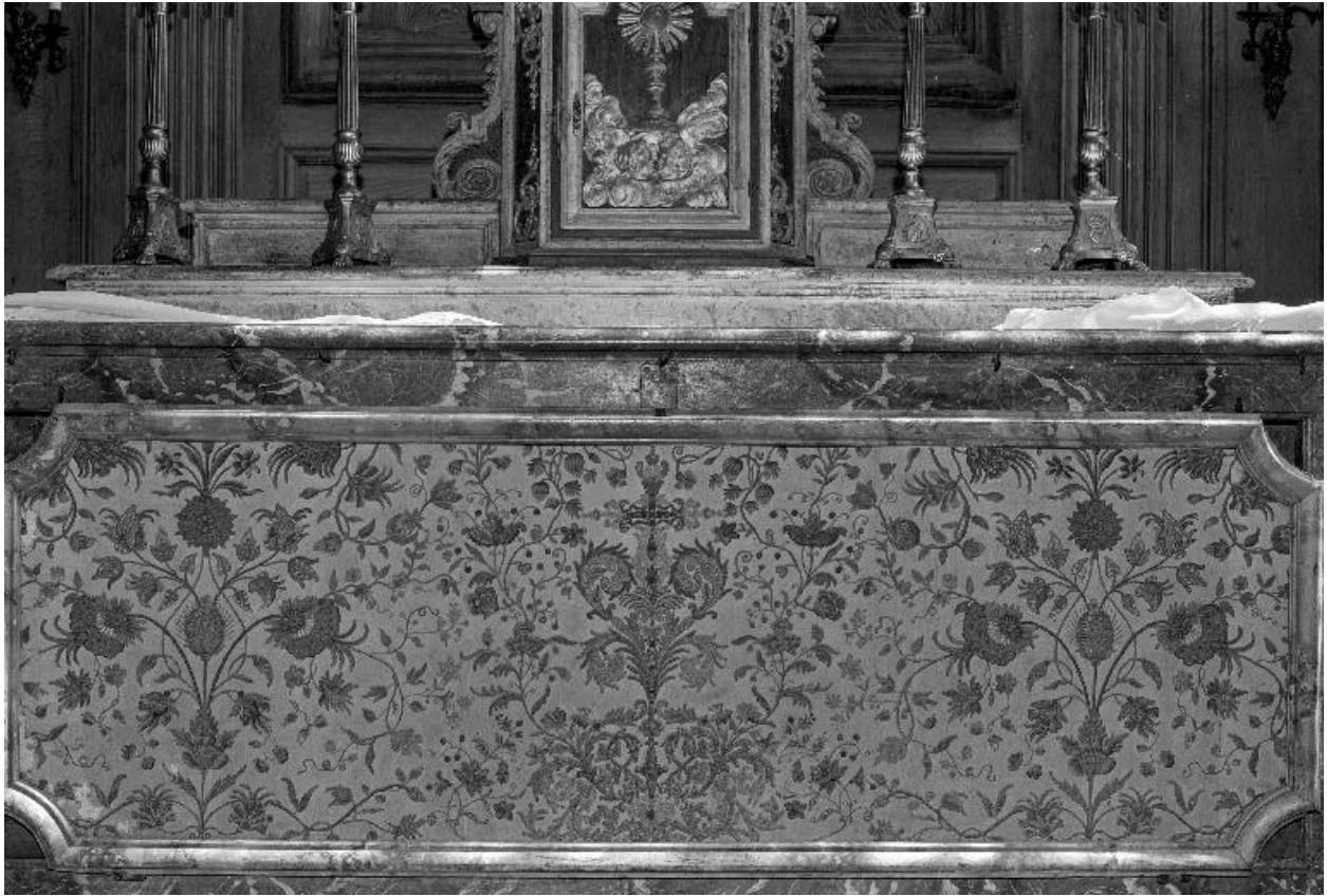
Vue générale de l'antependium du maître-autel.