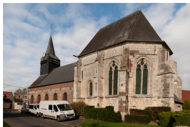
Élévation sud de la nef et chevet depuis l'est. IVR32_20226001140NUCA