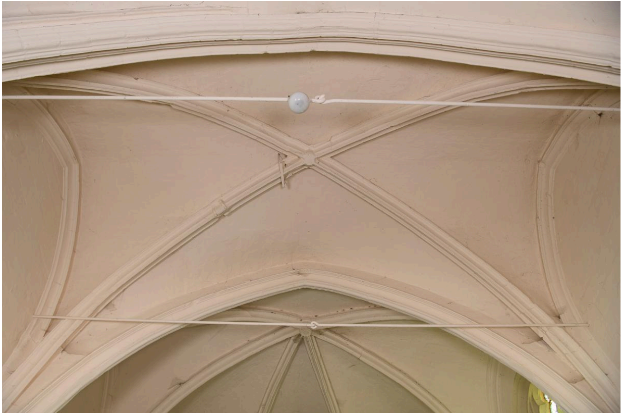
Voûte de la première travée du chœur.