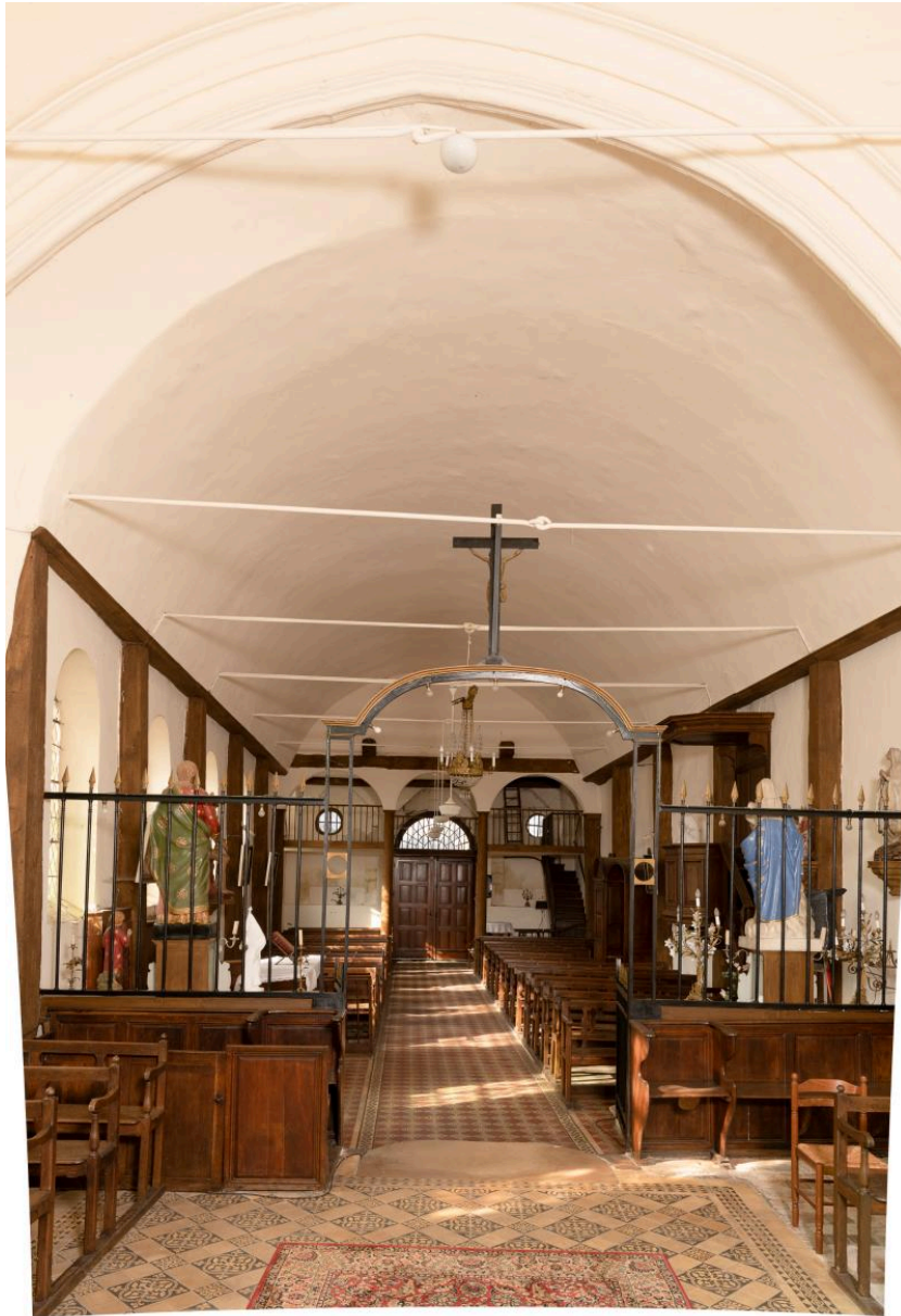
Vue intérieure vers la nef.