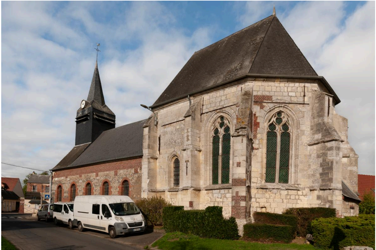
Élévation sud de la nef et chevet depuis l'est.