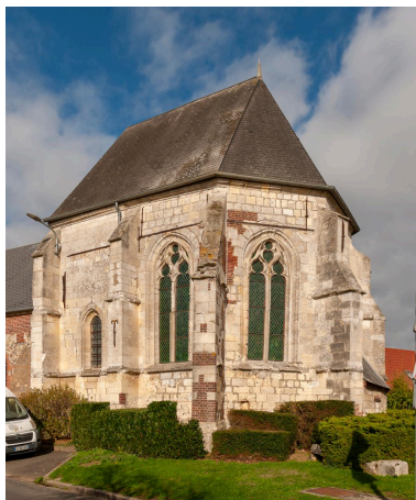
Chevet, vue depuis l'est. IVR32_20226001139NUCA