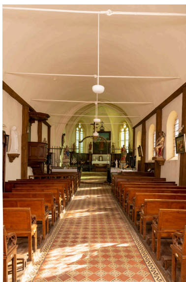
Vue intérieure vers le chœur. IVR32_20226001074NUCA