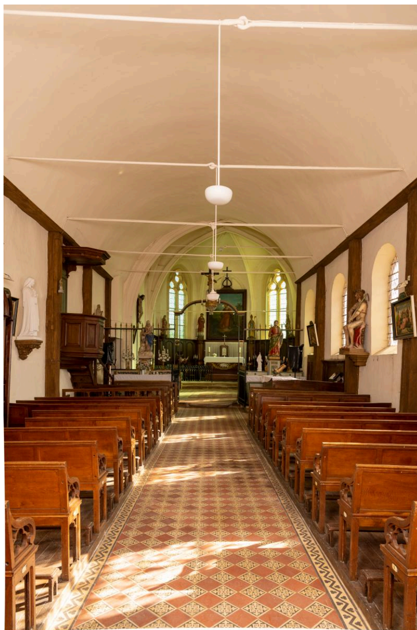
Vue intérieure vers le chœur.