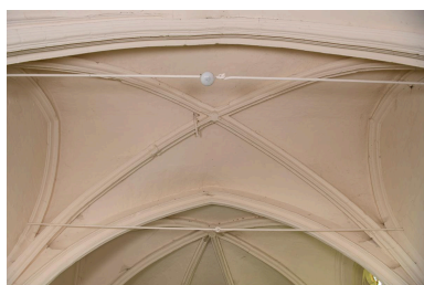
Voûte de la première travée du chœur. IVR32_20226001063NUCA