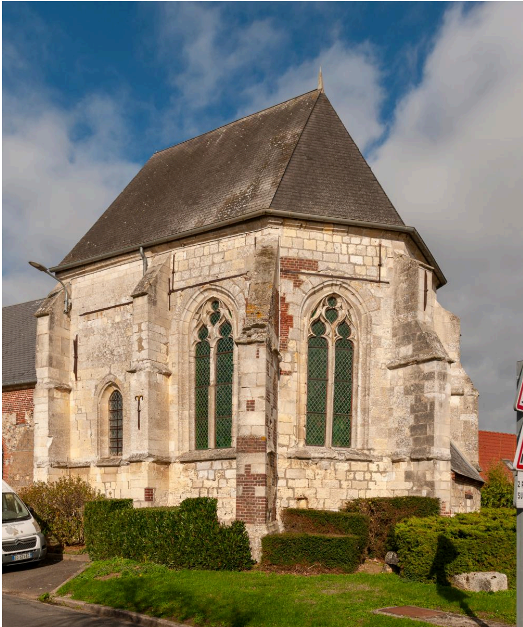
Chevet, vue depuis l'est.