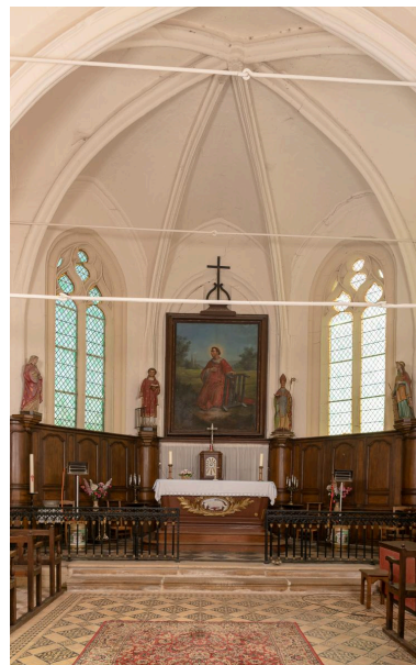
Vue générale du chœur.