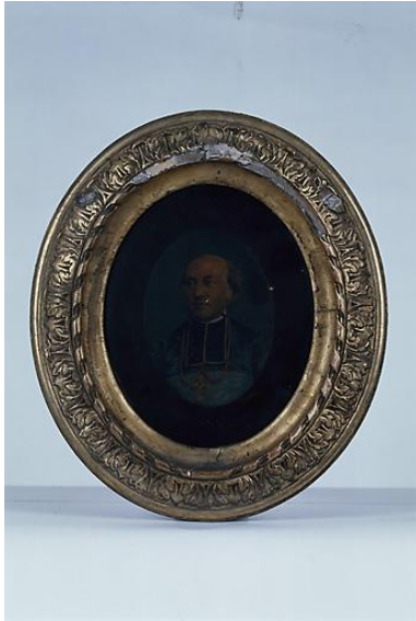
Vue générale. IVR31_19876201187XA