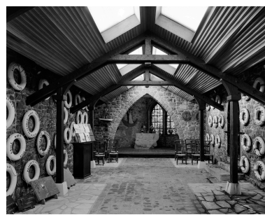
Vue générale intérieure vers autel.