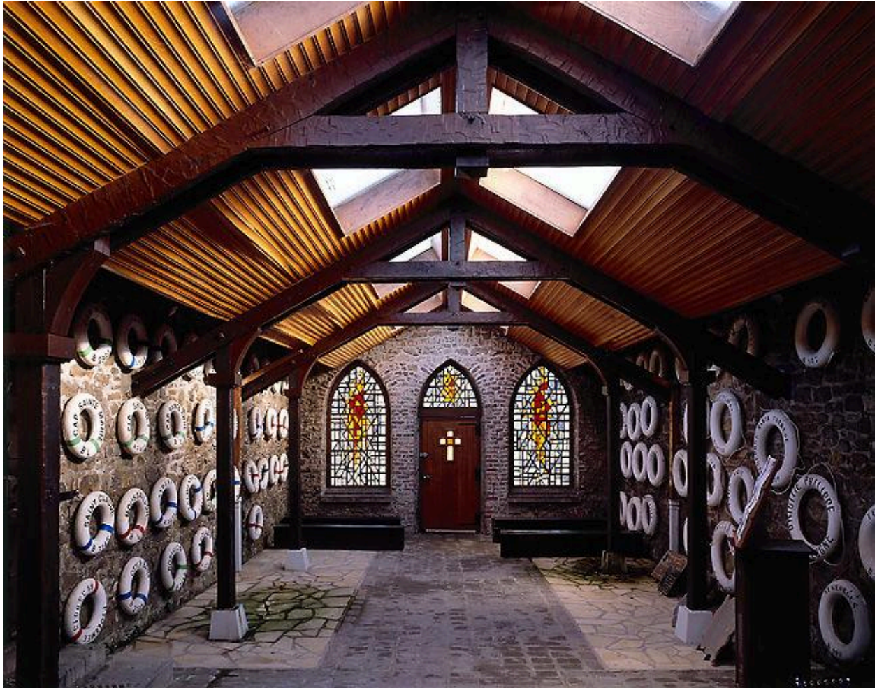
Vue générale intérieure vers entrée ; verrière Est signée Loire, Chartres, H : 220, LA : 102.