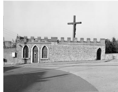
Façade sur voie. IVR31_19816203442X