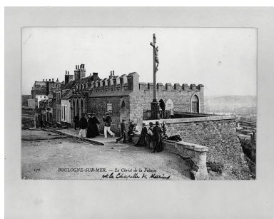
Vue d'angle nord de la rue de la Tour d'Ordre, carte postale. A.D. Pas-de-Calais, collection cartes postales. IVR31_19816200140XB