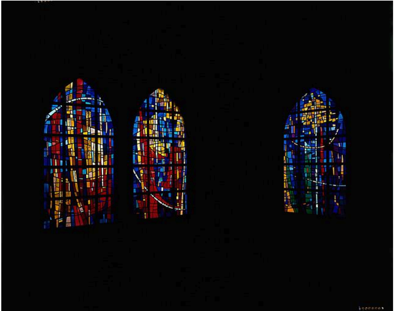
Trois verrières du chevet, vue d'ensemble ; verrière centrale signée Henry Lhotellier, datée 1974, H : 280, LA : 98.