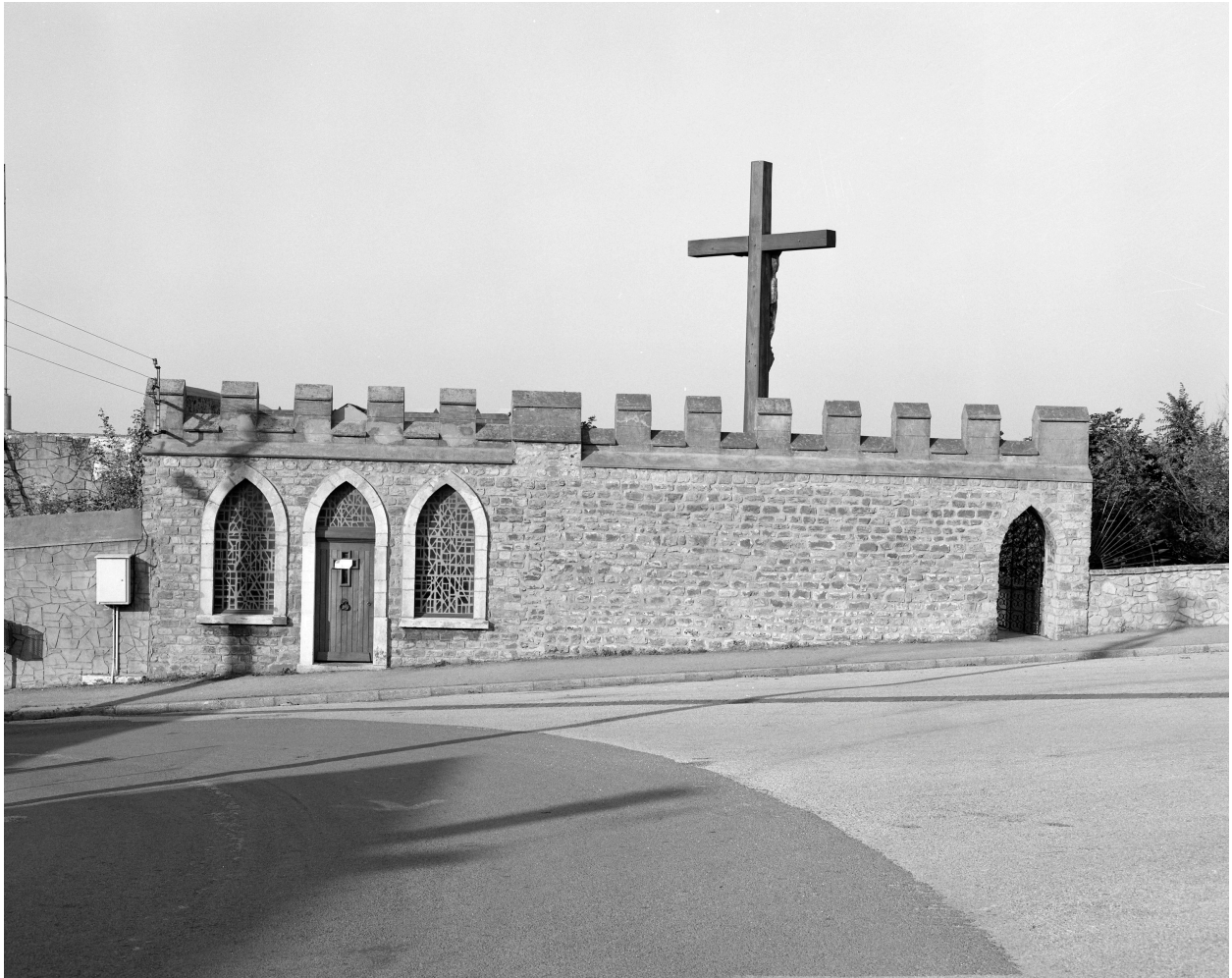
Façade sur voie.