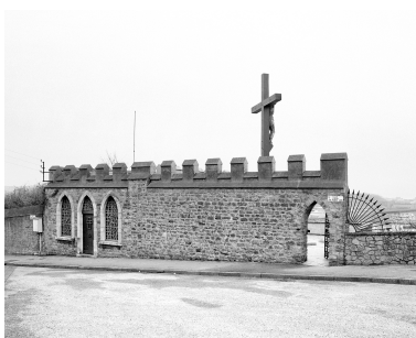
Vue d'angle sur voie.