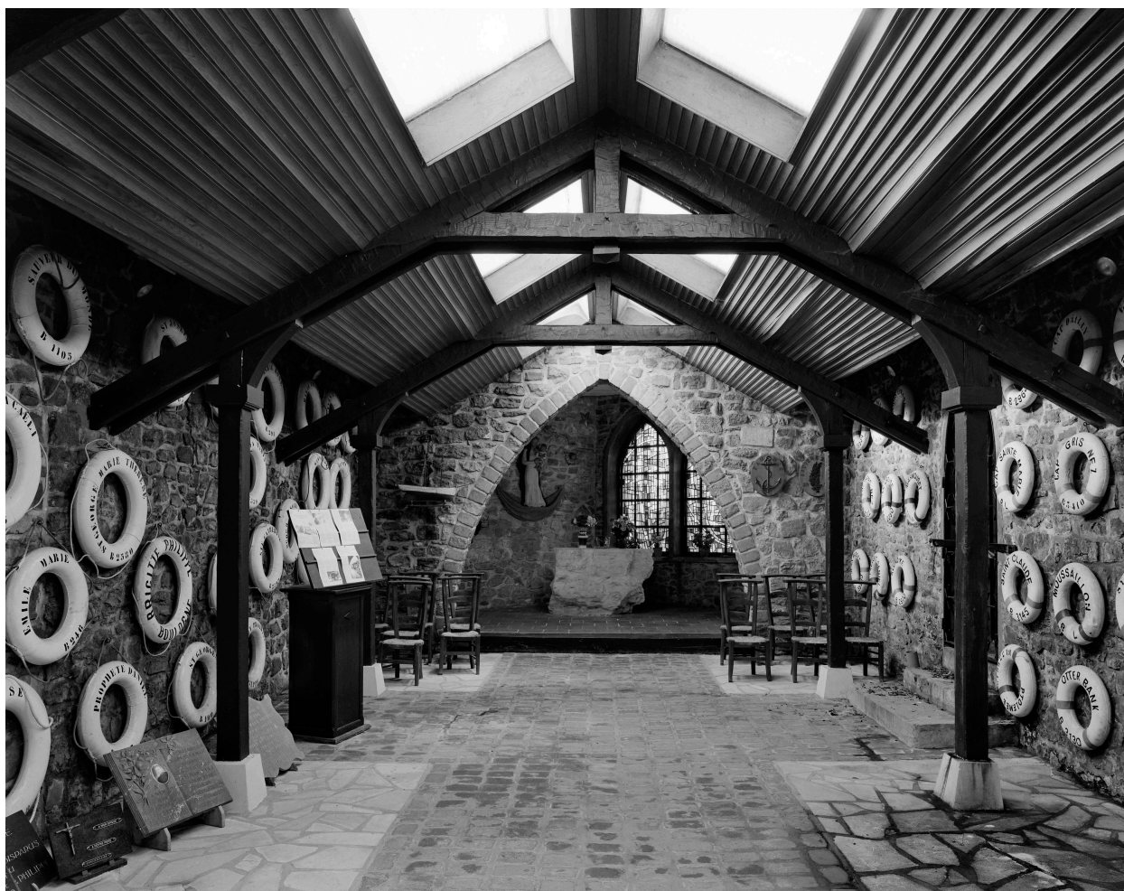
Vue générale intérieure vers autel.