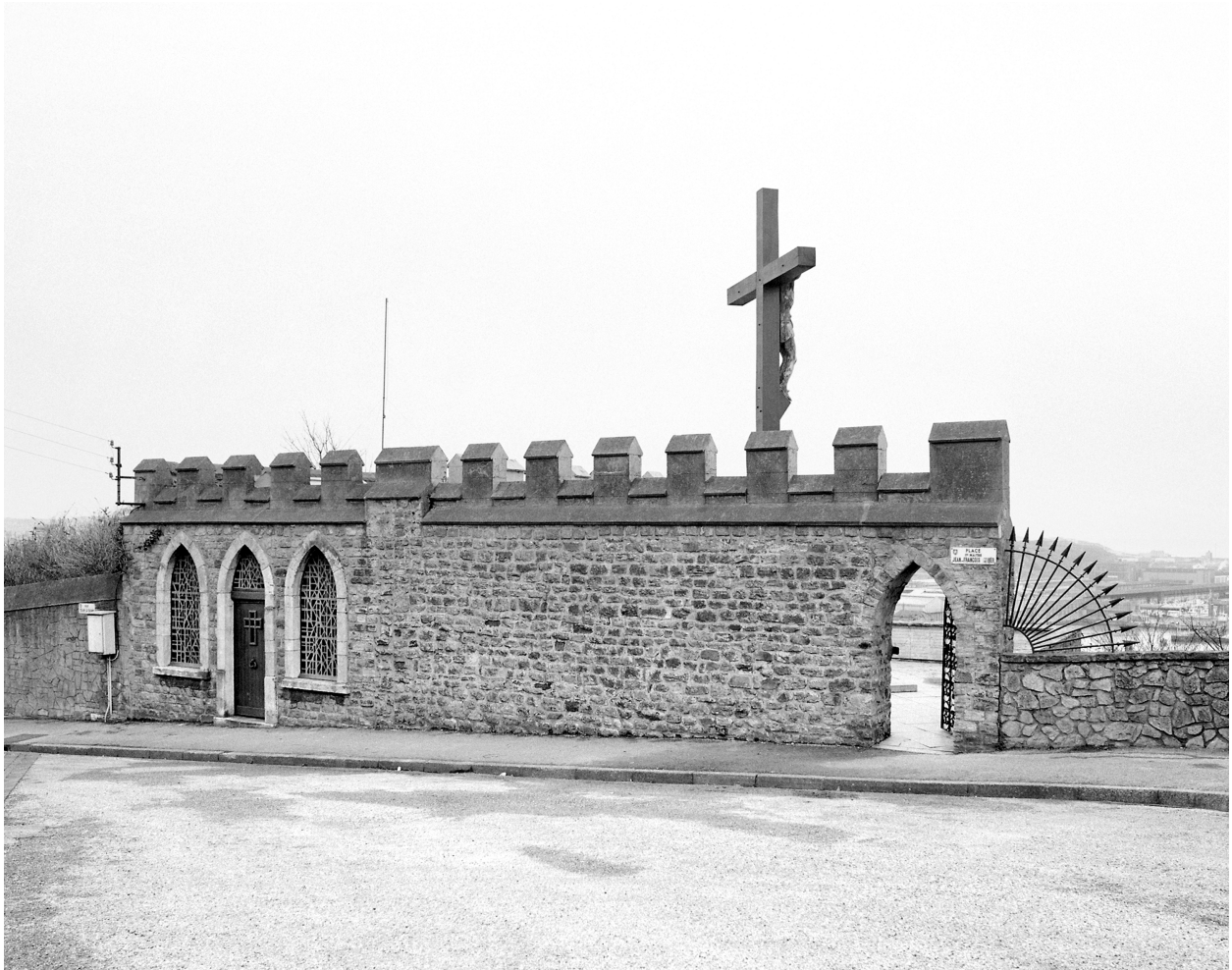
Vue d'angle sur voie.