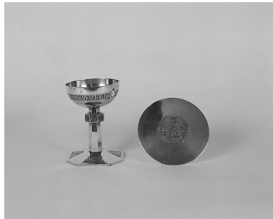
Vue d'ensemble. IVR31_19916200053X