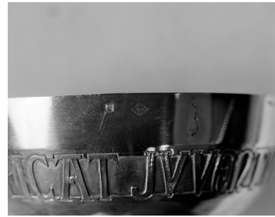
Poinçons. IVR31_19916200052X