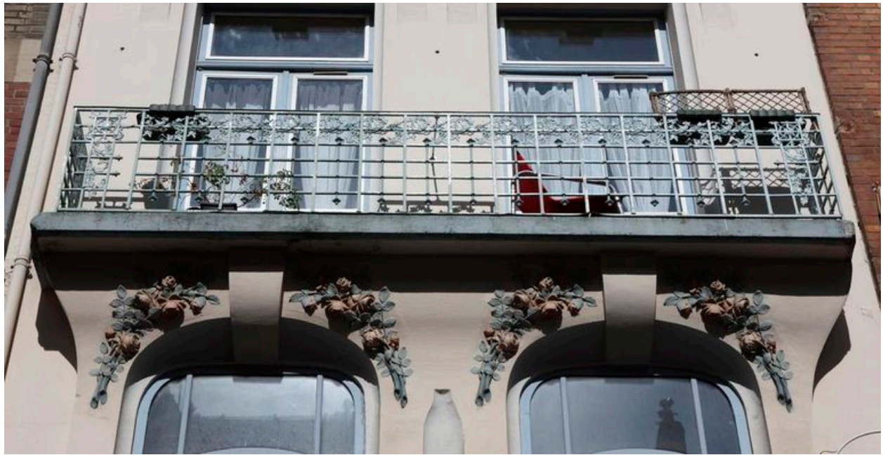
Branches florales sculptées sur les linteaux des baies.