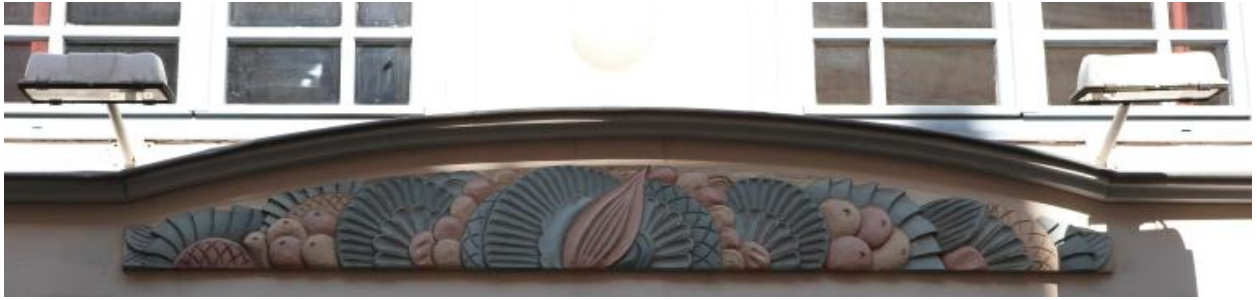
Fronton orné de décors circulaires et de fruits.