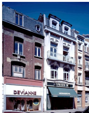
Vue générale. IVR31_20086200166VA