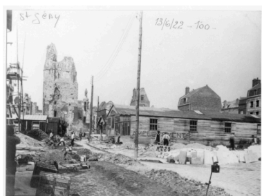
La rue Désiré-Delansorne (anciennement Saint-Géry), baraquements provisoires avant reconstruction. Photographie, 1922 (Médiathèque du patrimoine ; 142). IVR31_20096200307NUCB