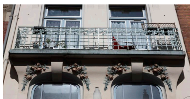
Branches florales sculptées sur les linteaux des baies.